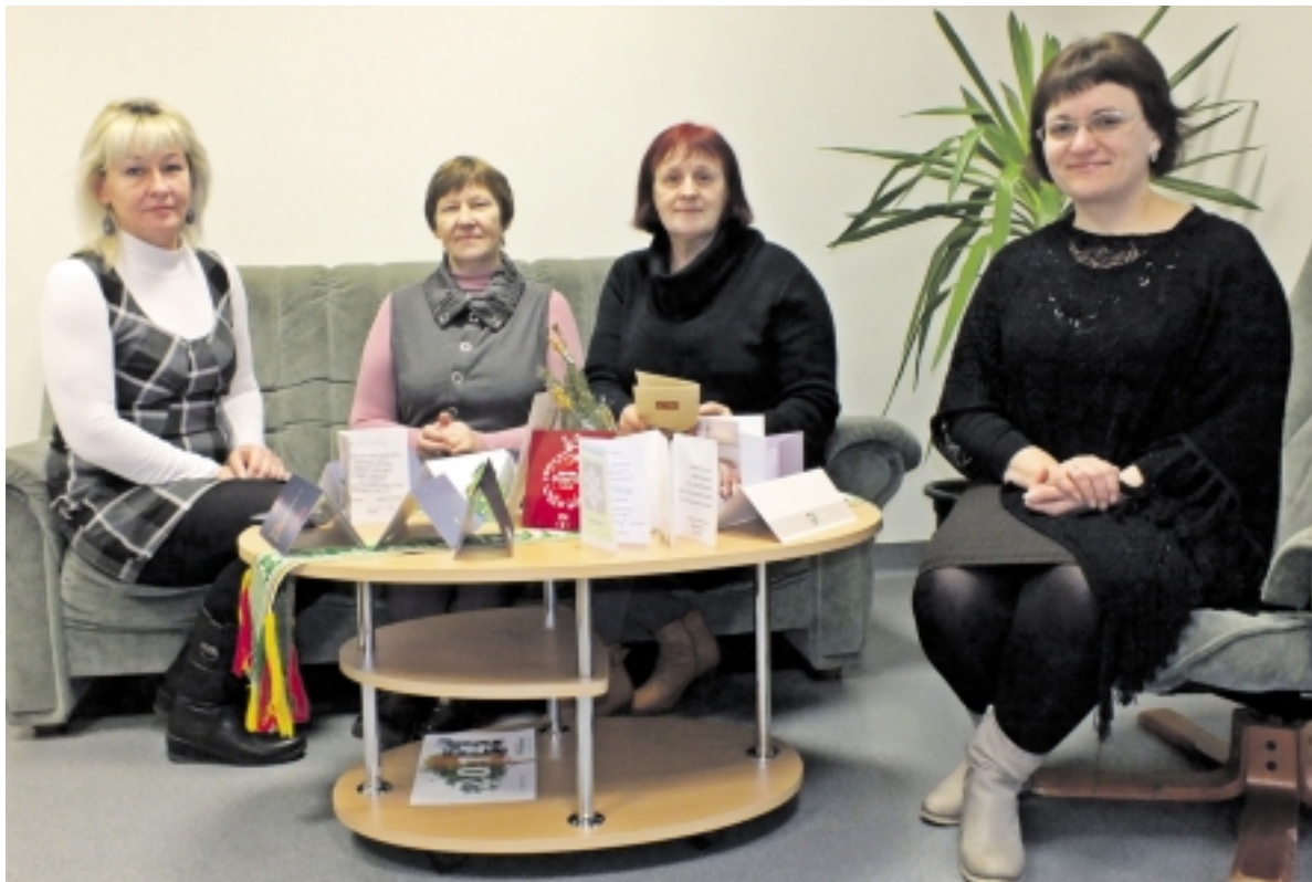
Pagėgių savivaldybės Kultūros centro darbuotojams šie metai nusimato tokie pat darbingi kaip ir praėjusieji 2013-ieji.