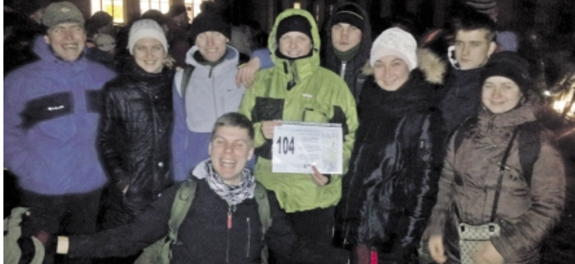
Klubo „Šiša“ komanda žygį pradėjo geromis nuotaikomis.

Šilutės šauliai pasirėngę žygiui.