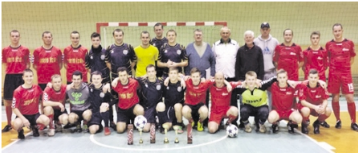
Naujametis futbolo turnyras, kuriame varžėsi pajūrio regiono teisėjai.

Šilutėje pirmą kartą buvo surengtas Naujametis futbolo turnyras, kuriame tarpusavyje varžėsi pajūrio regiono futbolo teisėjai. Į draugišką kovą turnyre pasivaržyti aikštelėje susirinko trys teisėjų komandos: Klaipėdos, Šilutės ir jungtinė Palangos, Kretingos bei Gargždų.