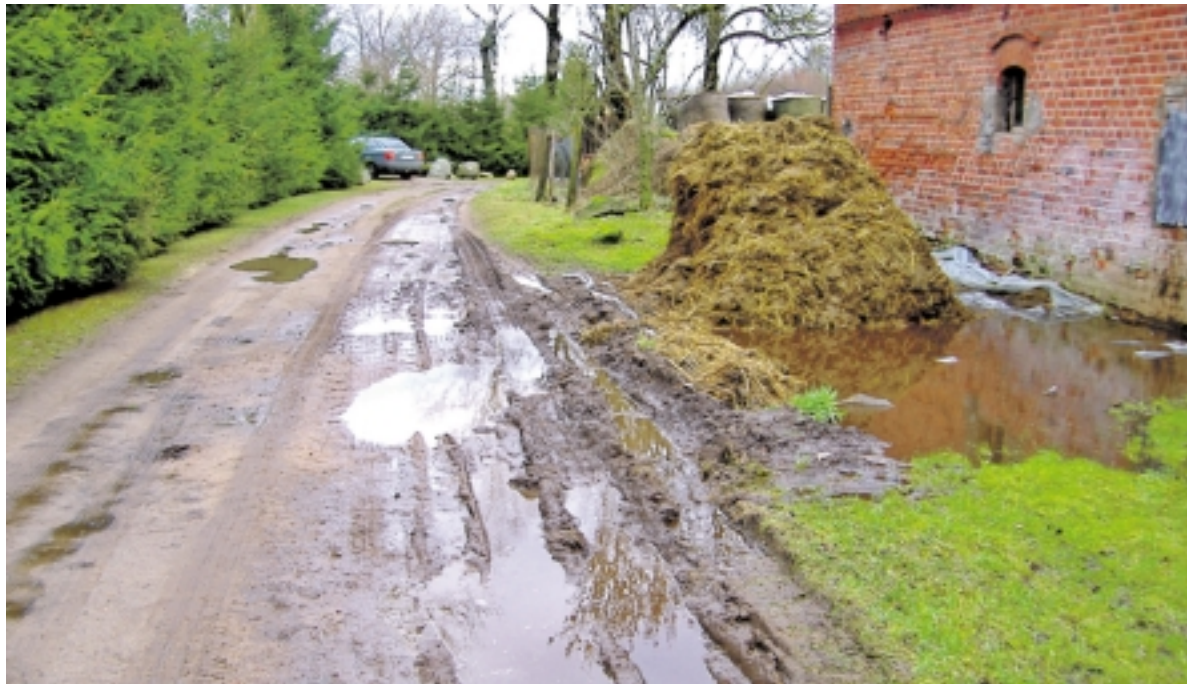
Toks vaizdelis „puošia“ kelią per Uikščių kaimą.