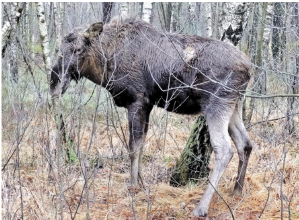
Briedis sekmadienį atrodė apgailėtina.