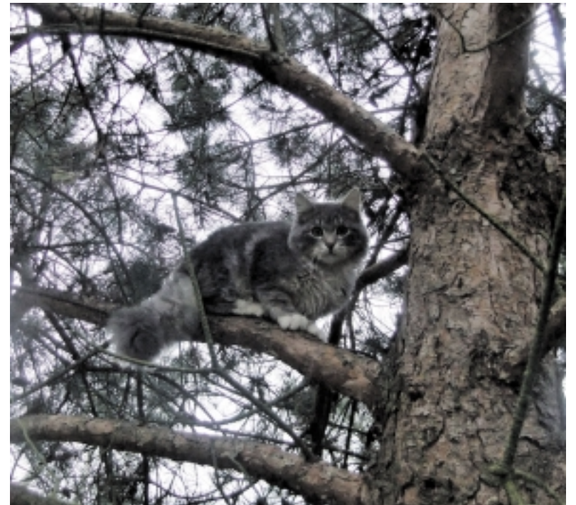
Asta: „Mūsų rastinukas Rainiukas. Mylime jį iš visos širdies“.

Tad nelikime abejingi pamatę beglobį gyvūnelį – juk jis negali sau pasistatyti namų, nusipirkti maisto, susirasti jį mylinčių draugų. Tik žmogus gali gyvūnui suteikti šilumą, meilę, pasirūpinti juo, rasti jam jaukų kampelį namuose. Tik visi kartu galime išspręsti šią skaudžią problemą ir pasirūpinti, kad gatvėse liktų kuo mažiau ar net išvis nebeliktų beglobių gyvūnų.