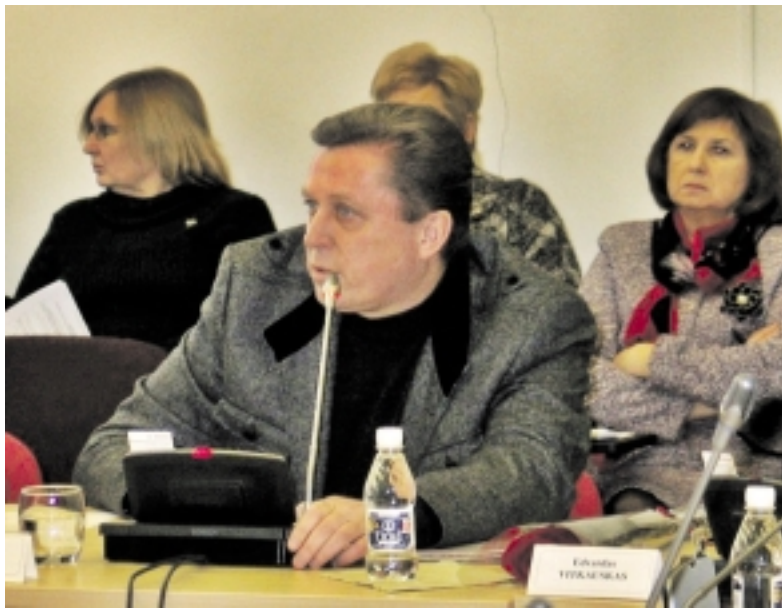
A. Jakas niekaip negalėjo suprasti, kodėl neparengtas aiškinamasis raštas.

Vėliau jis sužinojo, kad grupė Tarybos narių opozicija pasiskelbė nesilaikant Savivaldos įstatymo. Todėl negalėjo siūlyti savo kandidatų į Kontrolės komiteto ir Etikos komisijos pirmininkų postus. Tai buvo padaryta šio Tarybos posėdžio pabaigoje, kai po viešo pareiškimo Taryboje buvo registruota opozicija. Pagal įstatymą jai dar reikės pateikti savo veiklos planą.