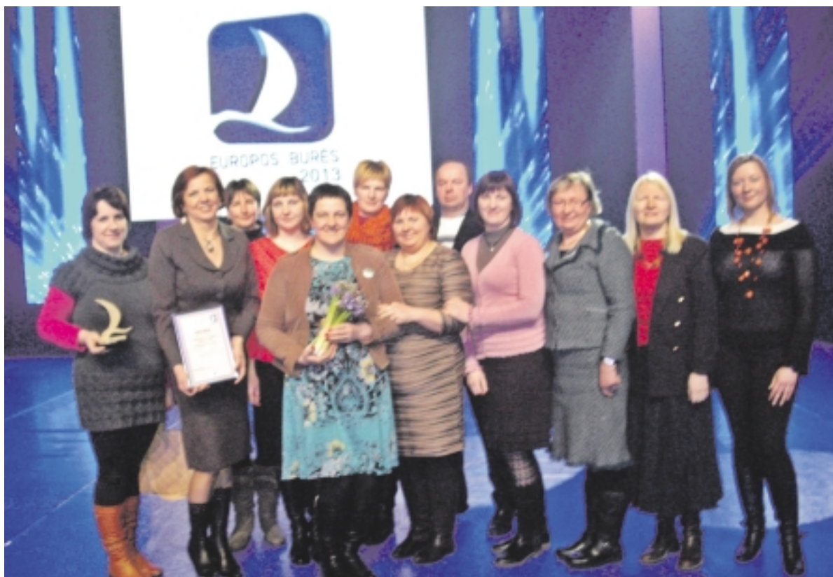
Pagėgių savivaldybės Socialinių paslaugų centro darbuotojai su partneriais vilniečiais „Europos burės 2013“ apdovanojimuose.

Tradicinius „Europos burių 2013“ rinkimus, jau septintą kartą rengiamus Lietuvos Respublikos Finansų ministerijos, šiemet laimėjo devyni Europos Sąjungos struktūrinių fondų lėšomis įgyvendinti projektai iš 129, pareiškusių norą juose dalyvauti. Tarp tų devynių nugalėtojų apdovanojimu džiaugėsi ir Pagėgių Savivaldybės Socialinių paslaugų centro darbuotojai.