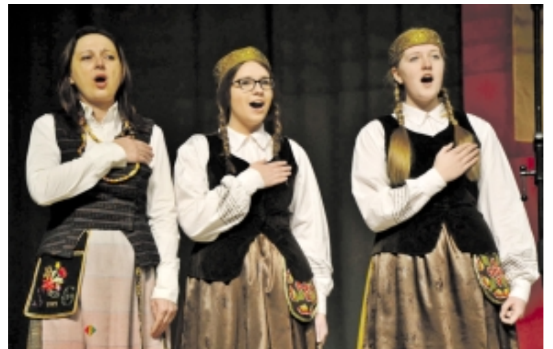
Šventiniame renginyje susijungė jaunimas ir tremtį išgyvenę.

Jubiliejinio renginio dalyviai tą dieną turėjo galimybę stebėti ir filmą „Su Lietuva širdyje“, o vakare pasimelsti Šilutės šv. Kryžiaus bažnyčioje bei pasiklausyti mišraus kamerinio choro „Vox Libri“ atliekamų giesmių.