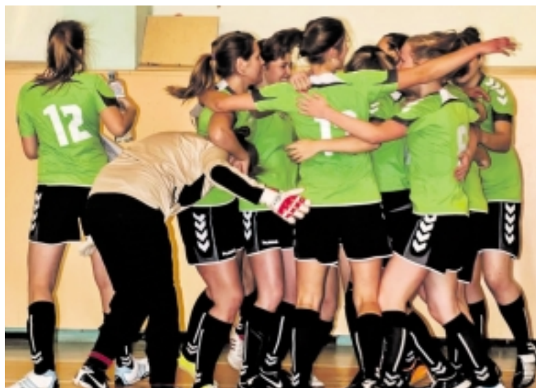
Šilutės MFK „Blizgės“ startavo žiemos uždary patalpų futbolo čempionate.

Savaitgalį įvyko tradicinio moterų žiemos uždary patalpų futbolo čempionato, skirto Lietuvos valstybės atkūrimo dienai pažymėti, pirmas etapas. Pirmajame etape 16 komandų buvo suskirstytos į 4 zonas po 4 komandas. Į C zoną pateko Šilutės MFK „Blizgės“ futbolistės, kurios išvykoje Ukmergėje sužaidė tris rungtynes su pogrūpio varžovėmis.