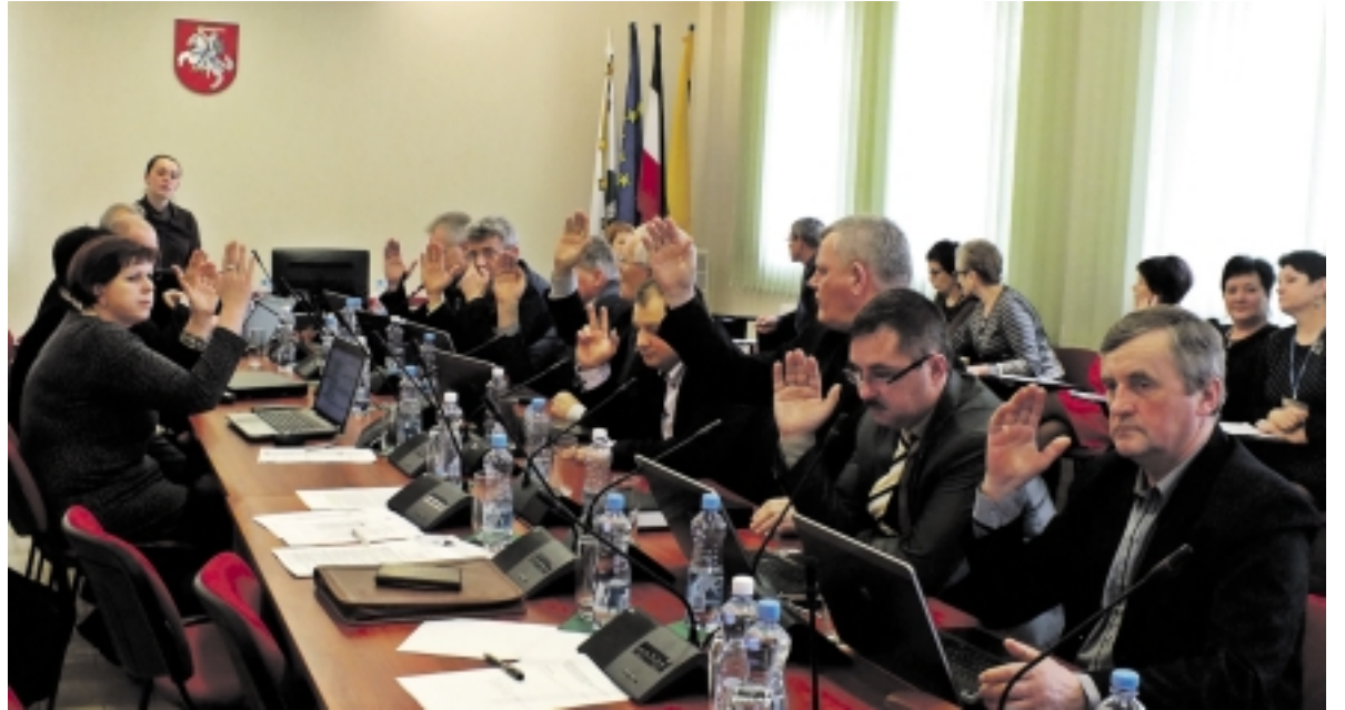
13 Tarybos narių rankų pakėlimu vienbalsiai nutarė – skirti 300 tūkst. litų Šv. Kryžiaus bažnyčios remontui 2014 metų Pagėgių savivaldybės biudžeto projekte yra reikalinga.

Šiandien patys žinote, kaip prastai atrodo jos fasadas, todėl iškilo pasiūlymas ir prašymas Tarybos narių bei Administracijos rasti lėšų bažnyčios sutvarkymui. Pagėgiškių vardu siūlau iš projektų rengimo ir teritorijų planavimo programos perkelti 300 tūkst. litų į nevyriausybinį ir visuomeninių organiza-