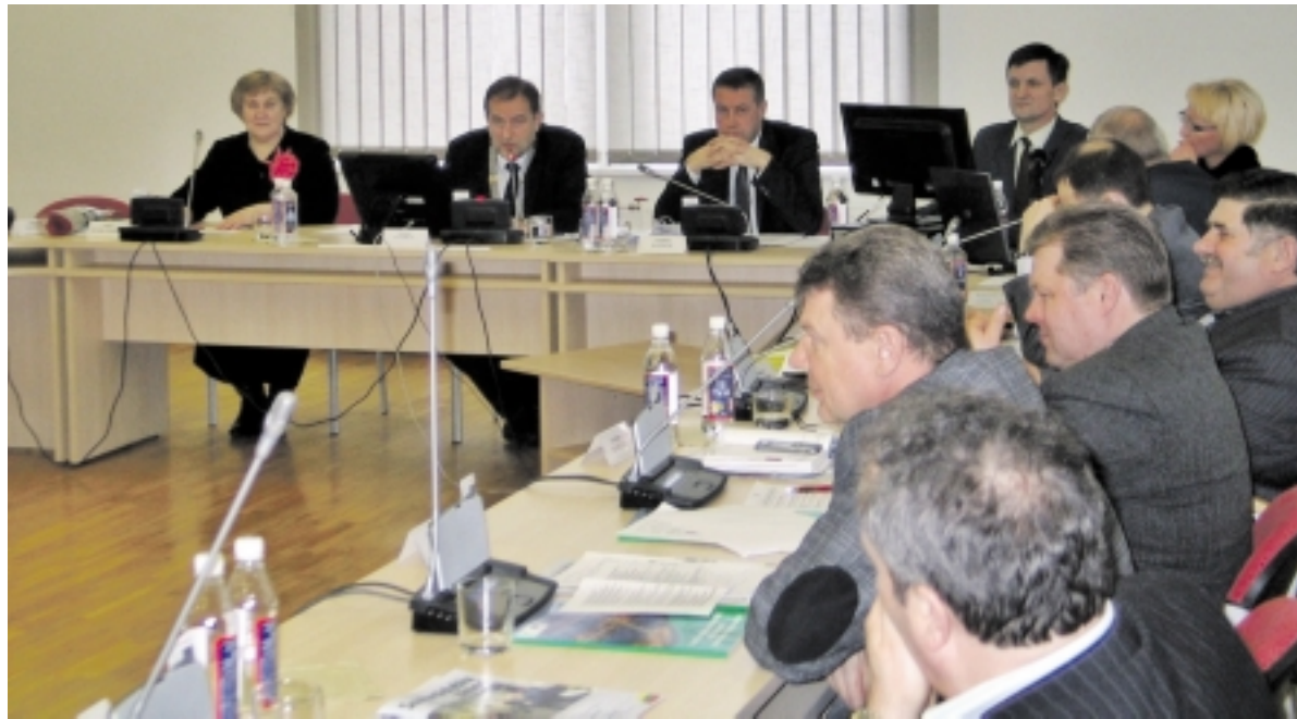
Politinė Šilutės tarybos dauguma į kompromisus su opozicija nesileido.

Vietos savivaldybėms yra numatyta galimybė „auklėti“ savo nekilnojamo turto nepriziūrėjus piliečius, kurie jį valdo rajonų savivaldybėse. Tam numatyta ekonominės sankcijos – Savivaldybės taryba tvirtina mokesčio tarifą jį keldama iki 2 nekilnojamojo turto mokestinės vertės. Šis sprendimo projektas, kai tik pasirodė viešojoje erdvėje, iškart suintrigavo ne vieną, nes gyventojai dažniausiai žino, kas valdo ir nepriziūri savo turto. Tad pasirodęs toks sąrašas, į kurį patenka apie 100 tūkstančių litų per metus. apie 100 tūkstančių litų per metus.