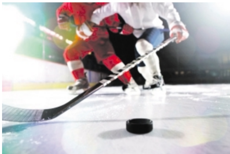
„Šilutės“ ledo ritulio komanda po dvejų praėjusių savaitę sužaištų rungtynių – devintoje turnyrinės lentelės vietoje.

Rungtynių favoritais laikyti plungiškiai dar pirmajame čempionato rate „Šilutę“ įveikė rezultatu 5:1, tądien dar pirmą rungtynių minutę, po sėkmingos atakos, praleido įvartį. Tiesa, nesdartinį kaip įprasta rungtynėse, mat ritulys kelią į vartus rado įmestas iš už vartų linijos. Po pirmojo praleisto įvarčio plungiškių veidai patišo ir buvo galima išvėlgti panikos minų. Pirmasis kėlinys taip ir baigėsi – 1:0 „Šilutės“ naudai.