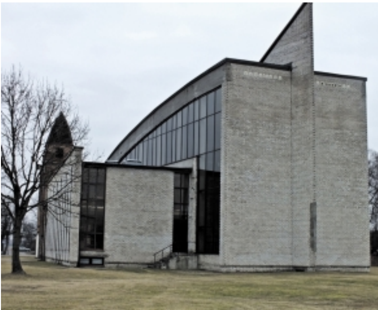
Pagėgių Šv. Kryžiaus bažnyčia.