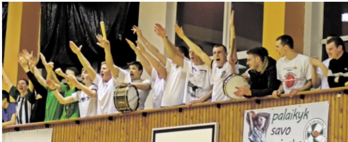
Nuostabūs „Šilutės“ fanai, komanda palaikantys ir išvykose.