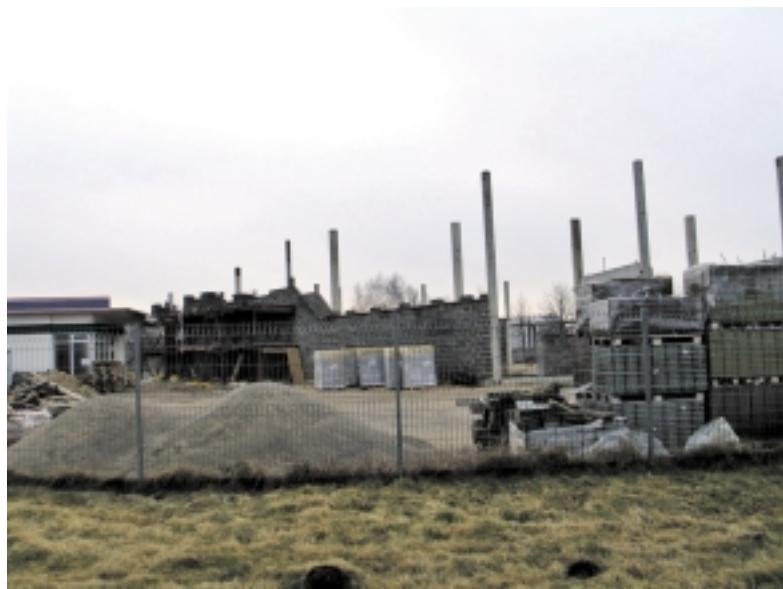
Viena iš nedaugelio investicijų į Šilutės miestą, tačiau ji vietinė, o ne užsienio.

Dėl didelio kvalifikuotos darbo jėgos trūkumo, būtina reformuoti specialistų rengimo ir perkvalifikavimo sistemą, į tai įtraukiant ir