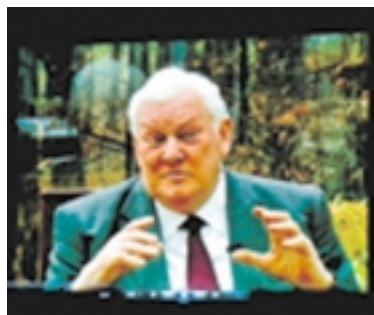
Stop kadras iš Editos Mildažytės filmo „Post Scriptum. Pamišti sakiniai“.

Kovo 3 d. Pagėgių Algi- manto Mackaus gimnazijon suguzėjo gausus būrys gimna- zistų, mokytojų, miesto gyven- tojų bei Savivaldybės darbuo- tojų kartu prisiminti a. a. Lie- tuvos Prezidentą Algirdą My- kolą Brazauską. Susirinkusie- ji turėjo puikią galimybę pa- matyti dokumentinį Editos Mildažytės filmą „Post Scrip- tum. Pamišti sakiniai“, de- dikuojamą prieš 20 metų pir- mą kartą išrinktam tiesiogini- nių rinkimų metu Lietuvos Prezidentui A. M. Brazauskui.