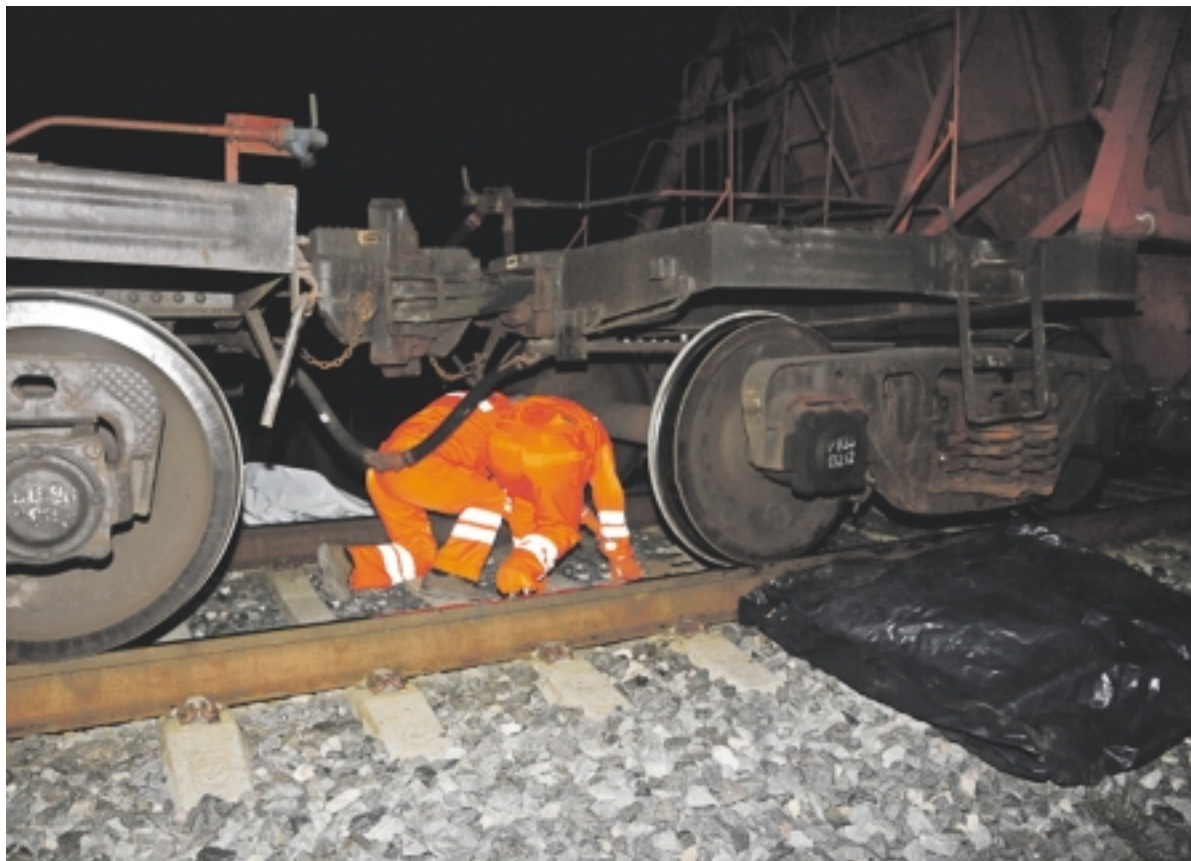
Anot liudininkų, vaikas nusizudė negalėdamas pakęsti nuolatinių konfliktų namuose. Asociatyvi nuotrauka