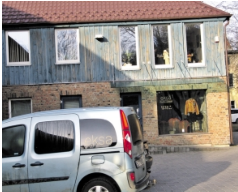
Dėl ekonominių, o ne dėl politinių priežasčių, šilutiškių pasiūtų kailinių mažiau šią žiemą buvo nupirka Sibire.

Iki pastarųjų metų, šilutiškiai siuvo daugiausiai Rusijos rinkai.