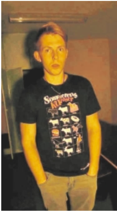
Aurimui Einikiui reikalinga jūsų pagalba.