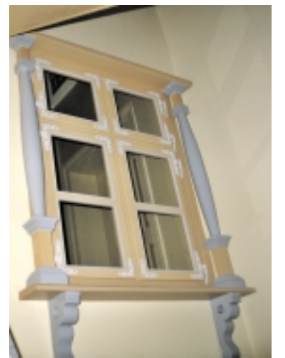
Vidinis dvaro langelis.

kiek mažai vietos šiame dvare. O ir tą labai ribotą erdvę mažino techniniai sprendimai. Kad ir lifto negalims lankytojams įrengimas. Jis