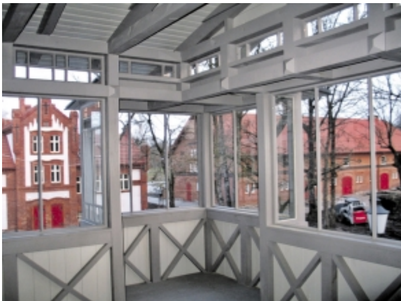
Vaizdas iš atkurtos verandos labai gražus.

dėl savo specifikos ir didelių apimčių užėmė dviejų iš šiaip jau didelių patalpų vietą. Tad muziejninkams teks gerai pasukti galvą, kaip išdėlioti sukauptas istorines vertybes.