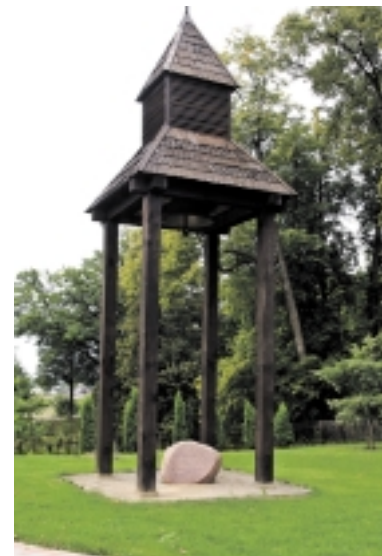
čiosius, kvies maldai ir susimąstymui, palydės paliekančius šį pasaulį...

Iniciatoriai tikisi idėją sudominti ir patraukti ne tik dabartinius, bet ir buvusius katiškius, kurie, nors gyvena kitur, savo miesteliui tebėra neabejingi ir nori matyti jį vis kažkuo atsinaujinantį. Tai turėtų juos paskatinti ir pakviesti tik dar dažniau čia sugrįžti. Šiuo atveju tai būtų suklusti priverčiantys, žinią per visą miestelį nešantys ir jo gyventojus suvienijantys varpo dūžiai. Katyčių varpas burs tiki-