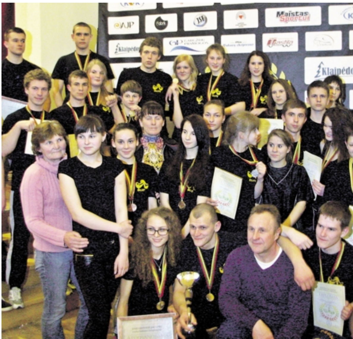
Gausus būrys stipriausių rankų savininkų susitikusių čempionate Klaipėdoje.

Gausus stipriausių rankų savininkų būrys susirinko XVIII-ajame Lietuvos Jaunimo rankų lenkimo čempionate, Klaipėdoje. Šiame renginyje dalyvavo daugiau nei pusantro šimto sportininkų iš Mažeikių, Radviliškio, Klaipėdos, Šiaulių, Skuodo, Gargždų, Šakių ir Šilutės.