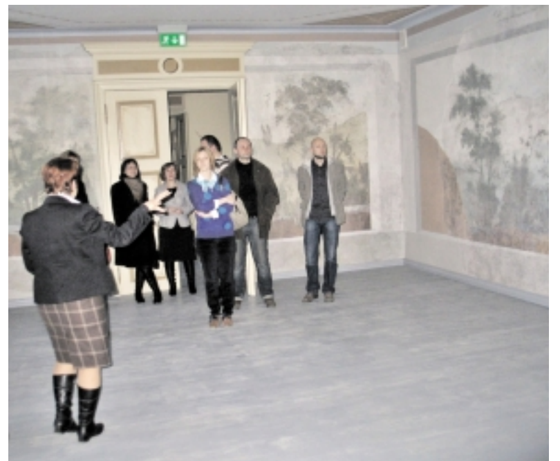
Reprezentacinė dvaro salė, kurioje galės vykti konferencijos ir iškilmingi renginiai.