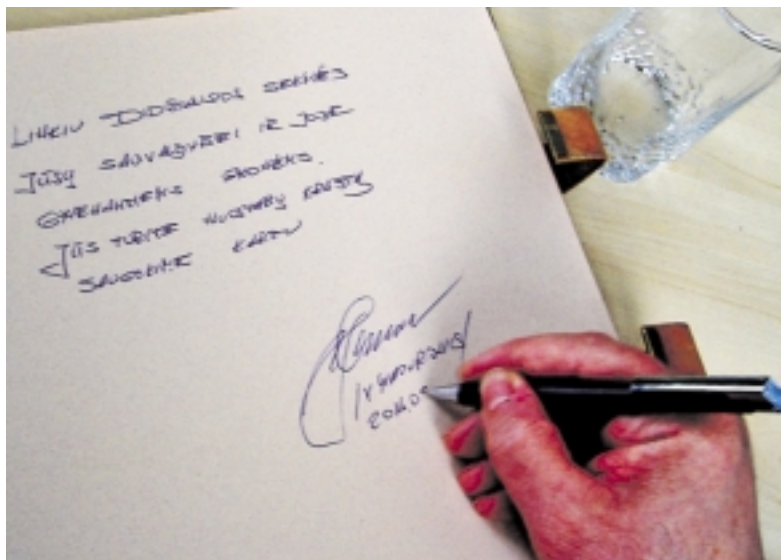
Aplinkos ministras Valentinas Mazuronis Savivaldybės svečių knygoje parašė palinkėjimą Šilutės krašto gyventojams.