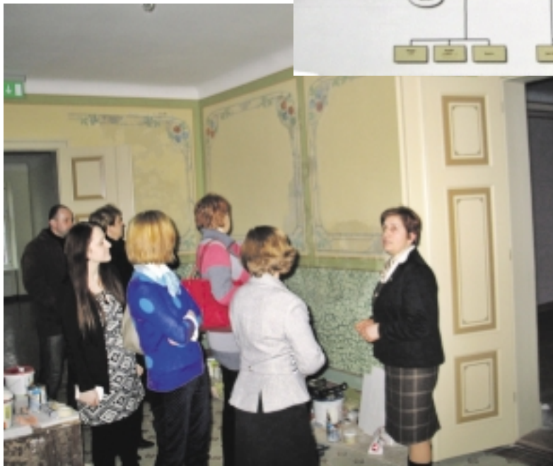
Gražiai dekoruotas holas pasitiks lankytojus.

Vėliau, taip pat remdamasis žemėlapiais, mokslininkas aptarė, kaip Šilokarčemos dvaras kito ir evoliucionavo, kaip buvo perstatomas, rekonstruojamas bei kaip kentėjo nuo gaisrų. Ir baigė tuo, kad ne tik dabartinėje dvarvietėje,