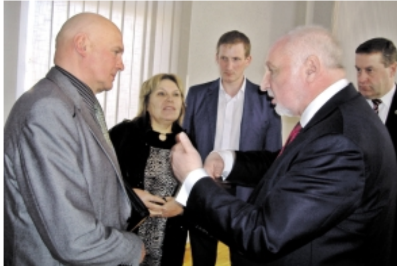
Susitikimui pasibaigus šilutiškiai ministru V. Mazuroniu asmeniškai uždavė klausimų, išsakė savo problemas.

renovuota daug namų, pagražės jų išorinis vaizdas. Teigė norinti padėkoti Savivaldybei už gerą darbą, nes mūsų krašte jau „startavo“ 12 renovacijos projektų. Pasak jos, Šilutėje jau šiais metais prasidės realūs darbai, reikės kontroliuoti, kad darbai būtų atlikti kokybiškai. Kartu su Valstybine teritorijų planavi-