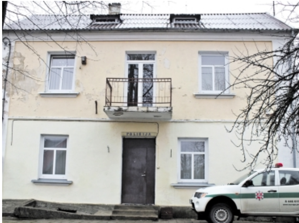
Šiame Žemaičių Naumiesčio policijos nuovados pastate dirba vos keturi policijos pareigūnai, kurie neretai net nebūna vietoje, mat vyksta į įvykius, patruliuoti. Tad naumiestiškiei įsitikinę, jog šį pastatą būtų galima panaudoti kur kas išmintingiau.