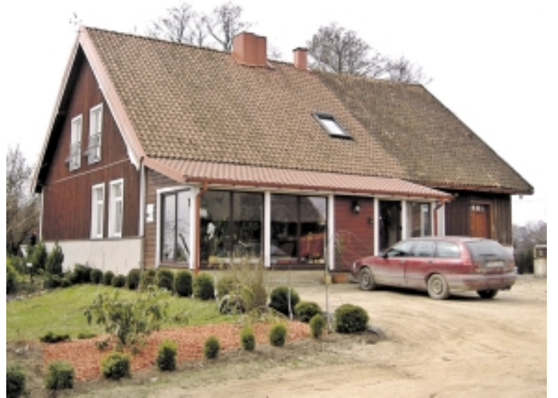
Šitame name akščiau buvo Šyšgirių pradinė mokykla. Ją uždarius pastatą įsigijo ūkininkų šeima ir tą pastatą gražiai suremontavo.