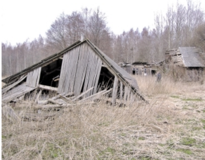
Yra Šyšgiriuose ir tokių namų.

Deja, šiandien Šyšgiriiai – jau nykstantis kaimas.