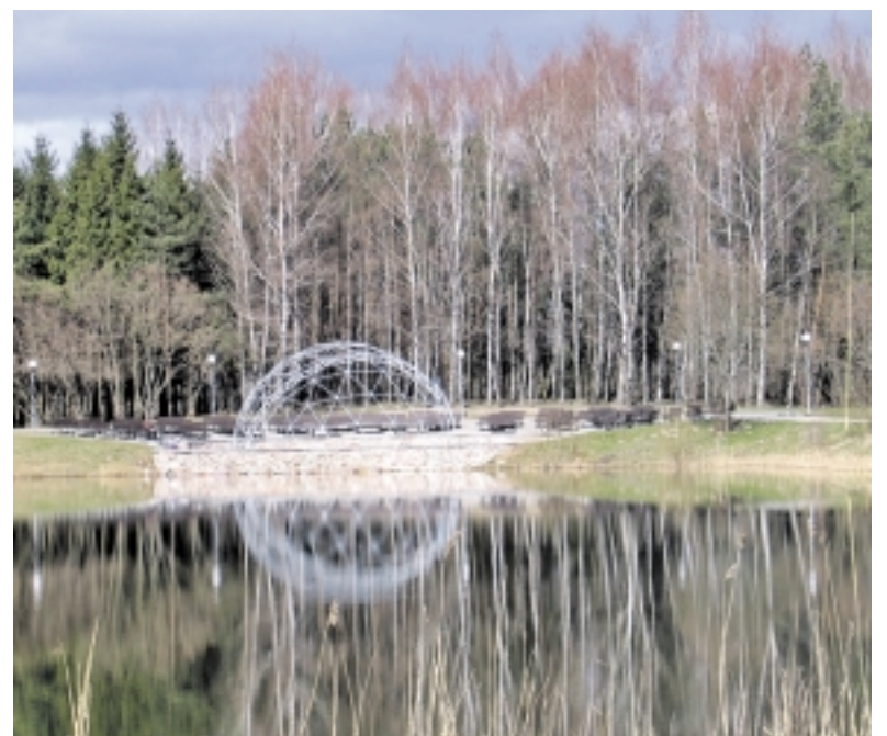
Naujam gyvenimui padedant ES fondams prikeltas Juknaičių parkas.