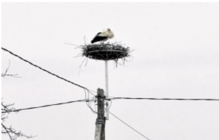
Gandrai Švėkšnoje po „rekonstrukciją“ pripažino naują lizdą.

Balandžio 3 dienos rytą prie to paties stulpo vėl atvažiavo prieš kelis mėnesius barbariškai sunaikinę gandravidį UAB „Klaipė-