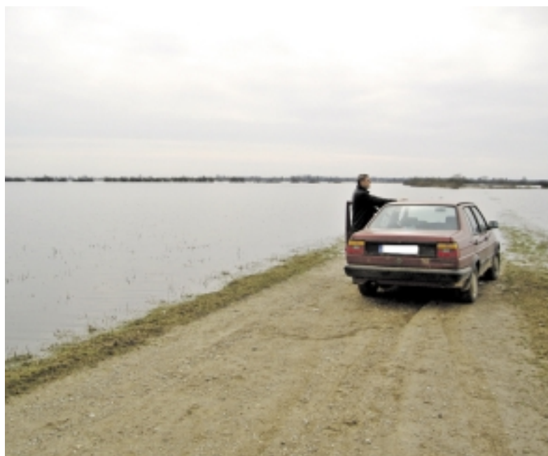
Nemažą dalį Šyšgirių kaimo šiuo metu yra apsėmę potvynio vandenys.

nas žmogus, sužinojęs, kad tiek mažai mes uždirbame, nepatikėdavo. Mokėdavo už bulių prieaugį“, – prisiminė Z. Judžentienė.