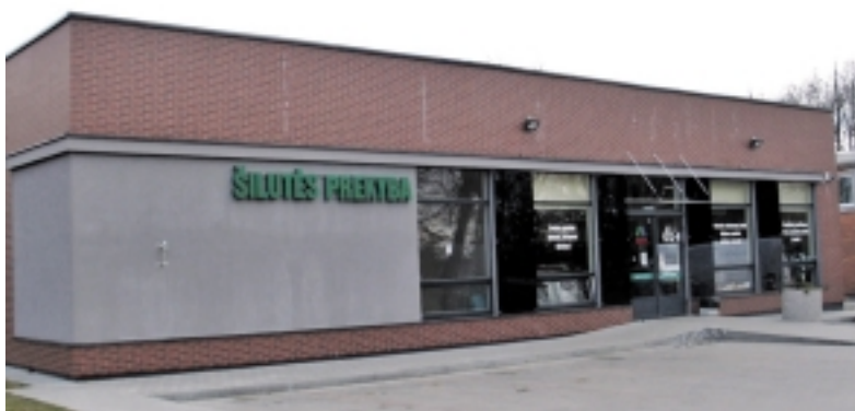
Juknaičius labai pagyvino moderniai rekonstruota „Šilutės prekybos“ parduotuvė.