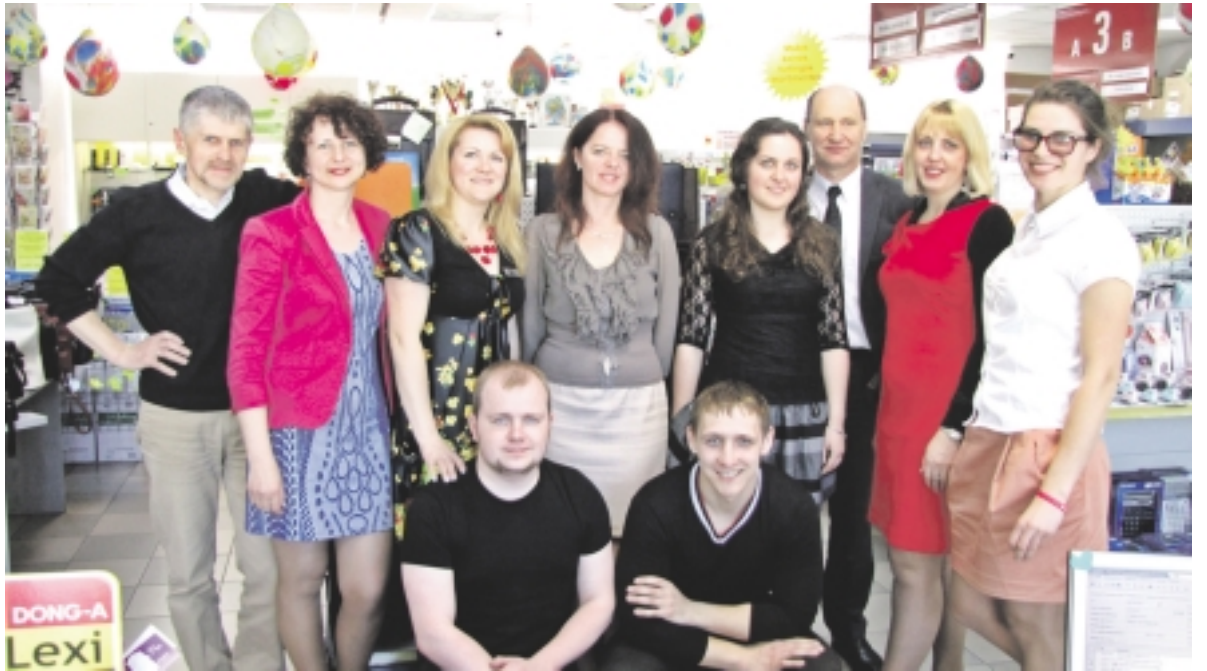
Šilutės Info-Tec kolektyvas šventė dvidešimt metų jubiliejų.

Tikriausiai neatsirastų nė vieno šilutiškio, kuris nebūtų girdėjęs vardo „Info-Tec“. Tai viena seniausių sėkmingai veikiančių įmonių visame Šilutės rajone. Jau du dešimtmečius šilutiškius aprūpinanti įvairiomis kanceliarijos ir biuro prekėmis įmonė gali pasigirti ne tik sėkminga savo gyvavimo istorija, bet ir puikiais santykiais su klientais.