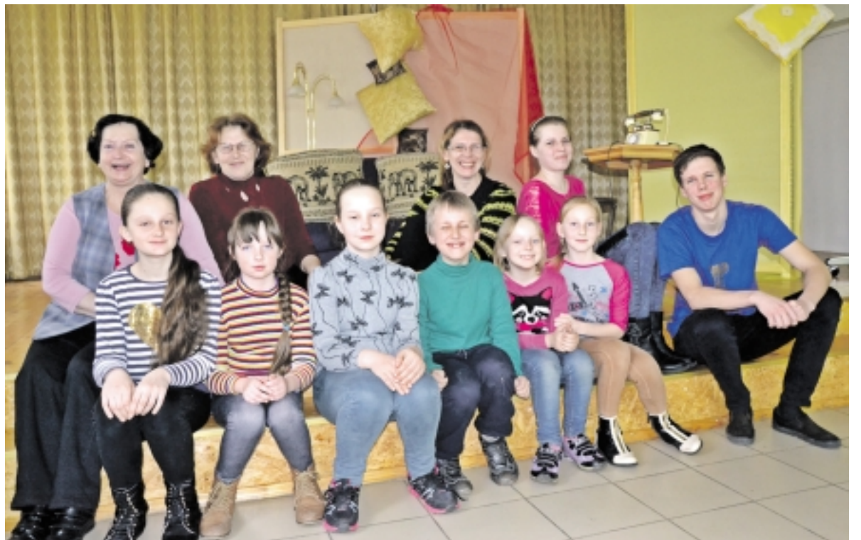
Naujajame Rusnės folkloro ansamblyje „Sklada“ dainuoja trys rusniškių kartos.

Pagrindinis kolektyvo vadovės tikslas ir narių noras – dainuoti Mažosios Lietuvos dainas, todėl jų ieškos ne tik literatūroje, bet ir per dainuos dainas, šiuo metu esančias centro archyve, ekspedicijų metu surinktas iš senųjų salos gyventojų.