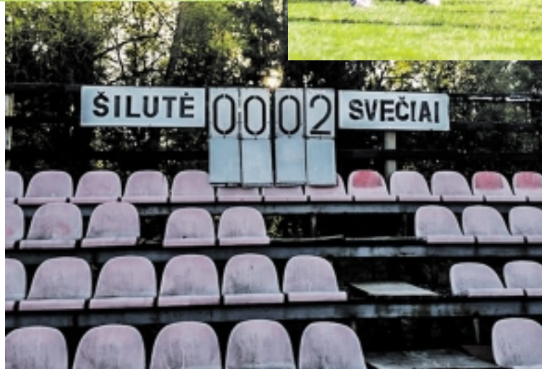
Liūdnas rezultatas, liūdnos, vienišos ir labai purvinos stadiono kėdutės.