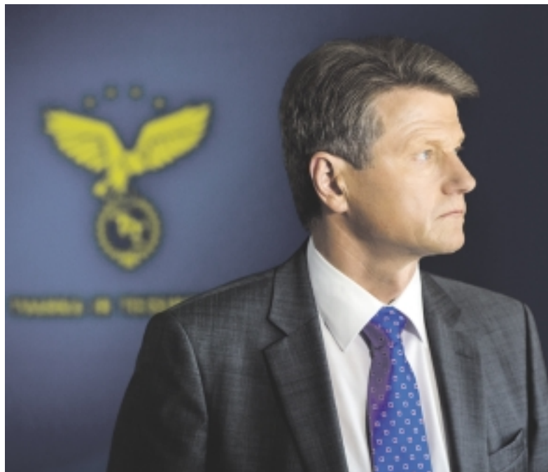
„Negaliu Jūsų klaidinti kviesdamas ateiti gegužės 11 dieną į Prezidento rinkimus, kurie nebus nei laisvi, nei demokratiški“, - pabrėžė partijos Tvarka ir teisingumas pirmininkas.

Pasak jo, šiandien galima daryti prielaidą, kad tokiu bū-