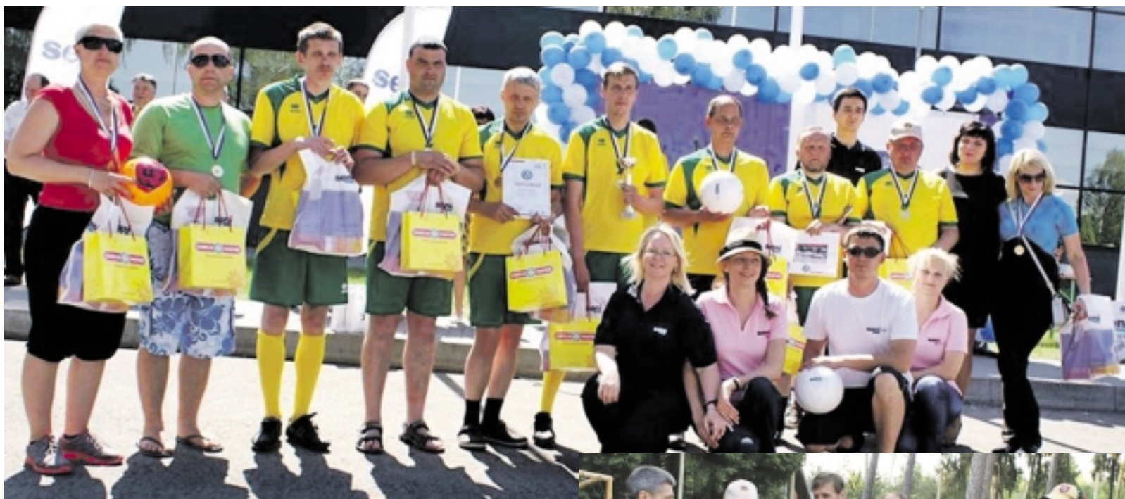
Šilutės komanda drauge su organizatoriais.

Tarptautinė žmonių su negalia mini futbolo lyga „Seni Cup 2014“ šiemet startuoja jau 8-ąją kartą. Šiais metais Prienų miesto stadione prasidėjęs turnyras sulaukė 12 komandų susidomėjimo. Dalyvaujančios komandos tarpusavyje kovojo dėl galimybės atstovauti Lietuvai turnyro finale Lenkijoje. Turnyre svečių teisėmis taip pat pasirodė ir komandos iš Latvijos bei Baltarusijos.