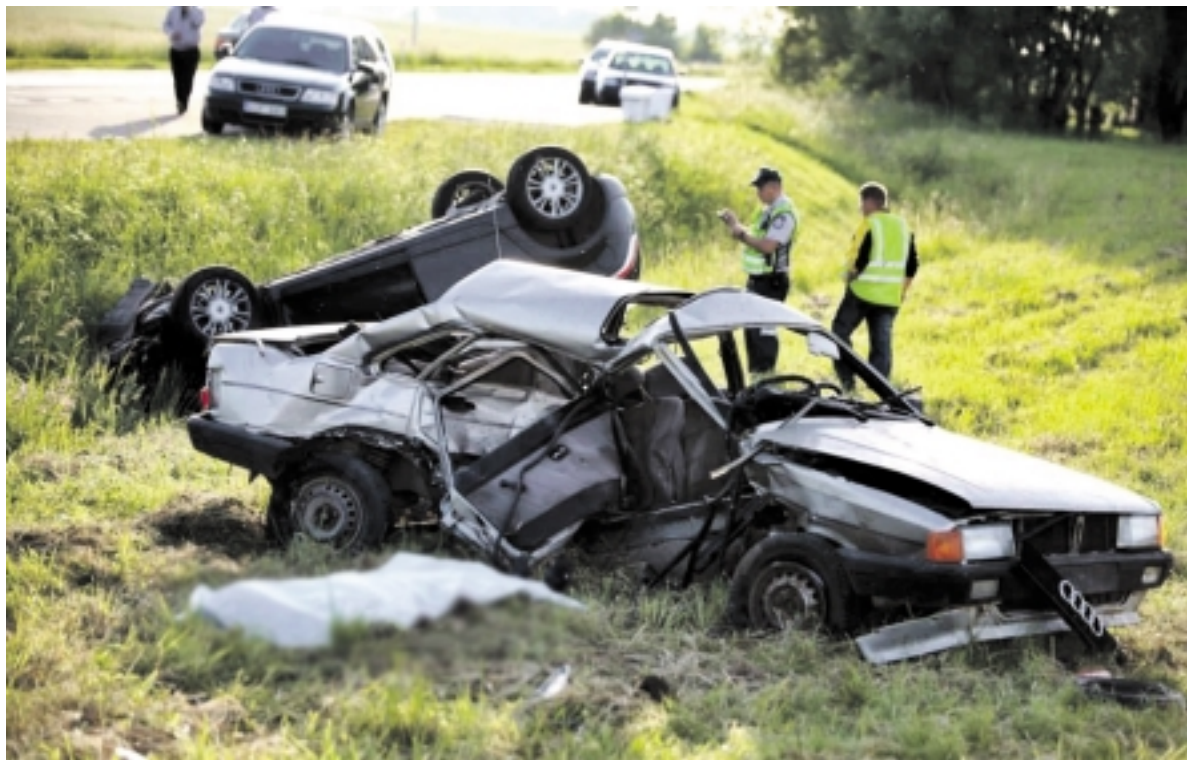
Susidūrus dviem automobiliams „Audi 80“ vairuotojas žuvo vietoje.

Policijos departamentas pranešė, kad praėjusį penktadienį, birželio 6 d., 19 val. 20 min., Šilutės rajone, kelio Klaipėda-Šilutė-Jurbarkas-Kaunas 68-ame kilometre, automobilis „Audi 80“, vairuojamas 26-erių metų vyriškio, išvažiuodamas iš šalutinio, nepraleido ir susidūrė su pagrindiniu keliu važiuoju automobiliu „Lancia Delta“, vairuojamu Vokietijos piliečio (gimusio 1974 m.). Eismo įvykio metu žuvo automobilio „Audi 80“ vairuotojas.