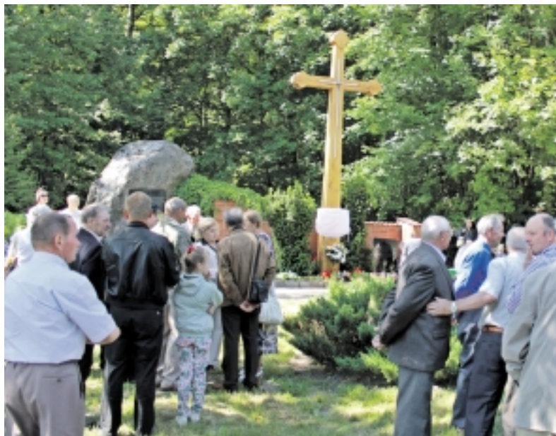
Kryžius, skirtas vilko vaikų atminimui, atidengimo Mikytuose akimirka.

Mikytuose, šalia kelių sankryžos, atnaujintas kryžius, skirtas taip vadinamų vilko vaikų atminimui. Čia įvyko didelės išskilmės, dalyvavo daugybė žmonių iš visos Lietuvos, 37 asmenys atvyko iš Vokietijos.