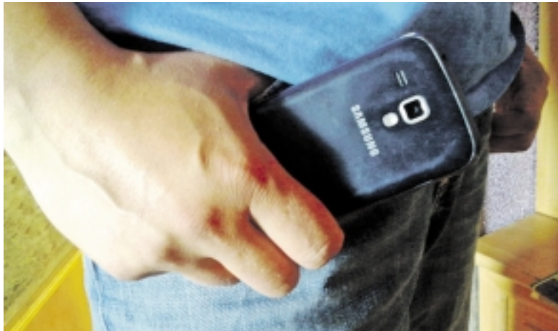
Teismas šį kartą nepatikėjo, jog kaltinamasis gailisi, ir šios aplinkybės nelaike atsakomybę lengvinančia aplinkybe.

Birželio 2-ąją teismas vėl sprendė, kokį „užmokestį“ paskirti kaltinamajam už naują įvykdytą nusikaltimą. Ikitrūkinio tyrimo metu buvo nustatyta, kad R. L. šių metų