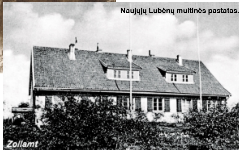
Naujųjų Lubėnų muitinės pastatas.

Viešvilės apygardos teisme dėl reikalingų dokumentų, bet, deja, nesėkmingai. Pokalbio metu staiga garsiai nuskambėjo „Plup“. Gerbiamas ūkininkas pajuto per pilvą ir kojas bėgantį šiltą spiritą. Pareigūnas, taip pat išgirdęs šį keistą garsą, paklausė nustebęs: „Kas čia buvo?“. „Taip, aš taip pat išgirdau kažką“, - atsakęs žmogelis, steng-