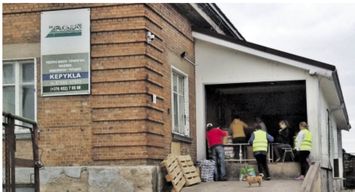
Pirmą kartą maisto daaviniai Pagėgiuose buvo dalinami jau ne buvusiamė trąšų sandėlyje, o kėpyklos patalpose, kur kvėpia šviežiomis bandelėmis.

Tris dienas Pagėgių mieste ir seniūnijose buvo nemokamai dalinami maisto produktų daaviniai. Iš viso Pagėgių savivaldybėje juos gavo 2 236 asmenys - beveik kas ketvirtas šio krašto gyventojas. Tai yra labai daug – Šilutės rajone maisto daavinius gavo tik kas vienuoliktas gyventojas.