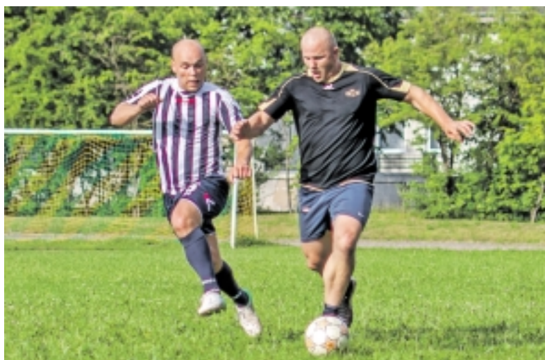
Akimirka iš rungtynių tarp „Naujas parkas“-„Mėgėjai“.

Šilutės rajono suaugusiųjų futbolo pirmenybės įgavo pagreitį, po kurio, pasibaigus I rato rungtynėms, turnyrinėje rezultatų lentelės pirmoje vietoje įsitaisė „Naujo parko“ komanda.