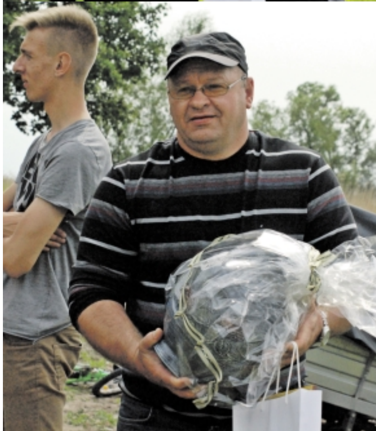
Išrinktos ir gražiausios Kintų seniūnijos šeimos.