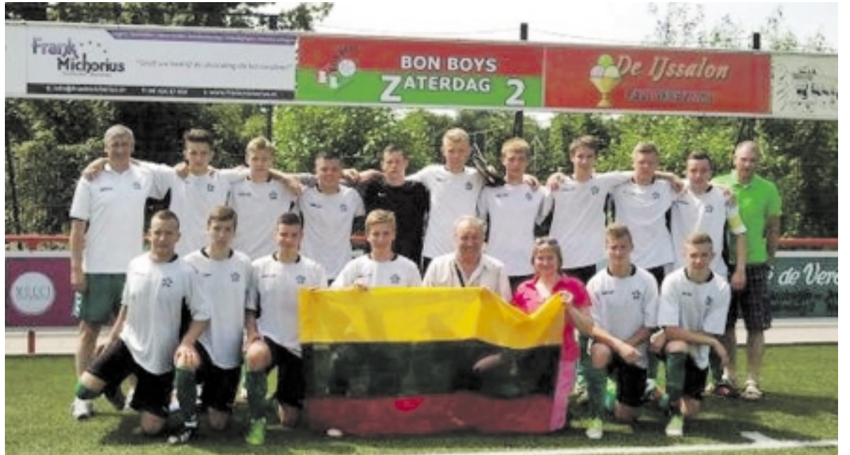
Šilutiškių komanda stadione.