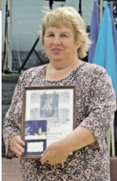
Apdovanoti gražiausiai savo aplinkas tvarkantys šeiminkai.