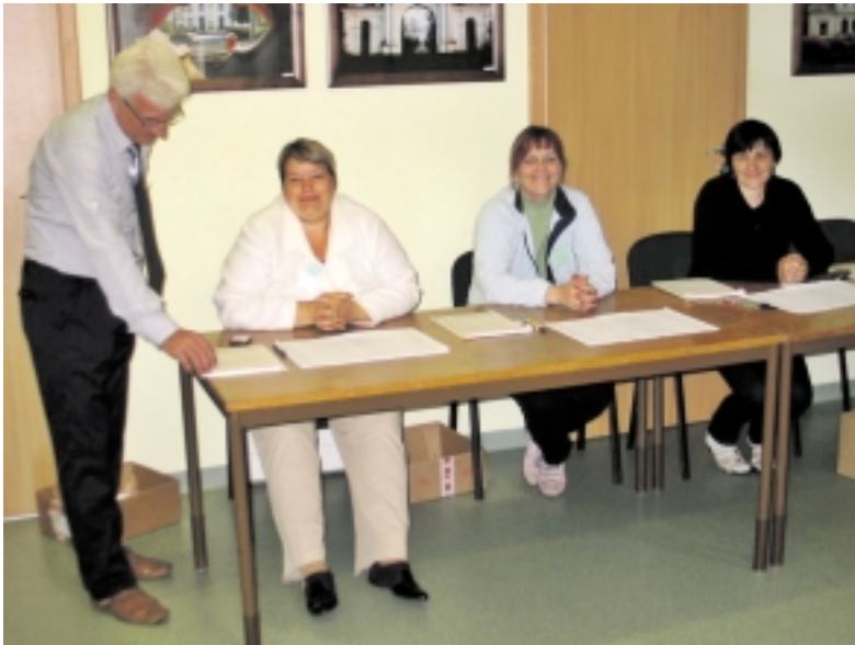
Švėkšnos, kaip ir dauguma Šilutės bei visos Lietuvos rinkimų komisijos narių, darbo šį kartą turėjo labai nedaug.

Šilutės rajono gyventojai, suskirstyti į trisdešimt aštuonias apylinkes, taip pat nebuvo labai aktyvūs, nors kiek ir viršijo šalies skaičius. Iš viso rajone registruoti 38 889 rinkimų teisę turintys asmenys. Referendume dalyvavo ir nuomonę pareiškė 5 969, arba 15,35 % rinkėjų. Negaliojančių biuletenių buvo pripažinta 2,98 %, arba 178 rinkėjų balsai.