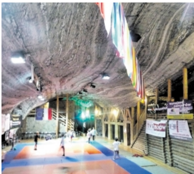
Kasyklos, 176 m po žeme - vieta, kurioje vyko dziudo turnyras.

Birželio 21–22 dienomis Bochinos mieste (Lenkija), 176 metrų gylyje po žeme vyko didelis tarptautinis dziudo turnyras, kuriame savo jėgas bandė Šilutės dziudo klubą atstovaujantys sportininkai.