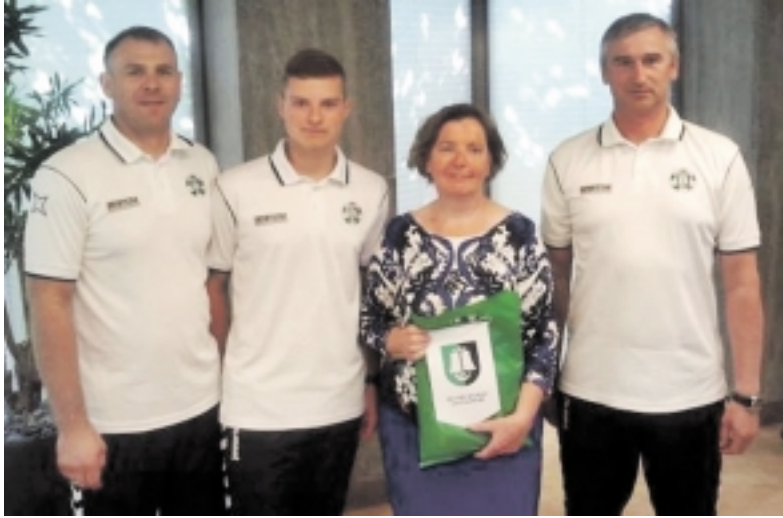
Šilutės komandos treneris (dešinėje) ir kapitonas (antras iš kairės) drauge su Olandijos savivaldybės atstove oficialiame priėmime.