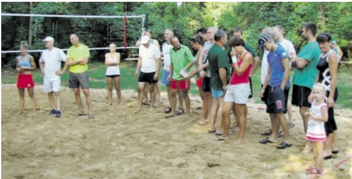
Naujojoje tinklinio aikštelėje net 4 valandas žaidė 7 komandos.

Liepos 30 dieną vyko Šilutės miškų urėdijos surengta poilsio vietės atidarymo šventė vietinių vadinamame „Beždžionių plažė“. Nuo šiol tai bus dar viena laisvalaikio praleidimo vieta Šilutėje. Tiesa, dar ne visi tvarkymo darbai užbaigti, tačiau gera pradžia - pusė darbo.