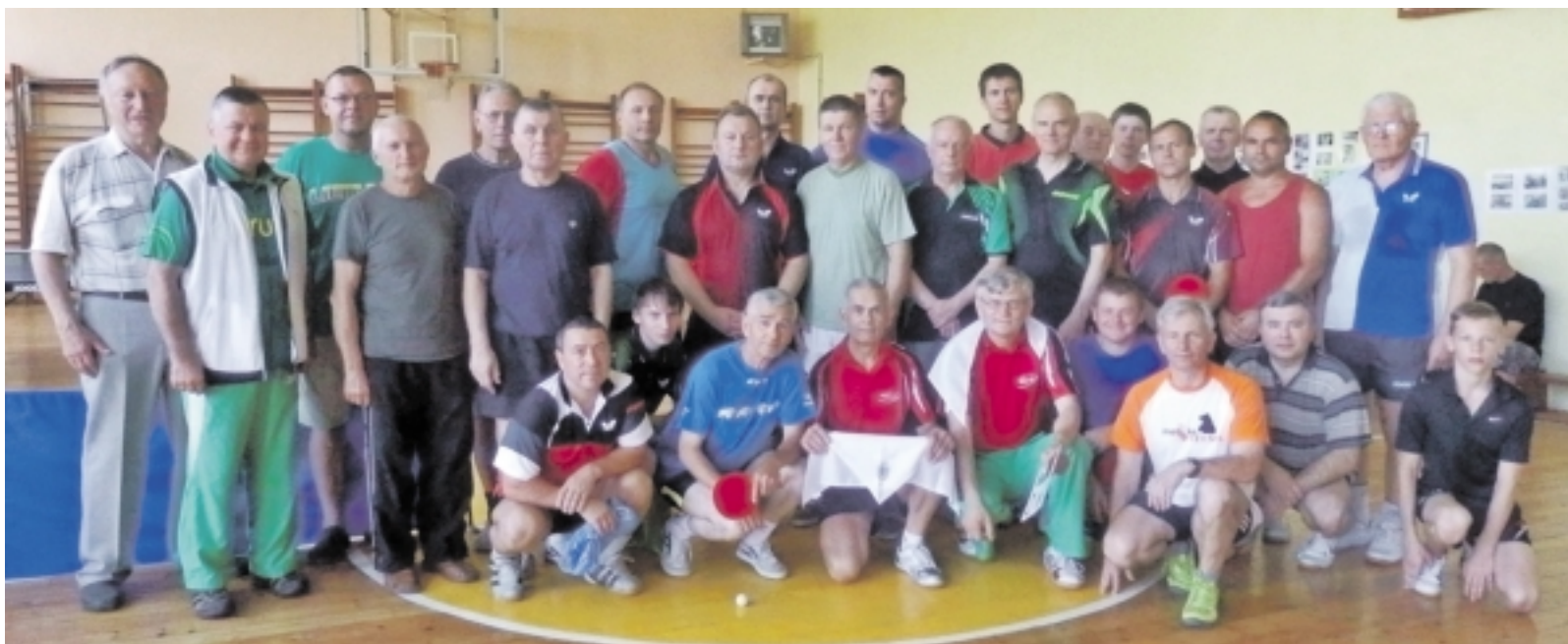
Turnyro (24 žaidėjai) dalyviai ir organizatoriai.