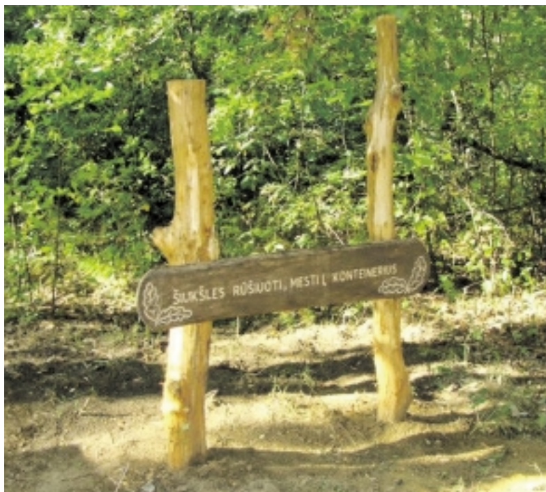
Sutvarkytoje poilsio vietoje iškirsti krūmynai, įrengtos stovyklavietės, pastatyti atliekų rūšiavimo konteineriai.