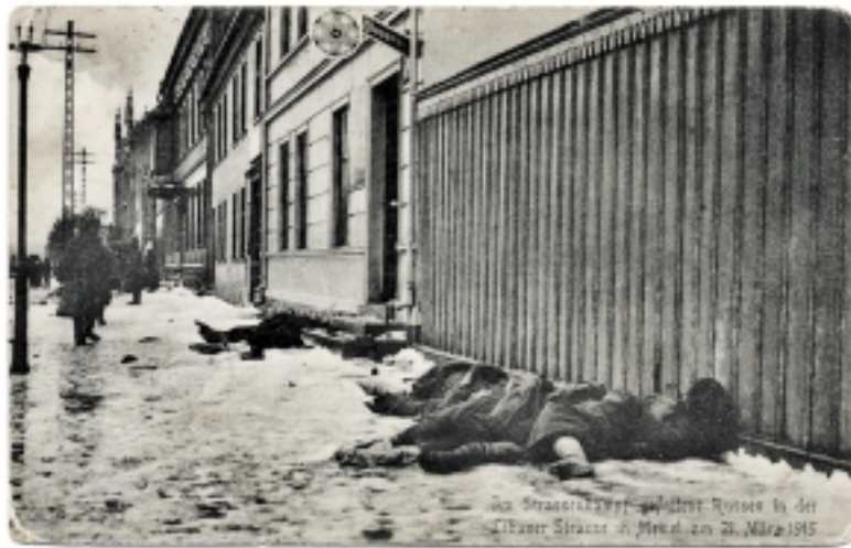
Gatvės kautynių metu žuvę žmonės (rusų kareiviai). Klaipėda 1915 m. kovo 21 d.

Pagal Šlifeno planą, kurį parengė generalinio štabo viršininkas, generolas feldmaršalas Alfredas fon Šlifenas (Alfred von Schlieffen), Vokietija turėjo kariauti dviem frontais – su Prancūzija iš vakarų ir Rusija iš rytų pusės. Kilus karui Vokietija pirmiausia turėjo didžiąją dalį savo pajėgų siųsti kovai su Prancūzija, taip išnaudodama laiką, per kurį Rusija vykdė mobilizaciją. Rytiniame fronte Vokietija ketino palengva atsitraukinėti tol, kol bus pasiekta Vyslos linija ir vėliau, dėl gerai išplėto geležinkelio tinklo, sutelkti visas savo pajėgas iš vakarų į rytus, kur jau turėtų būti sutriaukinta Rusija.