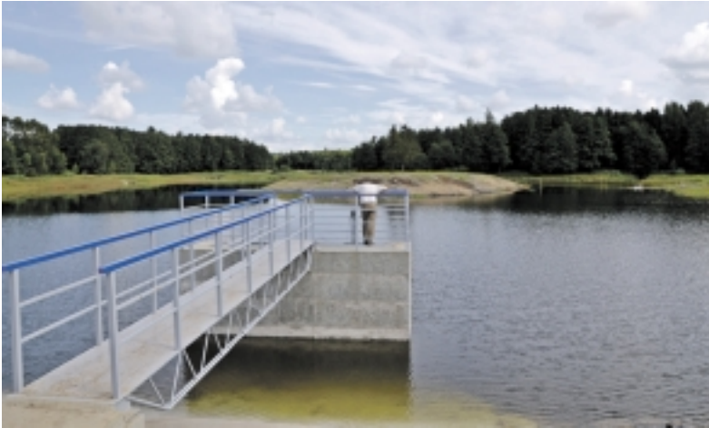
Degučių tvenkinys vis gražėja. Čia jau tyvuliuoja vanduo.

Rugpjūčio 1 dieną prie Degučių tvenkinio vyko Šilutės r. savivaldybės Teritorijų ir kaimo reikalų komiteto išvažiuojamasis posėdis, kurio metu susitarta su besidarbuojančiais avarijos vietoje įmonės atstovais, aptarti padaryti darbai bei pasitarta dėl tolimesnių žingsnių. Visų siekis bendras – kuo greičiau sutvarkyti taip vietinių pamėgtą tvenkinį.