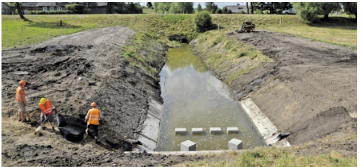
Anot dirbančios įmonės atstovų, tvenkinio tvarkymo darbus planuojama užbaigti rugsėjį.