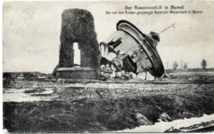
Rusų įsiveržimas į Klaipėdą. Atvirutėje - rusų kariuomenės sugriautas vandentiekio bokštas Klaipėdoje.

Neturėdama jėgos persvaros Vokietijos karinė vadovybė sutelkė dalinius prie Šilutės ir Klaipėdos. Taip stengtasi neleisti prieš-