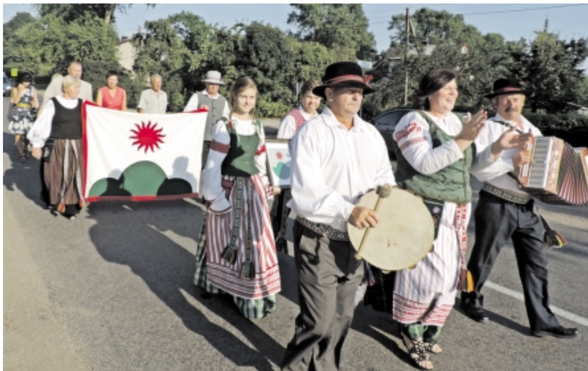
Į šventę atnešta naujoji Lumpėnų seniūnijos vėliava ir herbas.