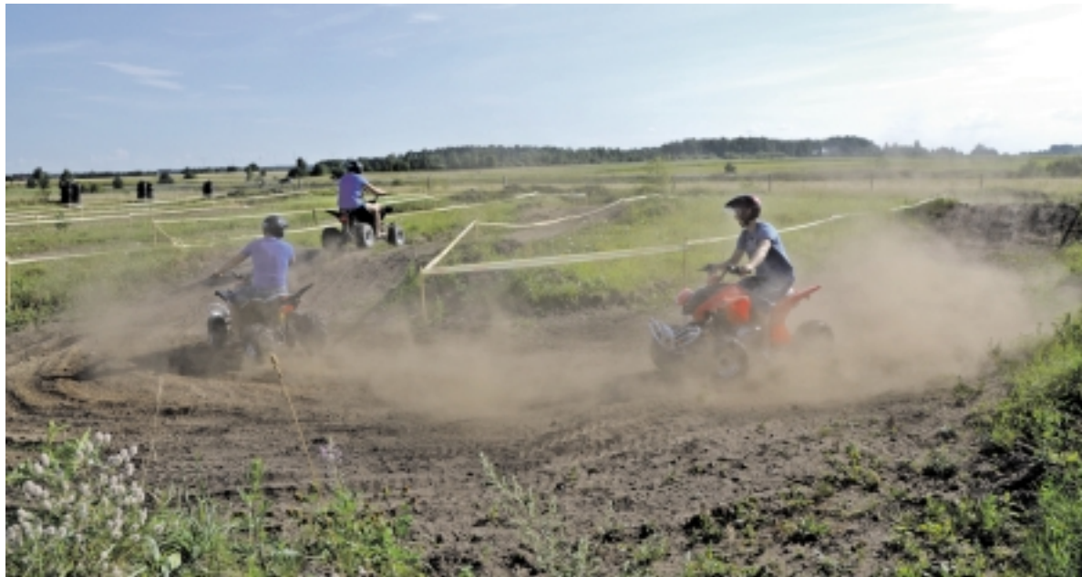
Niekuomet nesėdėjai už keturračio vairo? Ne bėda. Čia jūsų laukia malonūs treneriai, o trasoje puikiai jausitės ir ekstremalių pojūčių ištroškę, ir tiesiog linksmai laiką norintys praleisti lankytojai.