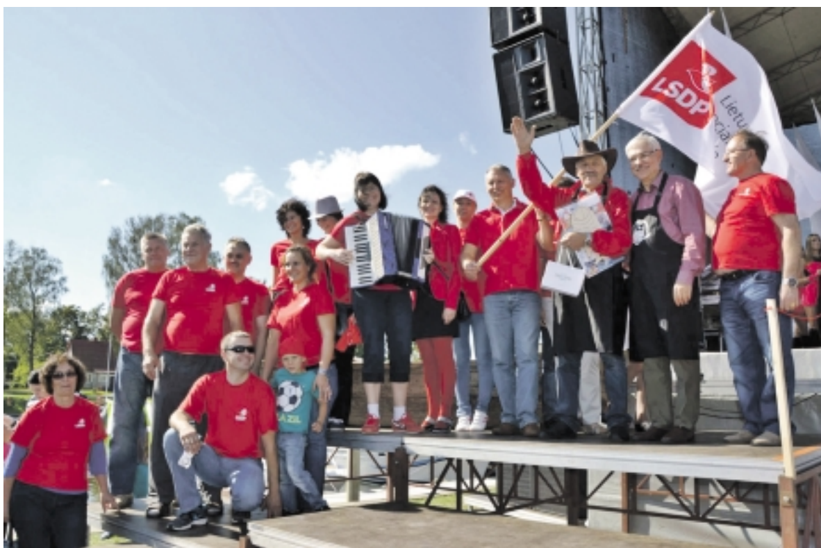
Skaniausios žuvinės II vietos nugalėtojai – Šilutės socialdemokratų partijos komanda.