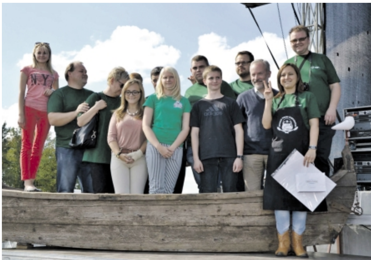
Skaniausios žuvies sriubos II vietos nugalėtojai – Tėvynės sąjungos Lietuvos krikščionių demokratų partijos komanda „Nauja jėga“.