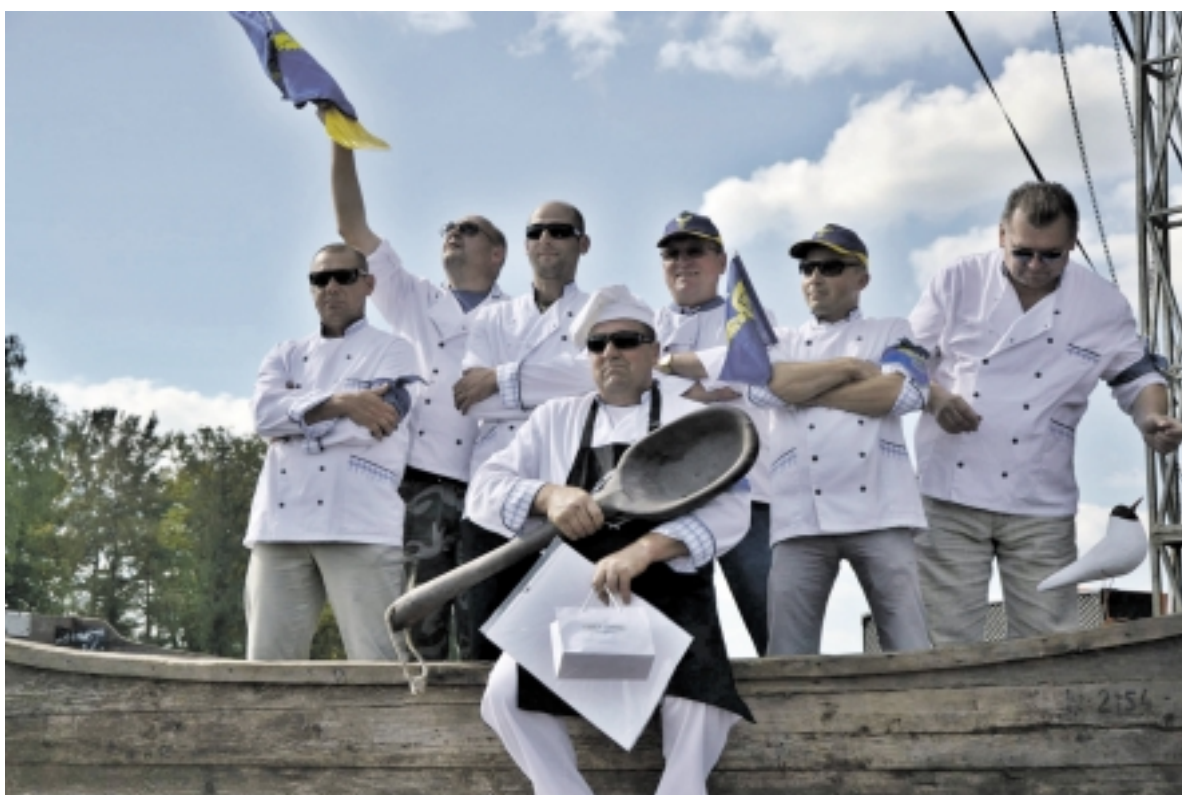
Skaniausios žuvinės I vietos nugalėtojai, partijos „Tvarka ir teisingumas“ komanda, „Šilutės ereliai“.

Politiko kaimynai pasakojo, kad prieš pamatę liepsnas jie girdėjo sprogimą. J. Purlys tuo metu buvo išvykęs. Pasibaigus Žuvinės virimo čempionatui jis į savo namo kiemą buvo parsivežęs dalį šventėje naudotų daiktų: katilus, įrankius, malkas. Manoma, kad automobilyje, pradėjus degti kuriam nors nuodėguliui, galėjo sprogti šalia malkų buvusi iš čempionato parsivežta degaus skysčio talpa.