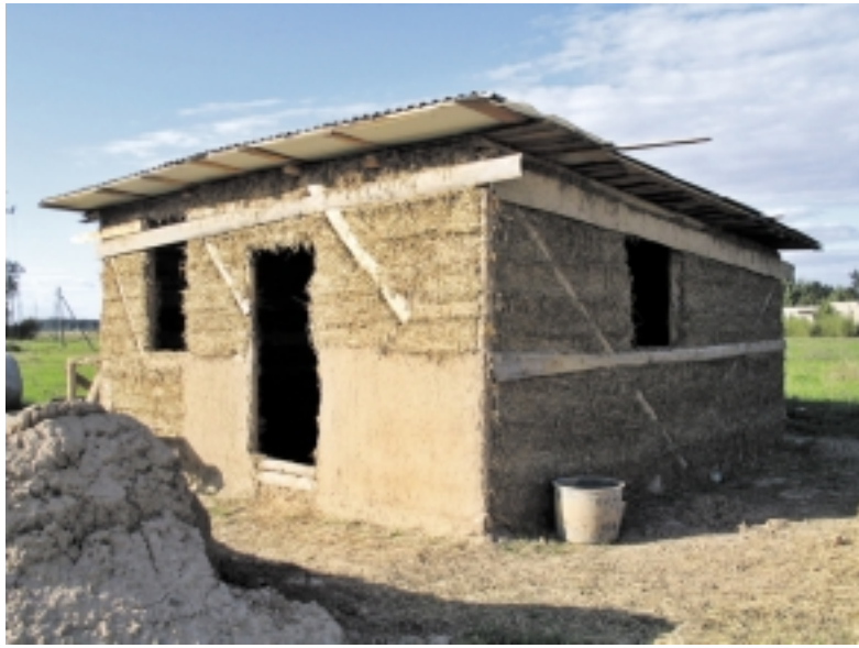
Pirmas molinis statinys Šilutės rajone pastatytas šiais laikais.