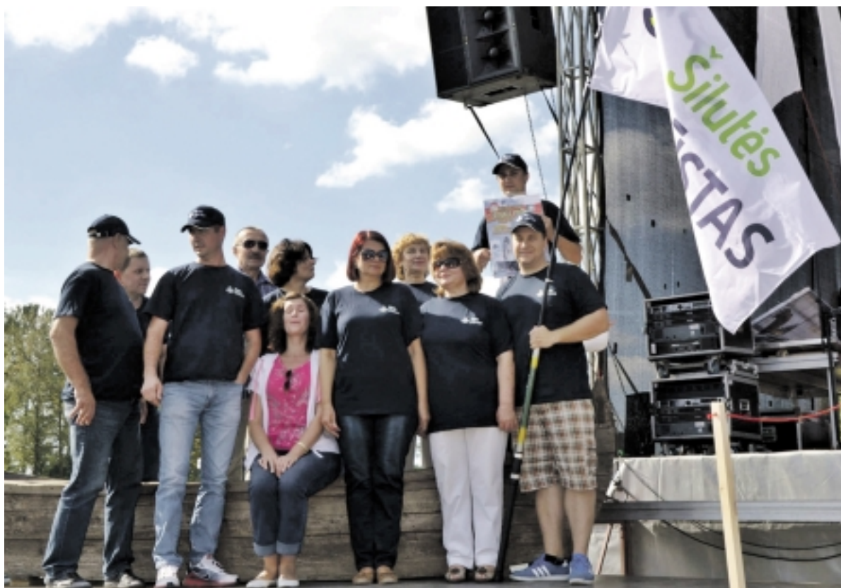
Skaniausios žuvies sriubos III vietos nugalėtojai – UAB „Šilutės būstas“ komanda.