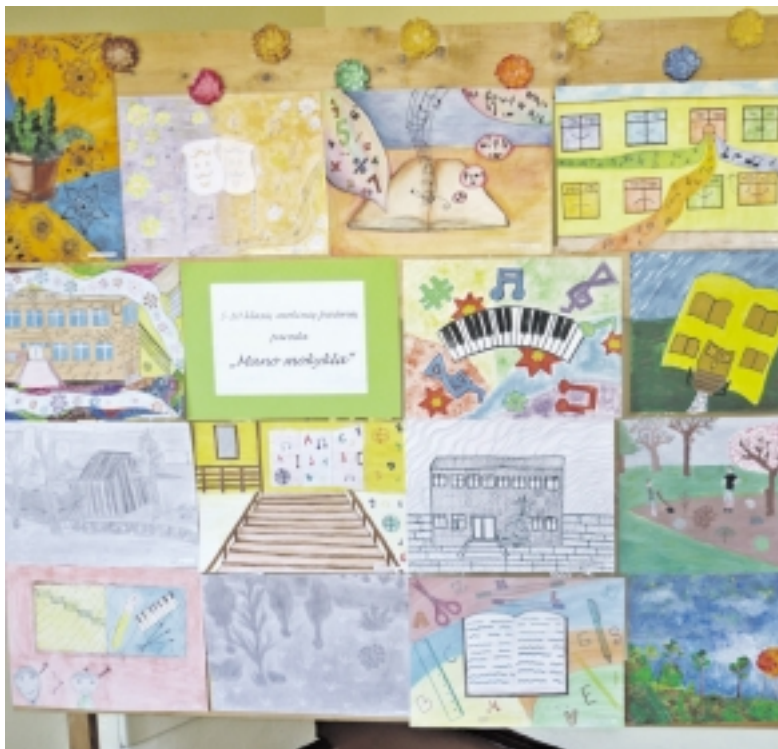
Tokių, kaip ši mokinių paroda „Mano mokyklėlė“, - pilni koridoriai. Vaikų darbai suteikia jaukumą ir gerą aurą visai mokyklai.