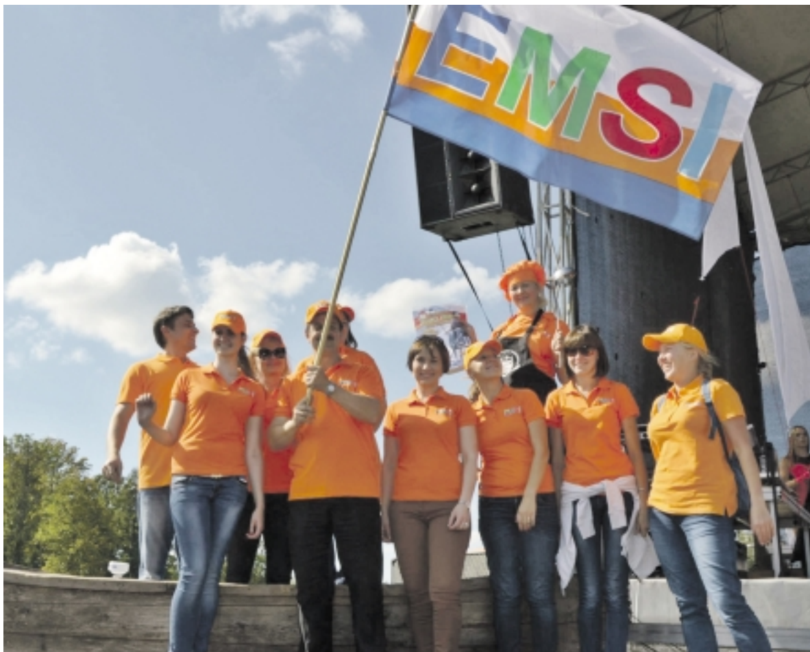
Skaniausios žuvinės III vieta atiteko degalinių tinklo „EMSI“ komandai iš Vilniaus.