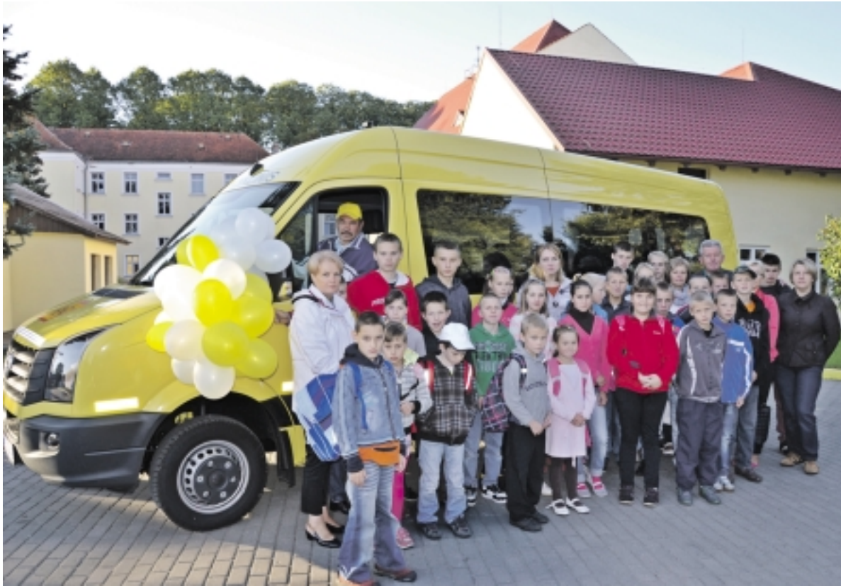
Rusnės specialiajai mokyklai vienintelei rajone skirtas naujutėlaitis geltonasis autobusiukas.

Naujieji mokslo metai Rusnės specialiajai mokyklai prasidėjo sėkmingai, todėl tai galėtų būti pranašiškas įvykis, kuris lemtų, jog mokyklos bendruomenė lydės visus ateinančius metus. Įdomu, kas gi tokio atsitiko? Ogi rugsėjo 1-ąją Vilniuje, prie Lietuvos Respublikos Seimo rūmų, vyko iškilminga naujutėlaičių autobusiukų įteikimo ceremonija. 19 vietų „Volkswagen Crafter“ markės geltonas autobusiukas atvažiavo ir į Rusnės specialiosios mokyklos kiemą.