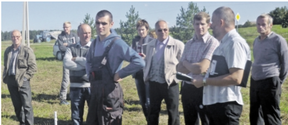
Ūkininkai atidžiai stebėjo viską – nuo plūgų suregulavimo iki arimo kokybės.

mosios registruotos arimo varžybos pasaulyje vyko beveik prieš 180