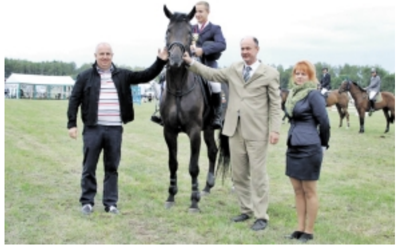
Geriausiai pasirodžiusiems raiteliams buvo įteikiami piniginiai ir rėmėjų prizai.

Turnyrą vainikavo konkūras Nemuno žirgyno taurei laimėti – jame