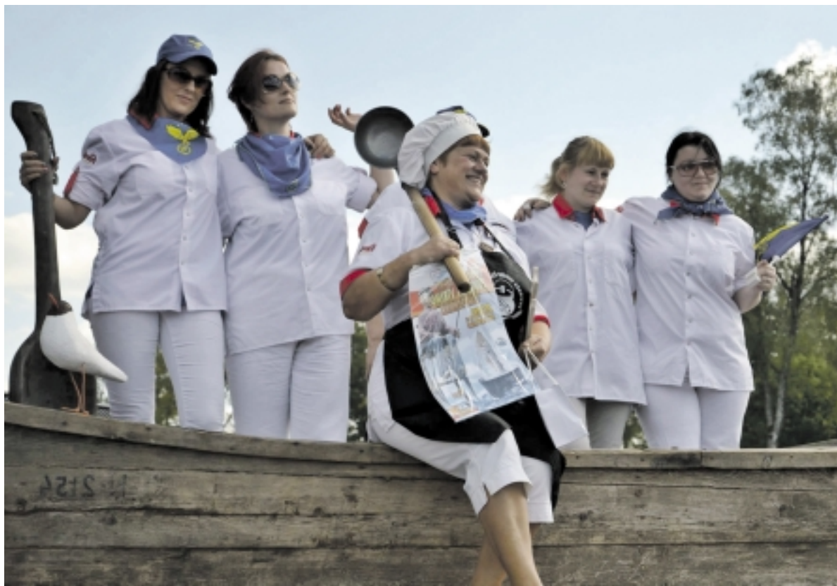
Absoliučia VI respublikinio žuviinės virimo čempionato nugalėtoja tapo partijos „Tvarka ir teisingumas“ moteriškoji komanda - „Erelių moterys“.