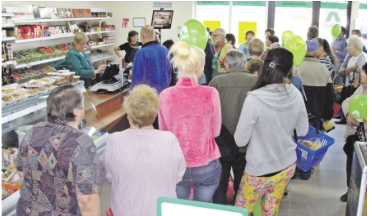
Parduotuvės atidarymo šventės metu susirinko gausus būrys ištikimų klientų.