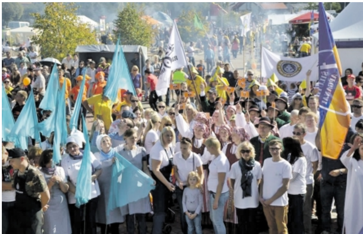
Šventės akimirka.