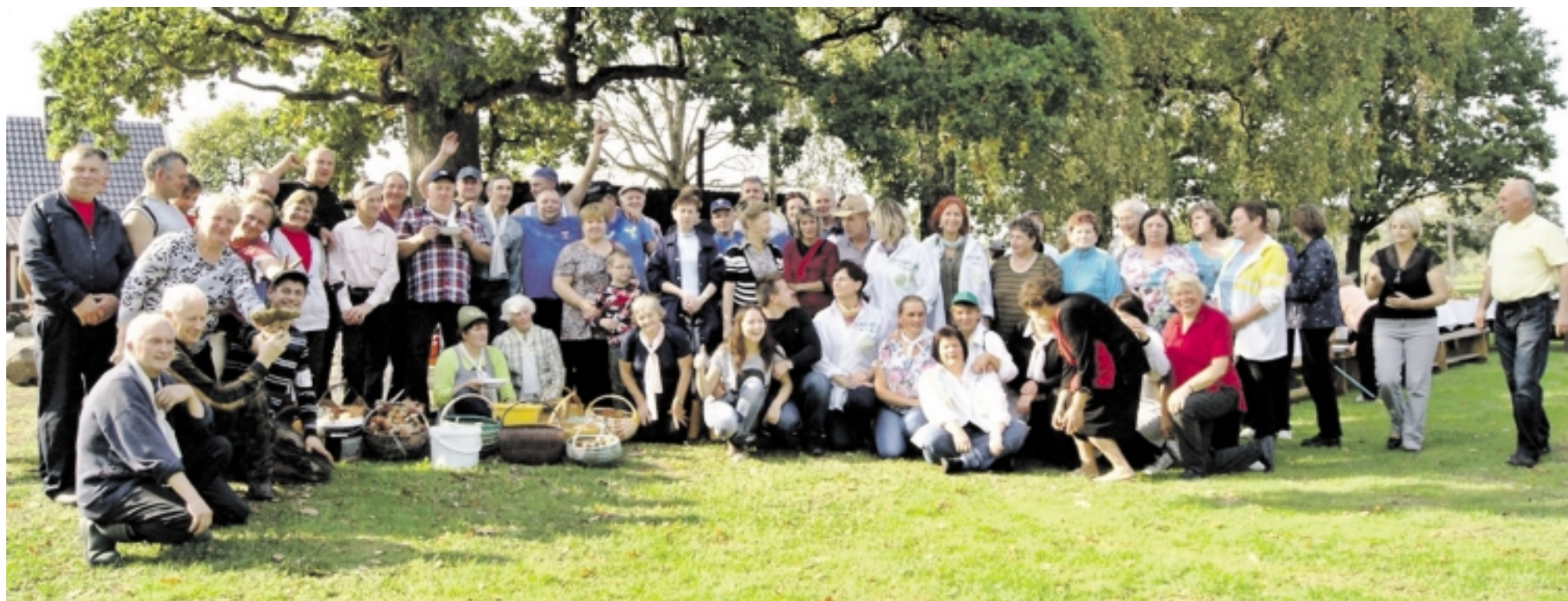
Dėl geriausiųjų vardo kovojo ne devynios komandos.