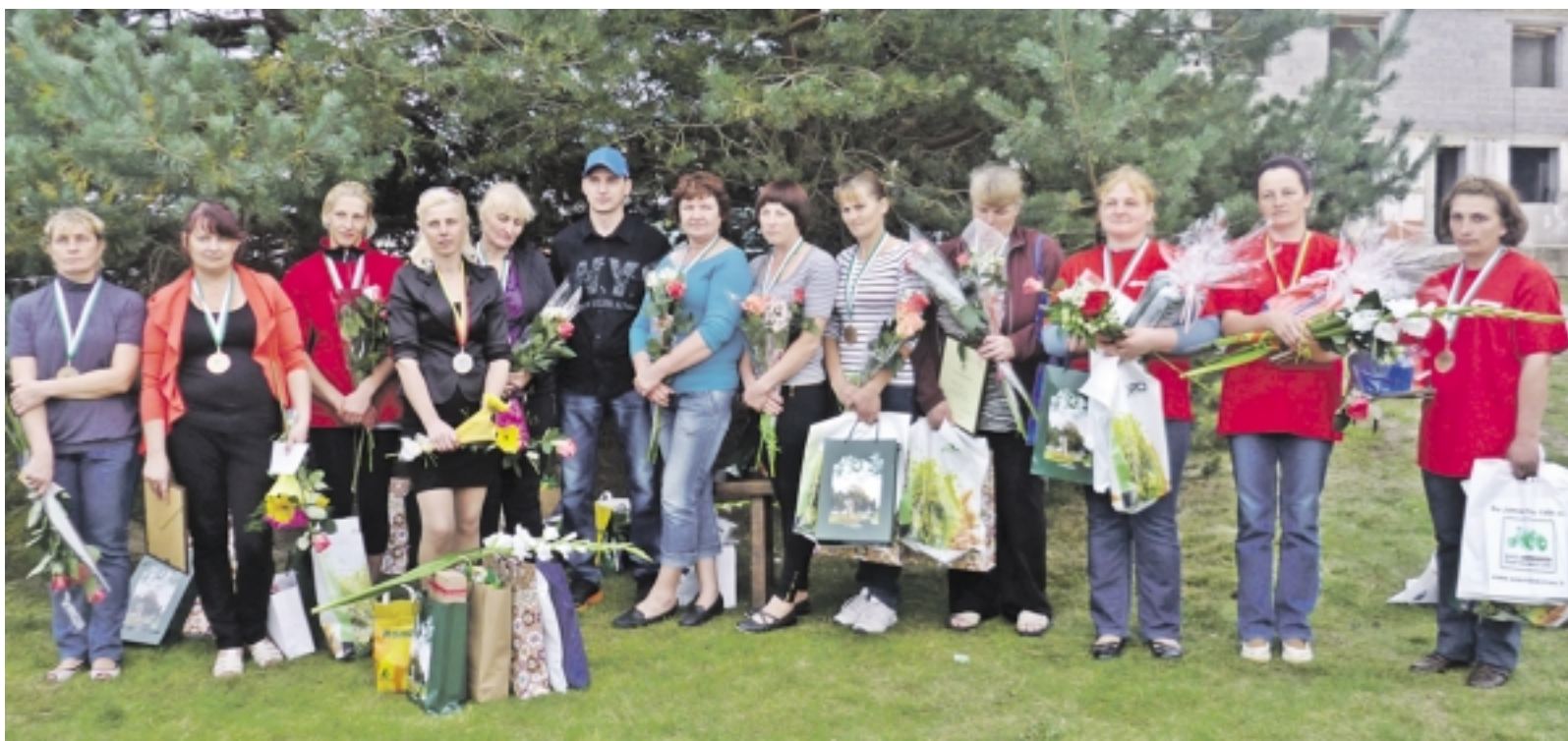
Visi melžėjai gavo gausybę renginio rėmėjų dovanų.