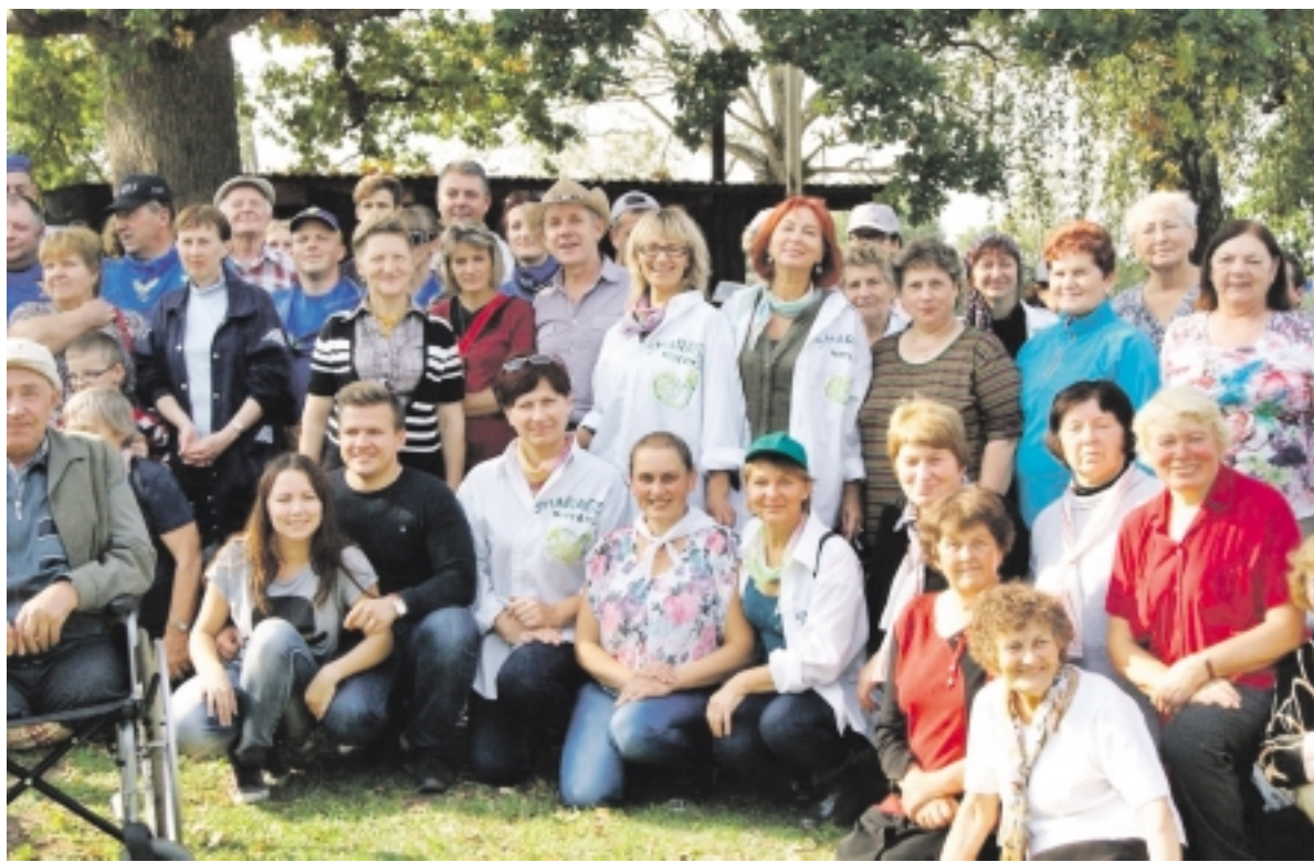
3-jojo grybavimo čempionato akimirkos.

Šiomet Švėkšnoje trečią kartą suorganizuotas grybavimo čempionatas. Renginio metu paaiškėjo, jog Švėkšnoje susirinko gausus būrys grybautojų iš įvairių rajono vietų. Dėl geriausiųjų grybautojų vardo varžėsi net devynios komandos.