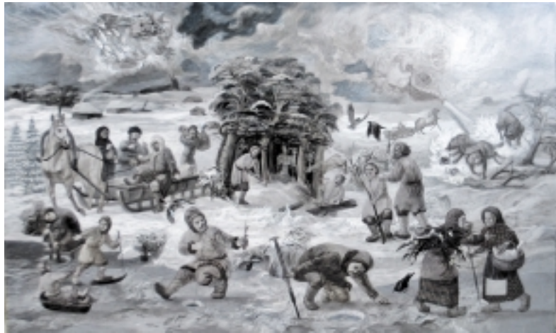
Š. Leonavičiaus iliustracija.

Kiti pranešėjai nagrinėjo ir aptarė XVIII a. Apšvietos laikotarpio rašytojus, kurie darė įtaką kaimyninių šalių kultūrai.