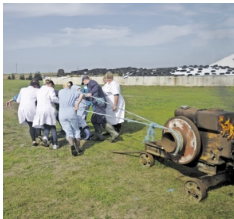
Taip melžėjos bandė užkurti vakuumą gaminantį amžinąjį variklį.

įdomu vertinti, nes viskas buvo atlikta labai gerai, net puikiai“.