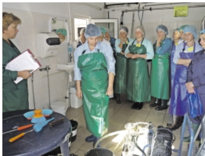
Melžėjos ruošiasi antrajai užduočiai – melžtuvo sanitariniam apdorojimui.