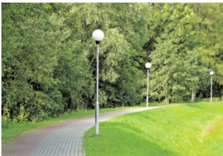
Šitaip sutvarkyta aplinka, Šilutės valdžios požiūriu, turėtų mažinti emigraciją.

Matyti, kad dabartinė rajono valdžia yra nusiteikusi šiuos pinigus padalinti trimis teritorijoms: Šilokarčemos kvartalui, Šyšos pakrantėms nuo ligoninės iki stadiono bei Lietuvininkų ir Tilžės gatvėms. Tai įrodo mero potvarkiu suformuotos darbo grupės, kurios