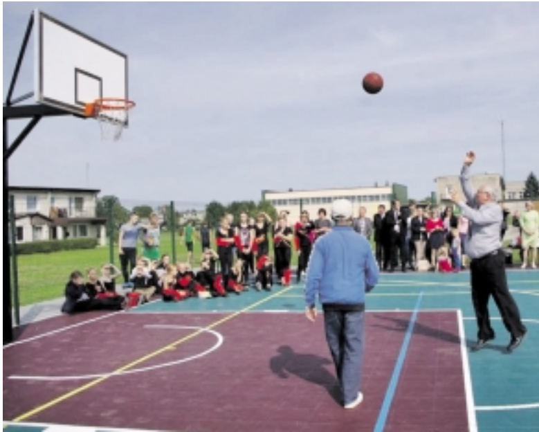
Šventėje dalyvavę svečiai turėjo galimybę išbandyti naująją krepšinio aikštelę ir pademonstruoti savo rankos taiklumą.