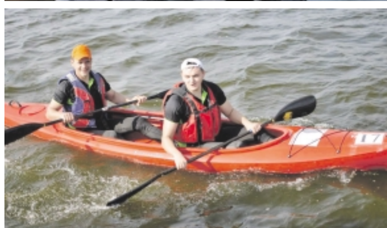
Maratono dalyviai turėjo įveikti 18 km trasą.

nės baidarių maratoną Nemuno deltos regioninio parko direkcija yra dėkinga maratono VI „Šilutės miškų urėdijai“, UAB „Klasmann-