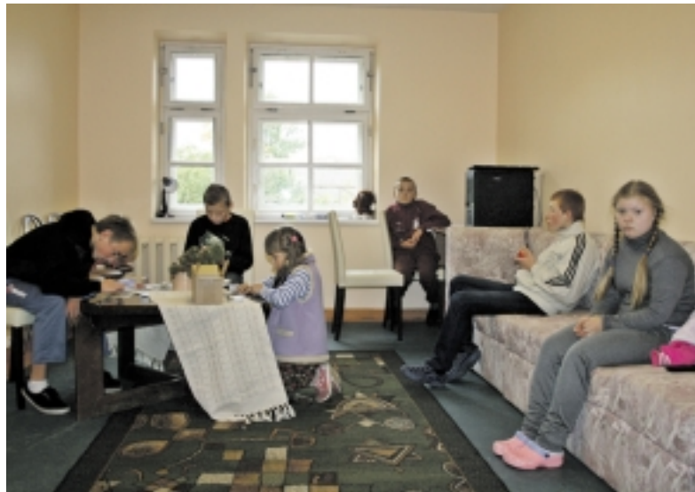
„Rusnės šeimyna“ iš Saugų vaikų globos namų naujuose namuose – Rusnės specialiosios mokyklos bendrabutyje – jaučiasi puikiai.