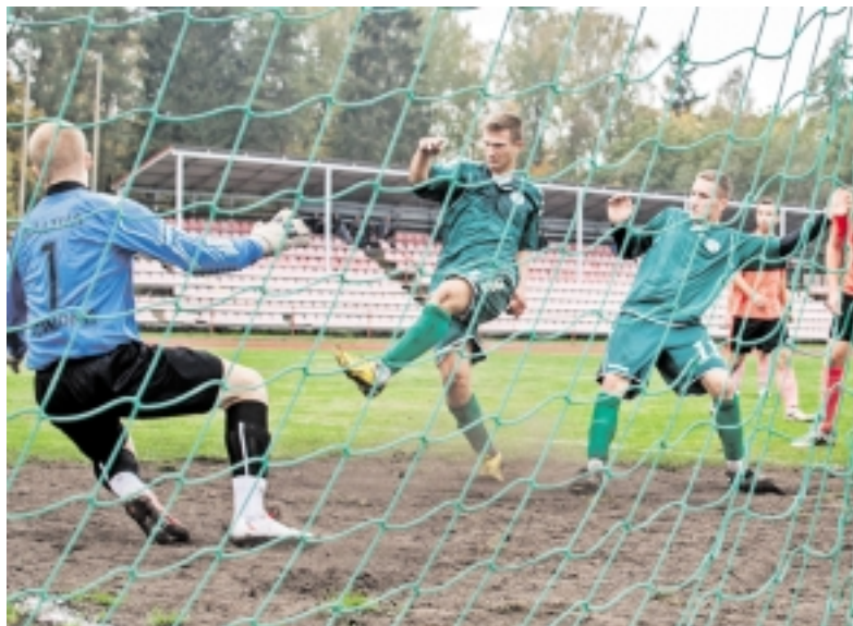
„Šilutė“ užgūlė „Baltijos“ vartus – laimėjo rezultatu 9:2.

Šeštadienį centriniame miesto stadione sužaistos paskutinės Lietuvos futbolo federacijos I lygos rungtynės tarp „Šilutės“ ir „Baltijos“ vienuolikių. Puikus sezono uždarymas – „Šilutė“ rezultatu 9:2 šiais metais užbaigė futbolo kovas.