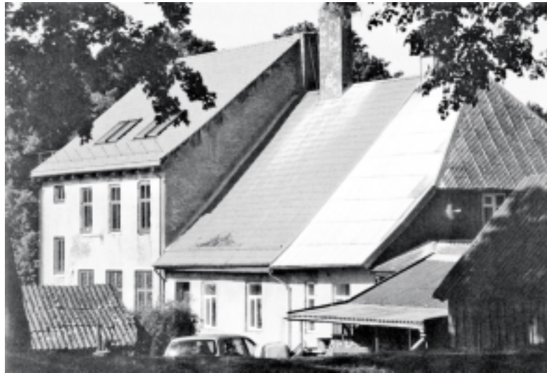
Buvusi Vilkyškių mokykla.

To laiko duomenys rodo, kad gyventojų raštingumas atskirose Rambyno apylinkių gyvenvietėse labai skyrėsi. Antai Bitėnuose - Užbičiuose beraščiai sudarė vos 5 procentus suaugusiųjų kaimo gyventojų skaičiaus, o Jogaudų kaime – net 45 procentus. Nors anuometė beraščių apskaita kartais galėjo būti ir ne visai patikima, tačiau bendros tendencijos rodo, kad padėtis atskiruose kaimuose skyrėsi. Gali būti, kad daugiau raštingų žmonių buvo ten, kur vietos mokyklos veikė nuo seno, kur rūpestingiau darbuososi mokyklose dirbę pedagogai. Galėjo būti ir savų tradicijų, madų, gyventojų nuostatų, kažkokių lokaliųjų aplinkybių. Pavyzdžiui, Bitėnų raštingumą veikiausiai skatino gretimas Ragainės miestas, įkurtą kaimiečiai vykdavo dažnai, ten lankydavo pamaldas bažnyčioje. Kai kur raštingumo siekį galėjo paskatinti vietos dvasininkai, administracijos darbuotojai, pavie-