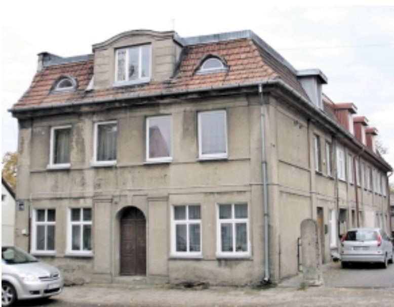
Naujoji statybininkų mokymo bazė bus M. Jankaus gatvėje.

1994 metais į Šilutę papramogauti po Vilniuje vykusios Dainų šventės buvo atvežta Austrijos delegacija, kurios sudėtyje buvo Zal-