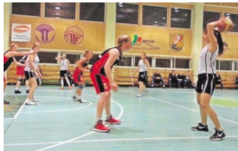
Šilutės „Pamario“ komanda pralaimėjo pirmąsias sezono rungtynes prieš Marijampolės komandą „Kolegija-Sūduvis“.