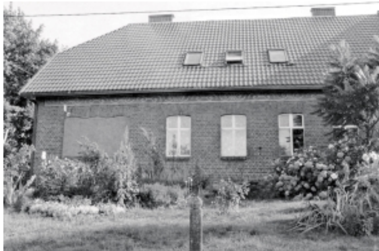
Buvusi Lumpėnų mokykla.

kai kur keitė patvaresni mūriniai pastatai. XIX a. pabaigoje sėkmingai vystantis Prūsijos ekonomikai, daugiau dėmesio pradėta skirti valstybės pakraščiams, mažoms gyvenvietėms ir kaimams. Tuometė valstybė ėmėsi finansuoti naujų administracinių pastatų, bažnyčių ir mokyklų statybą. Buvo parengti kaimo mokyklų kartotiniai projektai, atpiginę valdiškas statybas (pagal tą patį projektą būdavo pastatoma keletas ar keliolika vienodų ar panašių mokyklų skirtingose vietovėse). Nutarta, kad bus praktiškiau statyti patvaresnius mokyklų statinius, kad jų nereikėtų dažnai remontuoti. Tuomečiams pastatams mūryti leista naudoti geros kokybės raudonas plytas, brangesnes, bet patikimesnes. Buvo suformuota valdiškų statybų sistema, užsakomi projektai, parenkami statybų rangovai, tikrinama statinių kokybė ir pan. Krašto apskrityse (taip pat ir Ragainės apskrityje) veikė statybos inspekcijos ir kiti administraciniai padaliniai, ten kauptos žinios apie vykdomas statybas ir pan.