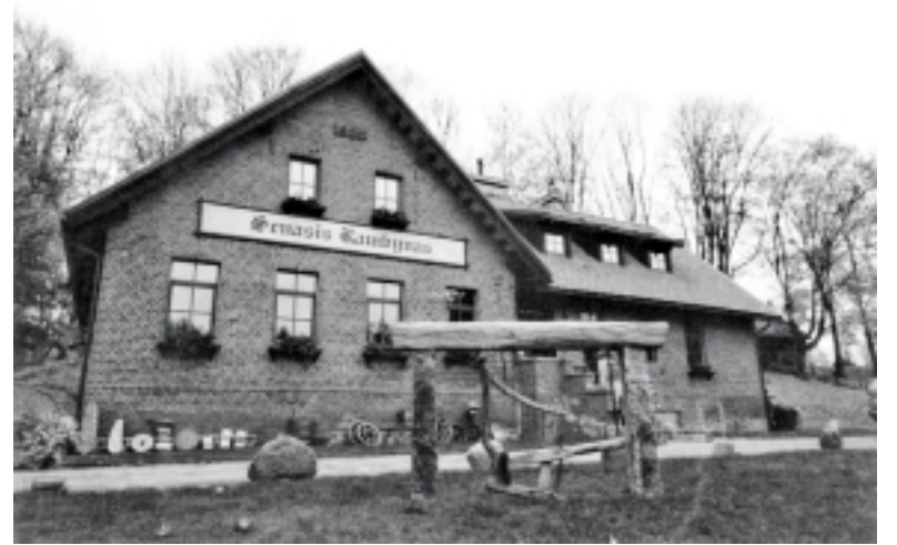
Bardėnų mokykla.

Praeityje paplitusius medinius ir molinius kaimo mokyklų trobesius tik XIX a. – XX a. pradžioje