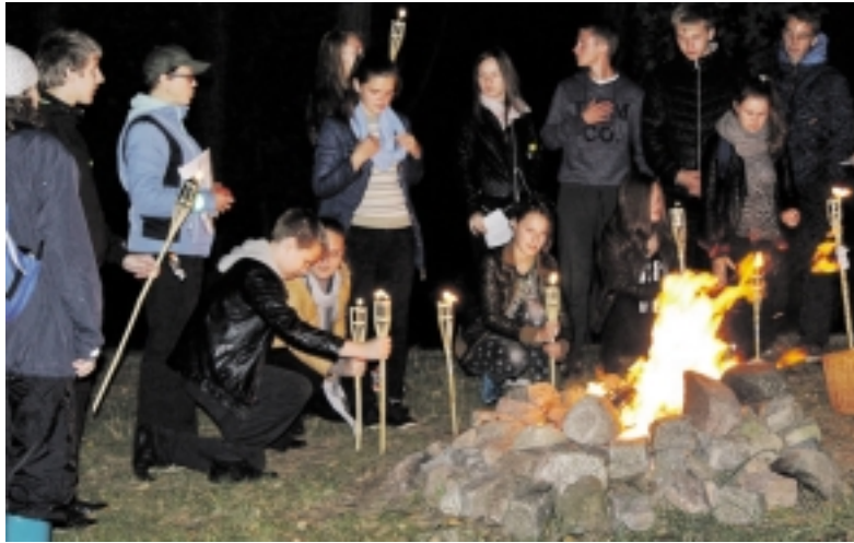
Baltų vienybės šventė ant Rambyno kalno.

1236 m. baltų gentys susivienijo ir Saulės mūšyje sumušė Kalavijuočių ordiną. Lietuvos ir Latvijos seimai Saulės mūšio dieną paskelbė Baltų vienybės diena. Mūšio išvakarėse ant piliakalnių buvo uždegtos ugnys, kurios kvietė vienytis baltų gentis. Ugnis ant tolimo kalno baltams tapo galimybe parodyti, kad esame. Ugnies uždegimas vienu metu nuo seno liudija žmonių, uždegusių ugnį, vienybę.