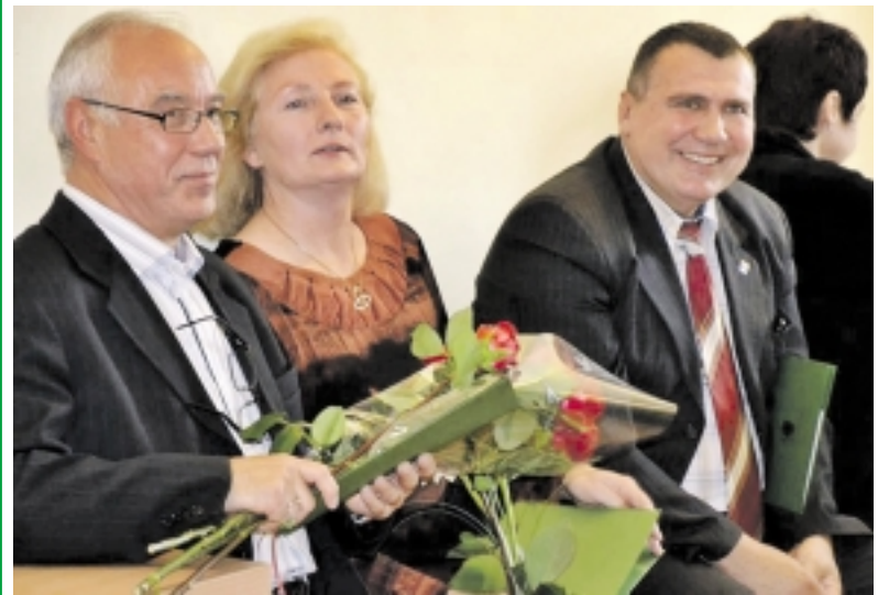
Vietos savivaldos dienos proga neliko nepastebėti besistengiantys dėl savų seniūnijų.

Nuo 2007 metų spalio 10-ąją Lietuvoje minima Vietos savivaldos diena. Šią šventę galima laikyti visų žmonių švente, nes visi gyvename tam tikroje savivaldoje. Ši proga penktadienį taip pat buvo minima ir Šilutės rajono savivaldybėje. Šiame paskviesti Šilutės rajono gimnazistai susipažinti su Savivaldybės darbu, o popiet vyko Savivaldybės darbuotojų bei iniciatyvių seniūnijose gyvenančių žmonių pagerbimo ceremonija.