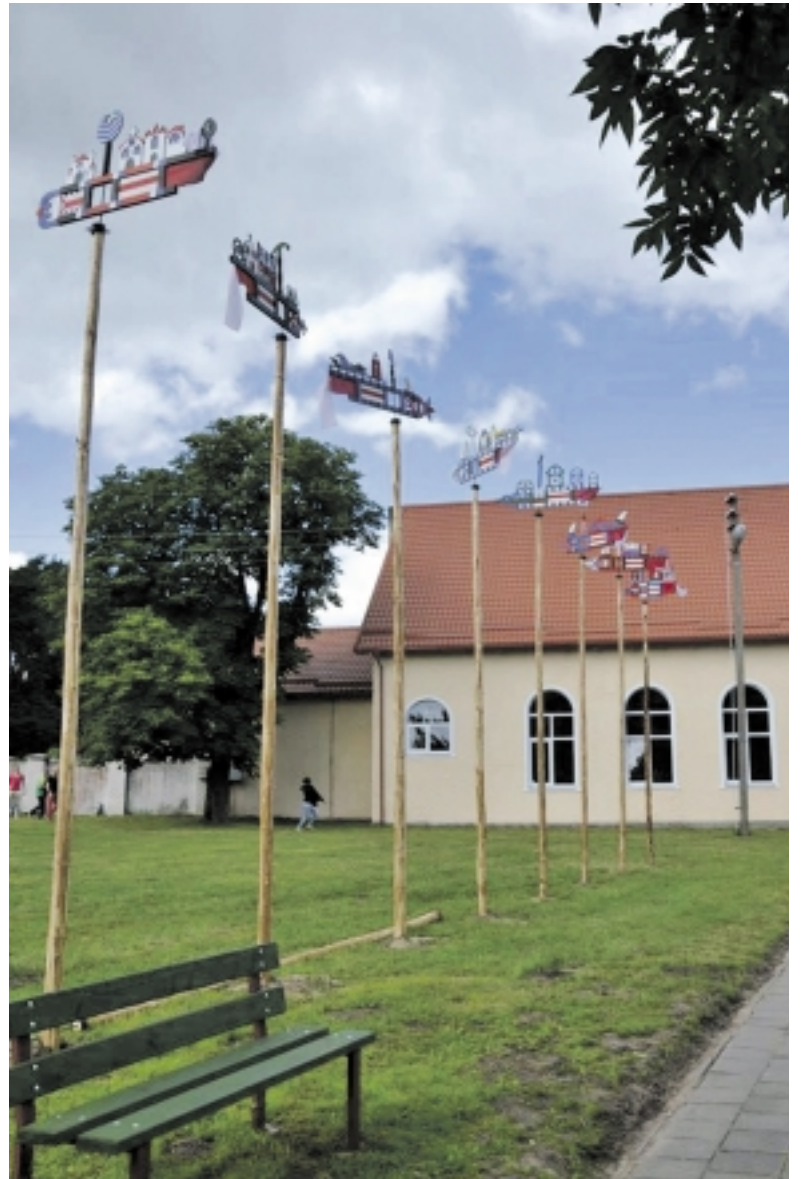
Už šio Kintų daugiafunkcio centro bus įrengta nauja erdvė kintiškiams ir miestelio svečiams.

Ruduo – derliaus nuėmimo metas. Kintiškiams šis ruduo atnešė taip pat gausų derlių. Dar šį rudenį Kintų miestelio centre, šalia daugiafunkcio centro, planuojama įrengti naują poilsio ir sveikatingumo kompleksą.