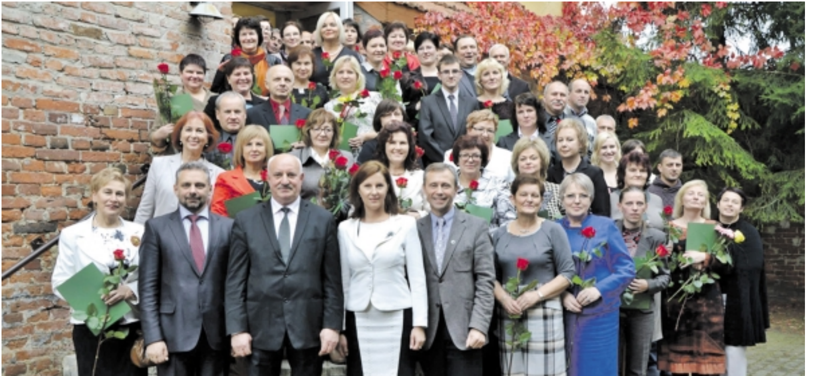
Gėlių žiedai ir padėkos žodžiai šiomet skambėjo seniūnijų iniciatyviausiesiems savivaldybės ir seniūnijų darbuotojams.