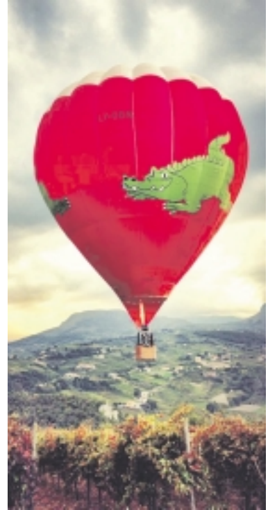
Balionas iš Šilutės gavo pravardę – firminį ženklą „Lacoste“.