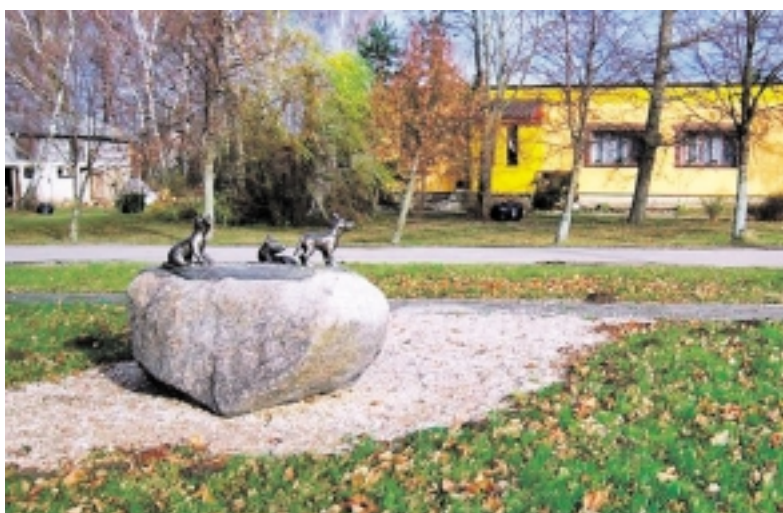
Vilkyčiai bendruomenių dėka puošiami, tvarkomi, kasmet tampa vis gražesni.