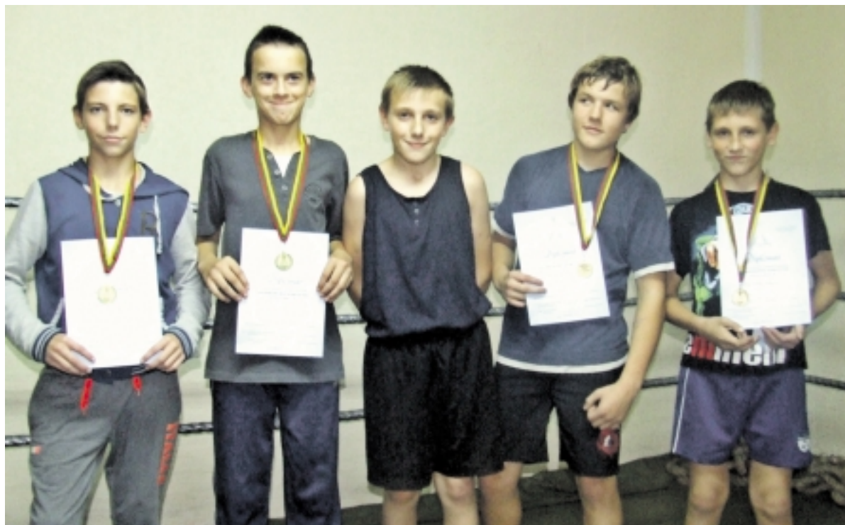
Jaunosios Šilutės bokso žvaigždutės.

Dubline (Airija) įsikūrusiame Smitfildo bokso klube organizuotas