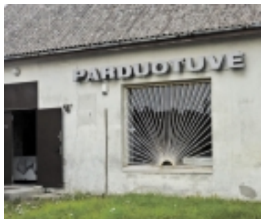
Ši parduotuvė Panemunėje jau daug metų nebeveikia – išlikusi tik sovietinių laikų reklama.