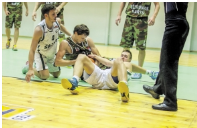
„Šilutė“ dėl pergalės ir kamuolių kovojo visais galimais būdais.

tavusi „Trakų“ komanda pirmoje susitikimo pusėje su „Šilute“ dviem taškais atsiliko (18:20). Antrajame kėliny šilutiškių pataikyti tolimi metimai leido išiveržti į priekį jau šešiais taškais (35:41). Po pertraukos viskas apvirto aukštyn – trakiškiai po „šalto dušo“ užsive-