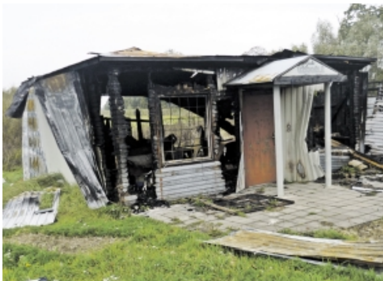
Čia neseniai dar buvo galima duonos nusipirkti...