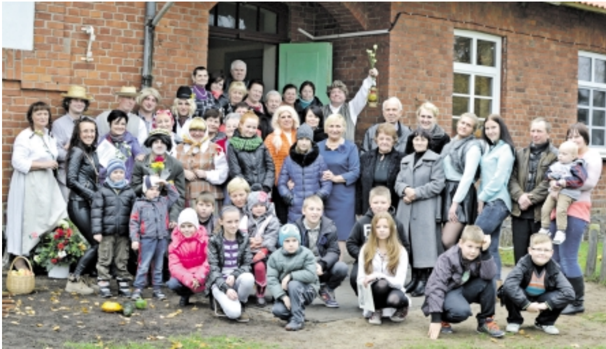
Žemaitkiemio bendruomenė – draugiška, aktyvi ir visada gerai nusiteikusi.