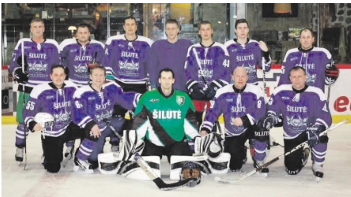
Šilutės ledo ritulininkai po puikios pergalės.

Iš komandų sąrašų „dingo“ tokių komandų kaip „Kirai“ ir „Skatas-tėveliai“ pavadinimai. Šios dvi komandos susijungė į bendrą junginį Klaipėdos HC „Klaipėda“ ir padalinę žaidėjus išstatė komandas į abi grupes. Gargždų „Ledžinga“, surinkusi savo „lekiantį“ jaunimą, išstatė komandą į Didžiosios taurės grupę ir suteikė jai „Ledžinga-2“ pavadinimą. Prie „Žemaitijos ledo“ čempionato prisijungė Klaipėdos „Baltijos“ ledo ritulininkai.