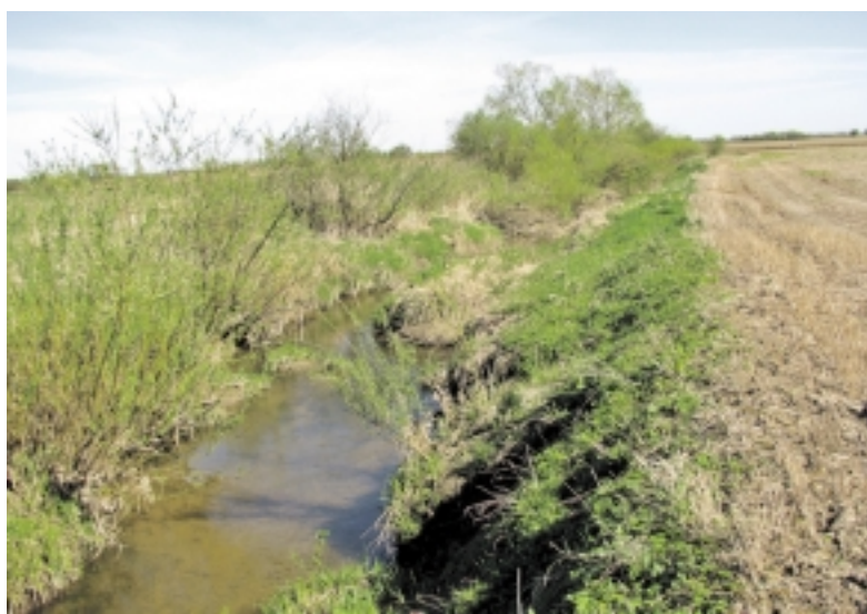
Šilutės rajone apie 80 proc. melioracijos griovių yra apleisti, neprižiūrimi.

„Taip pat norėčiau pasidžiaugti, kad Savivaldybė, kartu su melioracijos naudotojų asociacijomis, panaudodama ES struktūrinių fondų lėšas pagal Lietuvos Respublikos kaimo plėtros programos 2007–2013 metų priemonę „Žemės ir miškų ūkio veikla ir jos infrastruktūra“ veiklos sritį „Žemės ūkio vandentvarka“, įgyvendino septynis projektus, – sakė P. Budvytis. – Buvo atnaujintos sausinio siurblynės, sutvarkyti pylimai, išvalyti magistraliniai grioviai. Dabartiniu metu ir toliau vykdomas polderių sistemų tvarkymas pasinaudojant ES struktūrinėmis lėšomis. Yra pateikti penki polderių tvarkymo projektai.