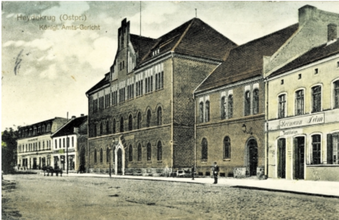
Šilutės teismo rūmai XIX a. pabaigoje.

Valstybės išdavimo, sukilimo, karaliaus didenybės įžeidimo, nužudymo, plėšikavimo, padegimo ir kt. sunkių nusikaltimų tardymą vedavo žemės teismas, o bylą nagrinėdavo ir sprendimą priimdavo vyriausias žemės teismas Įsrutyje. Ir tik 1848 m. Prūsijos valdžios lešomis pastatyti teismo rūmai su 200 vietų kalėjimu ant nupirkto iš ūki-