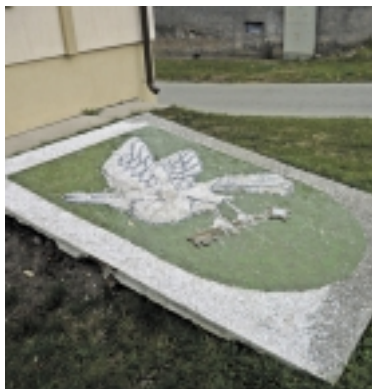
Ar jūs esate matę „gegutę“ ant žemės?

statyta tvarka naudoja savivaldybės institucijos <...>“. Kokia Pagėgiuose yra nustatyta tvarka, suprastite pažvelgę į Pagėgių herbą, paguldytą prie Savivaldybės pastato ant žemės ir uždegniančio kažkokią duobę ar šulinį. Nauda iš to beveik dviguba – į šulinį neįkris žaisti panorėję vaikai ar Pagėgiuose vaikataujantys šunys. Ir antra, jei po Pagėgių kursuotų nors vienas dviaukštis autobusas, toks, kokių daugybė yra Anglijoje, keleiviams iš antro aukšto ant žemės paguldytas herbas būtų tikrai puikiai matomas.