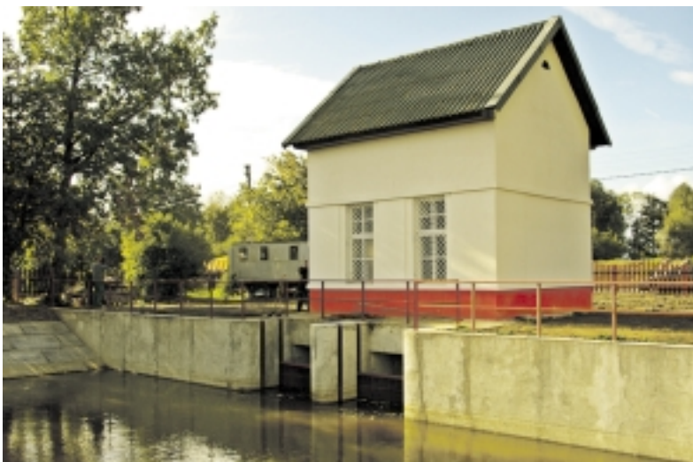
2012 metais renovuota Rusnės žiemos polderio siurblynė.

Didžiausia paramos suma vienam pareiškėjui buvo iki 50 tūkst. Lt. Į šią sumą neįskaičiuotas pirkimo ir (arba) importo pridėtinės vertės mokestis. Pagal šią programą į Kaimo reikalų skyrių 2012 metais kreipėsi aštuoni Šilutės rajono ūkininkai ir viena žemės ūkio bendrovė. Dviem ūkininkams ne-