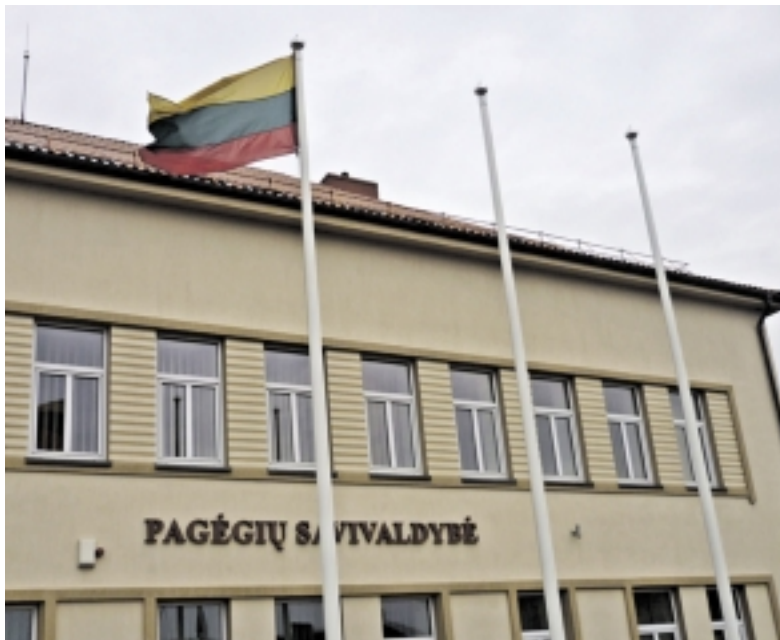
Čia net Pagėgių savivaldybės vėliavos nėra, o ką jau bekalbėti apie Europos Sąjungos vėliavą...

Ir dar, panašu, kad Pagėgių valdžia negerbia net savęs. Cituojame kitą įstatymą – Lietuvos Respublikos valstybės herbo, kitų herbų ir herbinių ženklų įstatymo 8 straipsnio 1 dalyje teigiama: „Savivaldybės herbas savivaldybės tarybos nu-