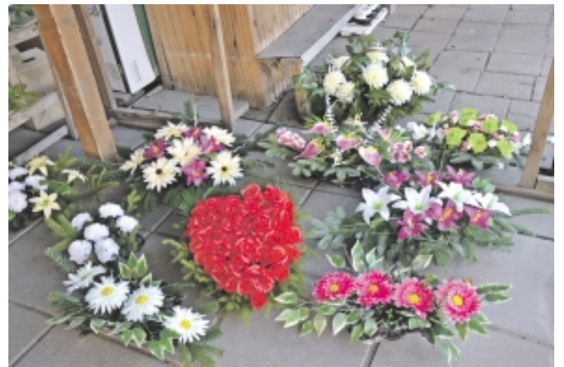
Dabar žmonės nelinkę išlaidauti kapinių puošybai.

Pasak gėlių pardavėjos Ilonos, populiariausių gėlių pozicijos niekam neužleidžia chrizantemos. Šių galima įsigyti pačių įvairiausių dydžių. Jų kainos svyruoja nuo 3 iki 5 litų. Priklausomai nuo dydžio. Taip pat galima pasirinkti ir viengalvę chrizantemą, kurios kaina, priklausomai nuo dydžio, 4–5 litai. „Jos visuomet brangesnės, bet jei perka daugiau, pritaikome nuolaidas“, –