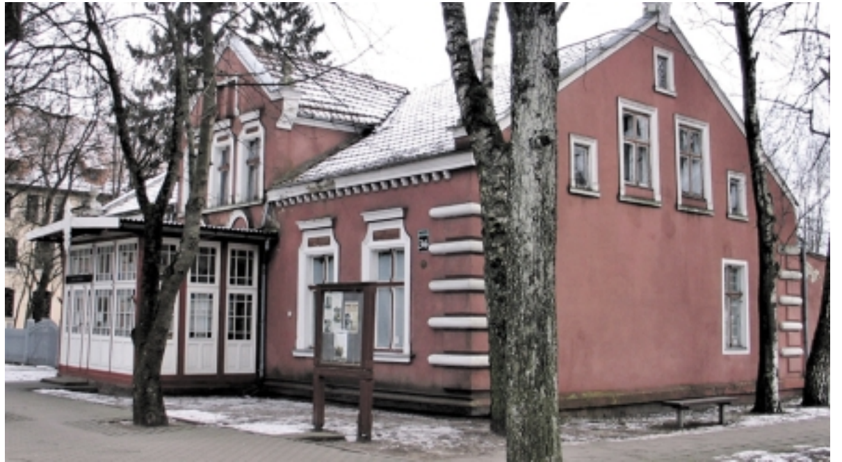
Šilutės kraštotyros muziejus.

Laikraštyje „Šilutės naujienos“, Skirmantės Galvydės straipsnyje „Kodėl valdantieji diskriminuoja Šilutės miesto bendruomenės?“ ši situacija tuomet nušviesta taip: „<...> Šilutės bendruomenės nariai (straipsnyje minima, kad jų buvo 10, – aut. pastaba) aptarė, kad senoji sodyba būtų ne tik puiki vieta rinktis įvairių NVO nariams, bet rengti bendrus kultūrinius, labdaros renginius, koncertus, parodas,