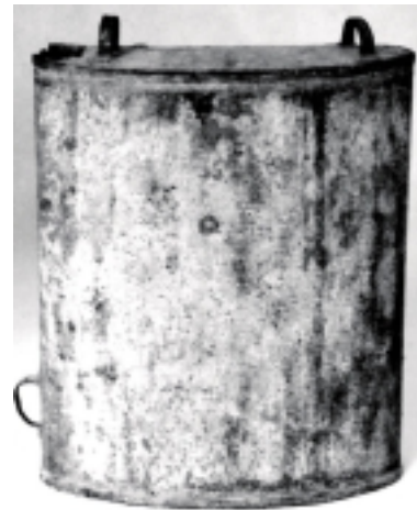
Anodijai gabenti skirtas indas, slepiamas po rūbais.

to - bažnyčios, rotušės, dvaro ar kito galios objekto. Žibuose tokiu akcentu galima laikyti Teismo rūmus. Jie taip pat yra kaip jungiamoji grandis, rodyklė į Šilokarčemą. <...>