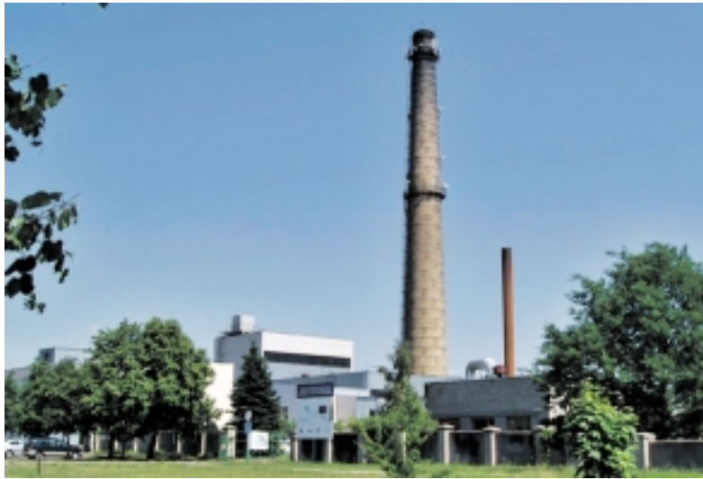
Šilutės šilumos tinklų įmonė.

ŠŠT eksplotuoja 8 katilines: po dvi Šilutėje ir Švėkšnoje, po vieną – Traksėdžiuose, Juknaičiuose, Rusnėje, Kintuose. Kuras įvairus: Šilutės centrinėje katilinėje – biokuras, medžio granulės (rezerve – pigesnis žymėtas dyzelinas), Tilžės gatvės katilinėje – žymėtas dyzelinas, Traksėdžiuose – biokuras