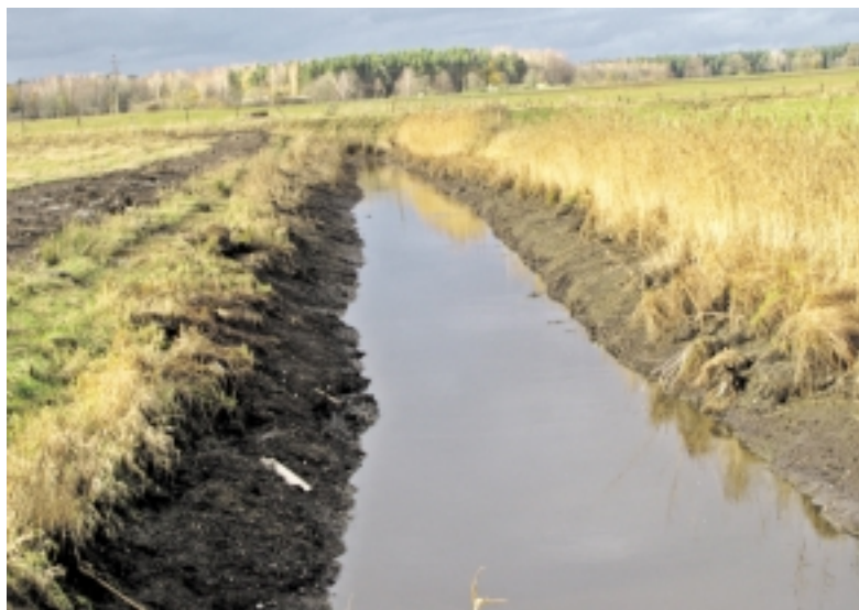
Gavus paramą pamario krašte buvo sutvarkyta 22,97 km griovių.