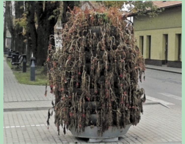
Šilutės seniūno pastangomis Tilžės gatvės parkelio gėlynai pasi-puošę naujomis gėlėmis.