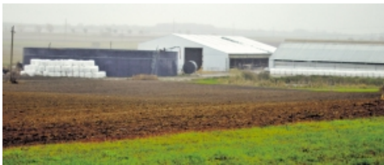
Žemės ūkio kooperatyvo „Lumpėnų Rambynas“ skysto mėšlo rezervuarai buvo įrengtas prieš 11 metų, jo talpos pakanka pusei metų.

„Asmenys, turintys kauptuvus ir kaupiantys skystą mėšlą bei srutas, turi taikyti aplinkos oro taršos mažinimo priemones. Todėl virš mėšlo rietuvių reikia įrengti įvairias stogo dangas – plaukiamąsias dangas, mėšlą už-