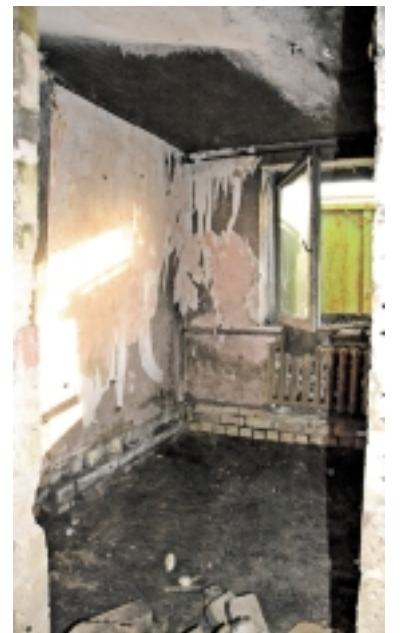
ir gyvi“, - atviravo moteris.

Moteris pasakojo, kad bute, kuriame gyvena jau daugiau nei 20 metų, gaisras kilo pirmą kartą. Tiesa, ugnis prieš dvejus metus taip pat pridarė šeimai nuostolių – suplekėjo ūkinis pastatas su visais jame buvusiais ūkio padargais. O dabar, ir vėl... „Niekas nesvarbu. Kaip nors susitvarkysime. Man svarbiausia, kad vaikai liko sveiki