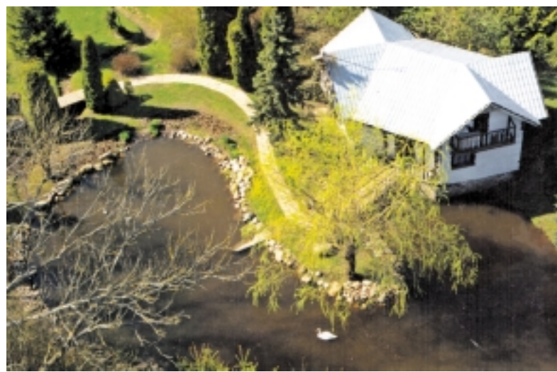
Gražiai tvarkoma ūkininko sodyba.