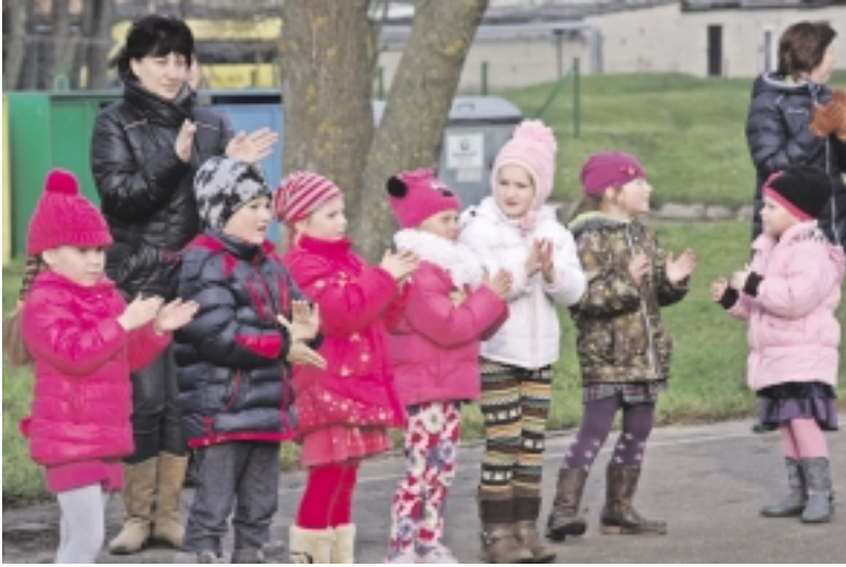
Rusnėje, šalia Donelaičio g. 9 namo, atidaryta nauja žaidimų aikštelė vaikams, iki 12 metų. Aikštelė aptverta, todėl joje esantys vaikai tikrai bus saugūs.

Ne kartą „Šilokarčemoje“ rašėme apie tai, kaip gražinasi Rusnės sala, vis pasipuošdama naujomis erdvėmis. Štai dar prieš žiemą įkurta nauja erdvė, skirta mažiesiems salos gyventojams. Aptvortoje žaidimų aikštelėje nuo šiol galės dūkti patys mažiausi – vaikai, iki 12 metų.