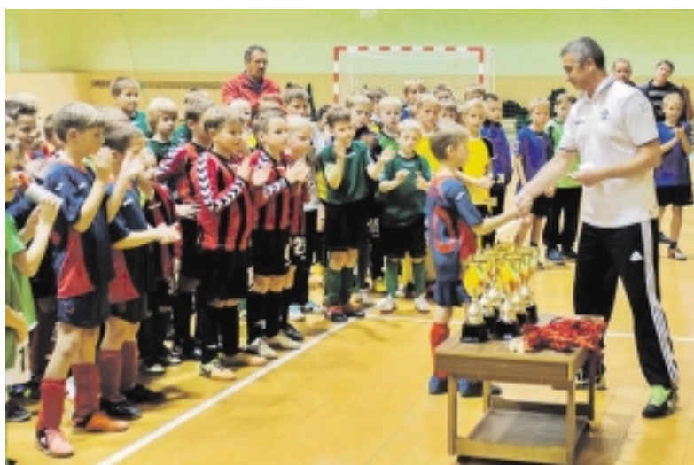
Apdovanojimo ceremonija, kurios metu išdalinta per 150 medalių ir gausybė taurių.

Kaip ir kiekvienais metais, pasibaigus Lietuvos vaikų futbolo lygos rungtynėms, Šilutėje organizuojamas mažojo futbolo vaikų turnyras VŠĮ „Šilutės sportas“ taurėms laimėti. Šiais metais turnyre dalyvauja 14 komandų iš visos Lietuvos.