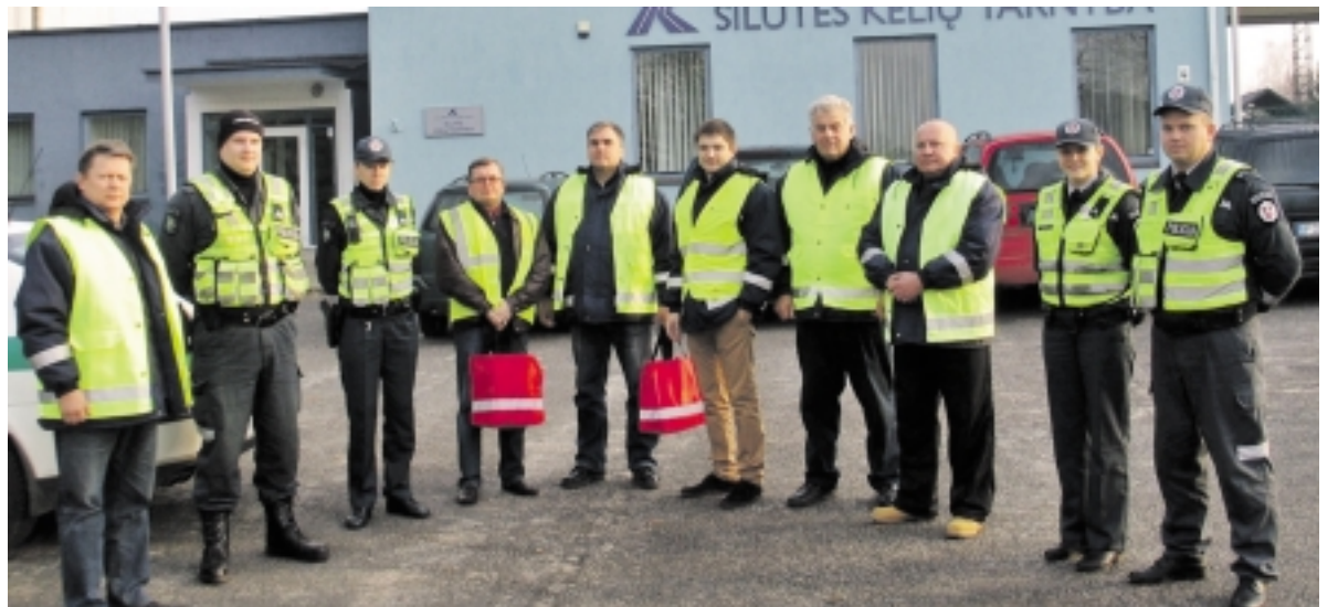
Akcijos dalyviai prieš išvažiuodami į rajono kelius.