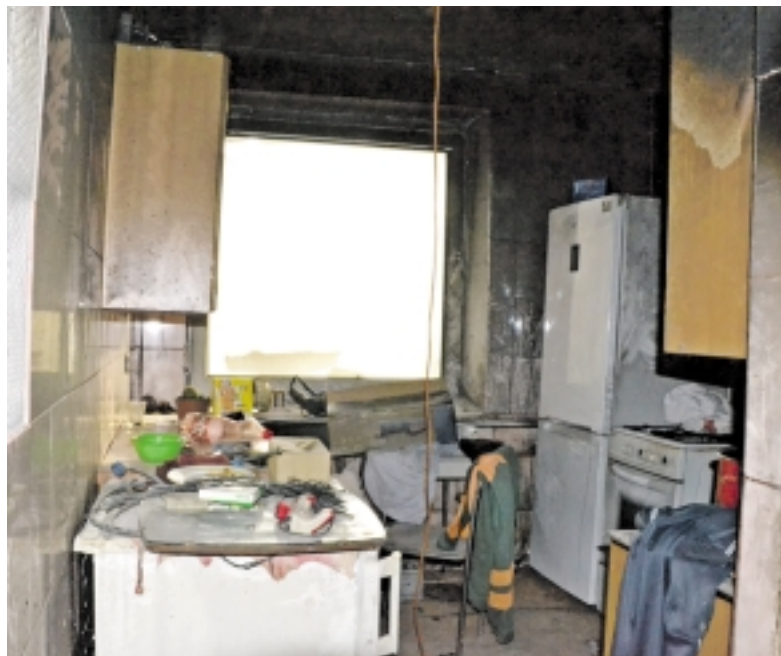
Gaisras ugniagesių gelbėtojų buvo užgesintas, o prasisklaidę dūmų kamuoliai atvėrė vaizdą – iš tvarkingo dviejų kambarių buto liko tik juodas, stiprų degėsių kvapą skleidžiantis urvas.