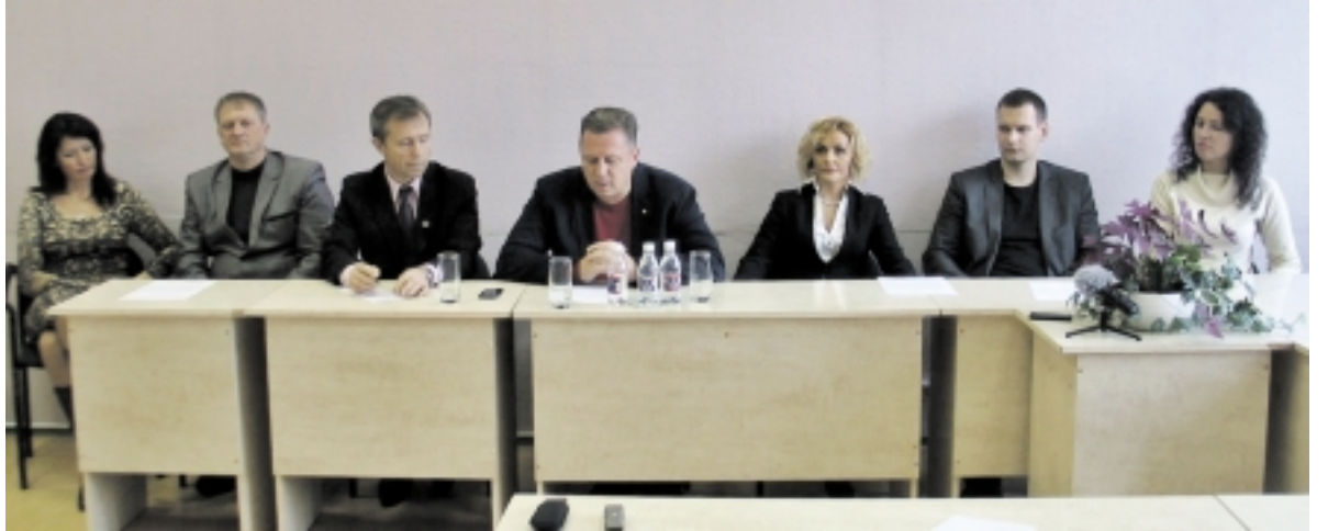
Dauguma Liberalų ir centro sąjungos (liberalų) tarybos narių dalyvavo spaudos konferencijoje.

Po to prasidėjo klausimai. Vienas jų, kaip šios partijos nariai žiūri į rinkimų komitetą, kuris jau susiformavo ir taip pat dalyvaus kovoje dėl valdžios Savivaldybės taryboje. Juo labiau, kad kandidatė į