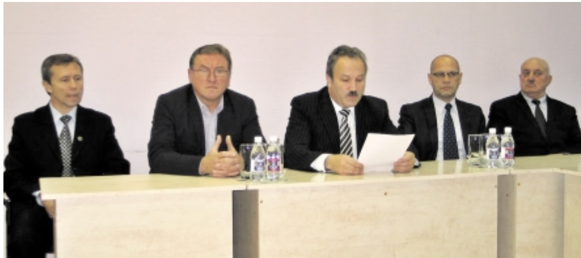
Koalicijos partneriai išreiškė bendrus siekius iki šios kadencijos pabaigos.