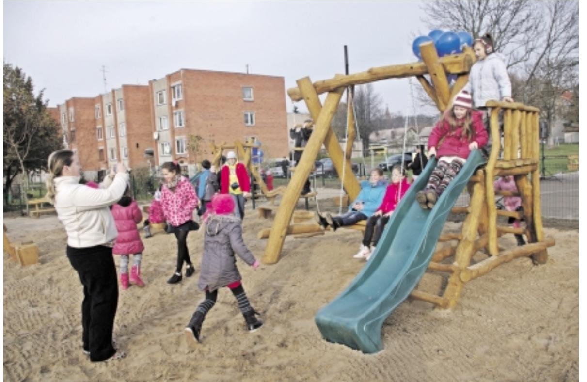
Atidarymo renginyje vaikai linksmi išbandė naujuosius pramoginius įrenginius.