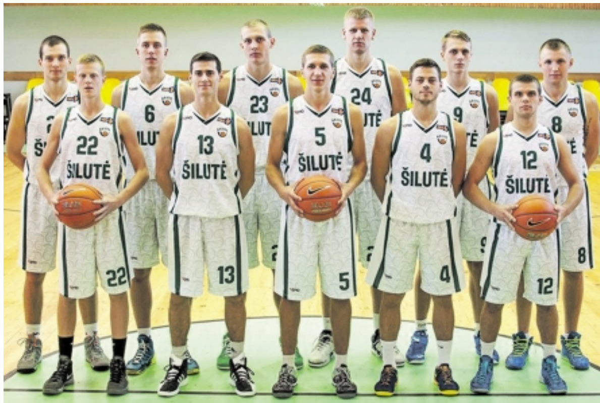
„Šilutė“ – pilna jauno kraujo, galinčio skraidyti, daryti klaidas, pralaimėti, laimėti, paslysti lemiamu momentu, bet atsikelti ir tapti komanda, kuria mes taip tikime!

Išvykoje, ketvirtajame rungtynių ketvirtyje, šilutiškiai paskutinę sekundę taikliu tritaškiu „nužudė“ „Žalgirio“ dublerius 67:68 ir parvežė namo labai lauktą pergalę.