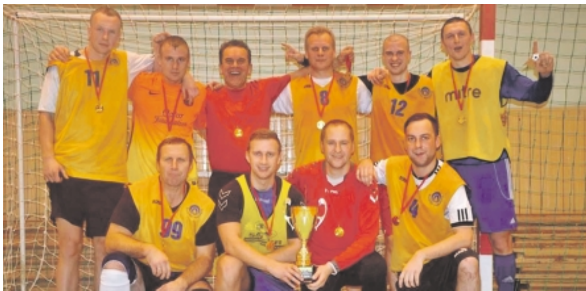
2014 metų salės futbolo čempionai – komanda „Šilutės vandenys“.

Penktadienį užbaigtas tradicinis suaugusiųjų salės futbolo 5x5 pirmenybės, kuriose dalyvavo 5 komandos. Tai: „Šilutės vandenys“, „Pamarys“, „FK Šilutė jaunieji 1“, „Naujas Parkas“, „FK Šilutė jaunieji 2“.