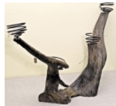
Namuose pagaminta žvakidė.

XX a. pradžioje, iki Pirmojo pasaulinio karo, buvo naudojamos lempelės be stiklo, su rankenėle, vietoje kamščelio būdavo uždėtas skardinis knato laikiklis, kartais jos būdavo perdirtos iš buteliukų, vėliau šios, dažniausiai skardinės lempelės, nebenaudojamos, mat nors ir