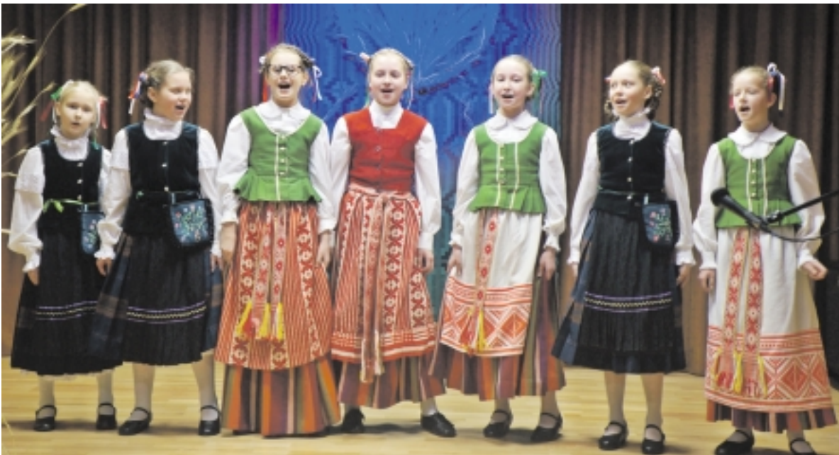
Festivalis „Pažinsi tautosaką – atrasi save“ vyko jau 11-ąjį kartą.

Senujų kaimo tradicijų kultūros centre ir vėl iš visos Lietuvos pažino senojo mūsų tautos paveldo puoselėtojai. Iš viso per 70 dalyvių – Mažosios Lietuvos, Aukštaitijos, Žemaitijos, Dzūkijos, Suvalkijos regionų atstovų – pristatinėjo savo tarmę, tradicines dainas, pasakojo įvairius pasakojimus ir grojo tradiciniais instrumentais.