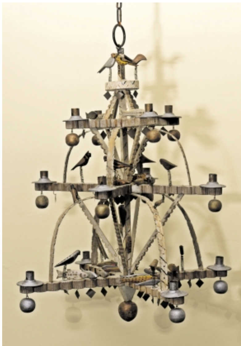
Įspūdingieji lietuvininkų mergvakario sietynai.

Mažojoje Lietuvoje žibintai išnyko dviem trim dešimtmečiais anksčiau nei visoje Lietuvoje. XIX a. pabaigoje jie sparčiai traukėsi iš gyvenamosios aplinkos užleisdami vietą tobulesnėms ir patogesnėms