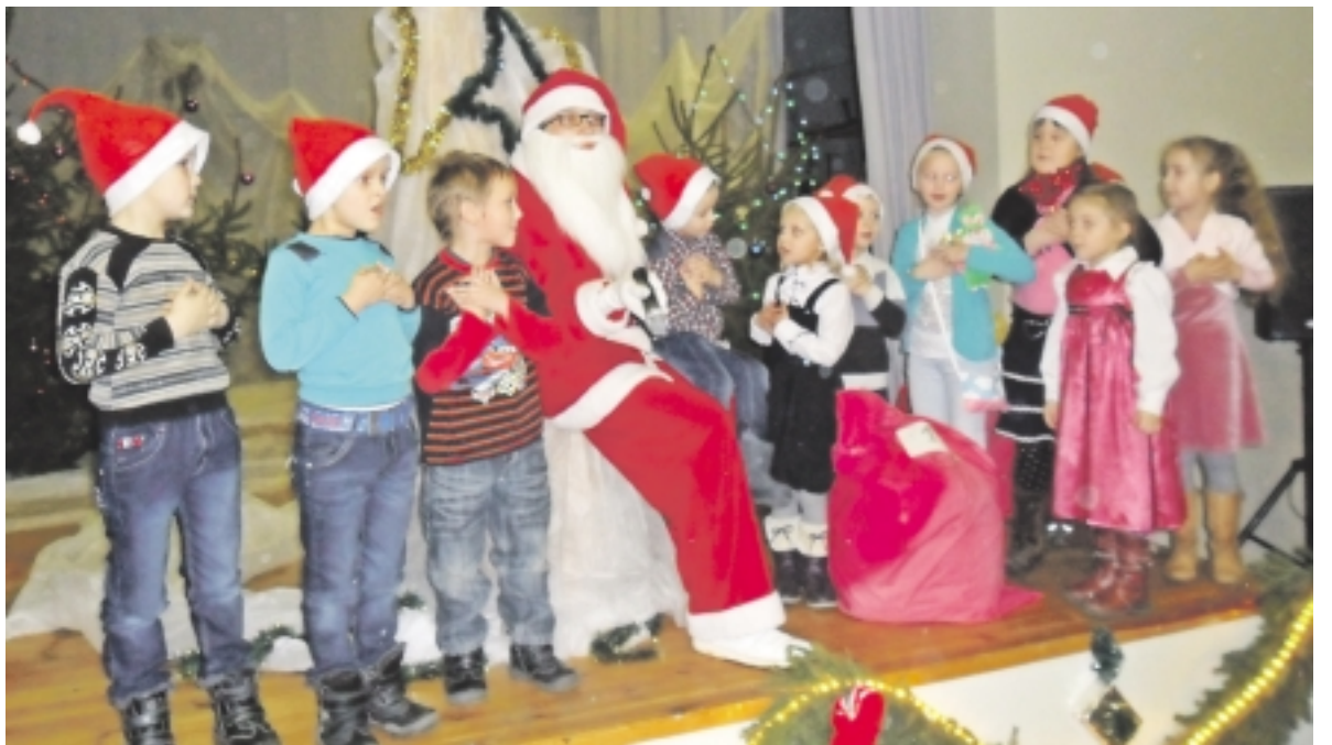
Į eglės įžiebimo šventę atvyko net du Kalėdų Seneliai. Vienas atkeliavo iš Švedijos, kitas – iš Panevėžio.