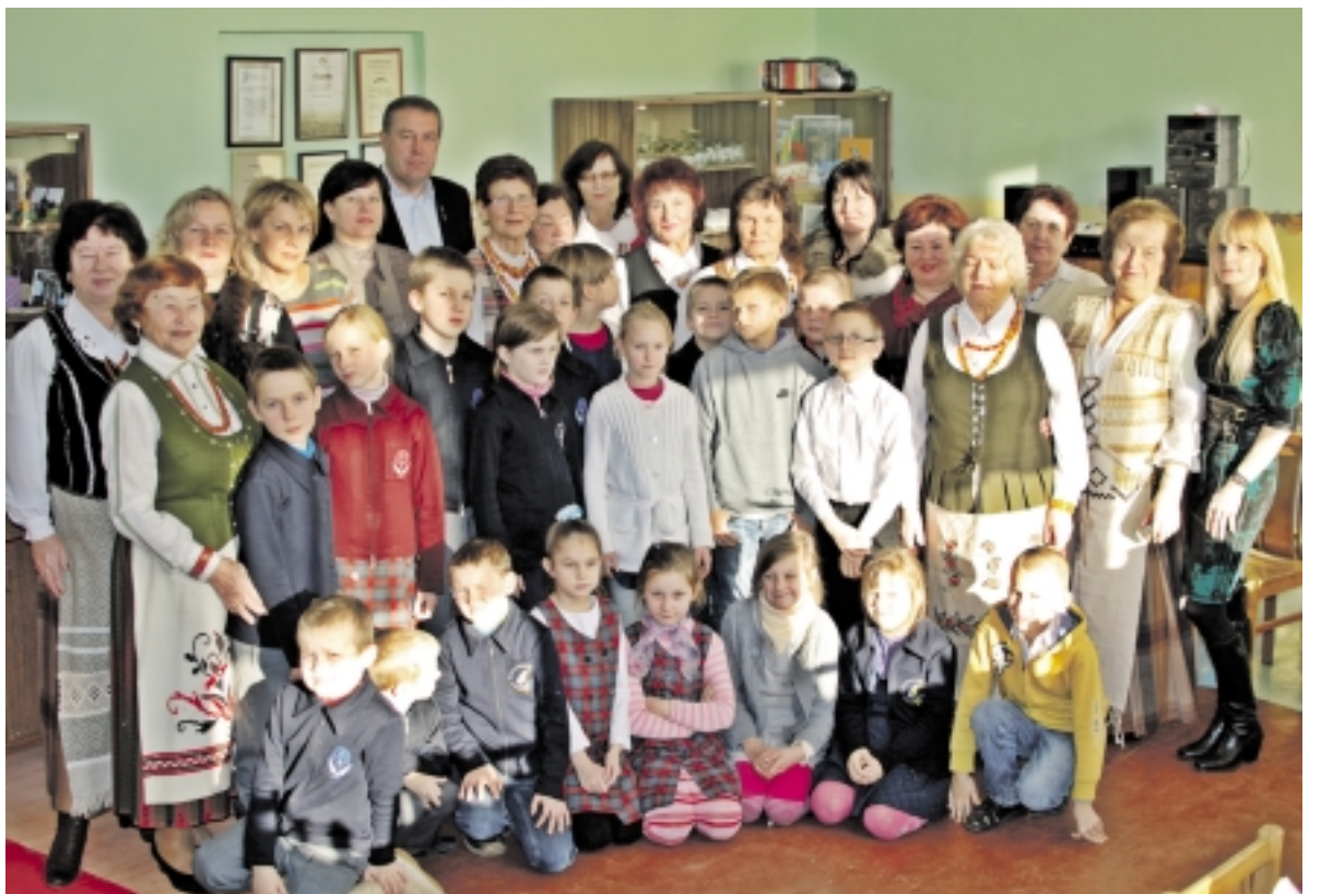
Vaikai itin noriai renkasi į „Moterų seklyčios“ renginius.

Šventei baigiantis, nelabai ėjo suprasti, kas laimingesni – „Seklyčios moterys“ ar apdovanoti vaikai. Atrodė, kad net ne dovanos, o užsimezgusi draugystė juos papuošė nuoširdžiomis šypsenomis.