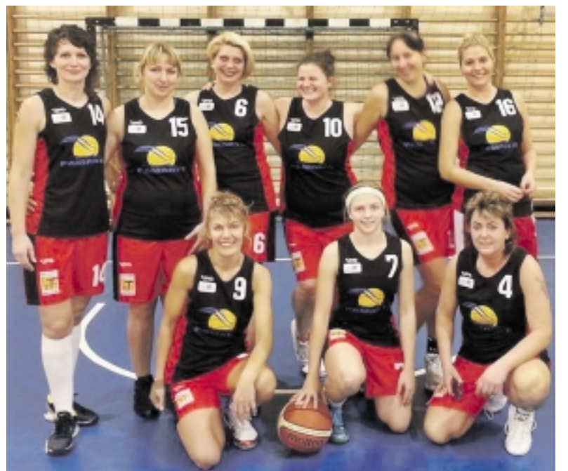
Šilutiškės paskutinėse I rato varžybose džiaugėsi pergalė.

Pamariui atstovaujanti šilutiškės krepšinininkės padėjo tašką paskutinėse Lietuvos moterų krepšinio „A“ lygos pirmojo rato rungtynėse, kuriose 83:54 įveikė Panevėžio KKSC „Naftėnas“ merginas. Po šių rungtynių šilutiškių sąskaitoje – dvi pergalės ir trys pralaimėjimai.