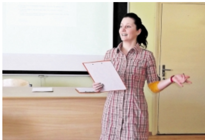
Atsiradus laisvai darbo vietai Deimilė grįžtu mokyti į Šilutę.

Neseniai Lietuvoje girdėjosi pedagogų streikai. Maži atlyginimai, per didelis ar per mažas krūvis, blogos darbo sąlygos, neišauklėti ir nemandagūs vaikai – maža dalelė problemų, kurias siekia spręsti pedagogai. Štai Šilutės atvejis kiek kitoks. Patyręs pedagogas atvirai nešnekės dėl vidinės baimės, o štai jaunam specialistui neatsiras vietos tarp pedagogų.