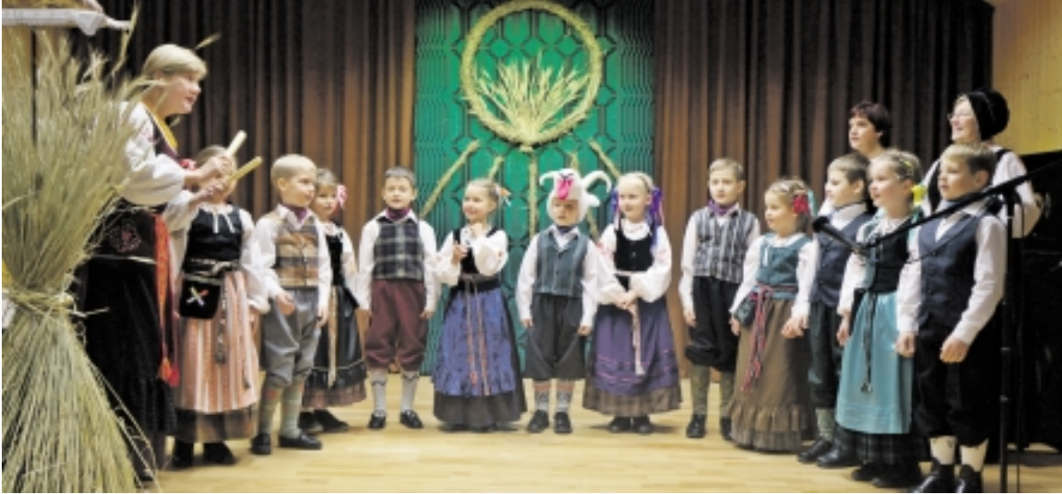
Bikavėnuose vykusiame festivalyje pasirodė per 70 dalyvių.