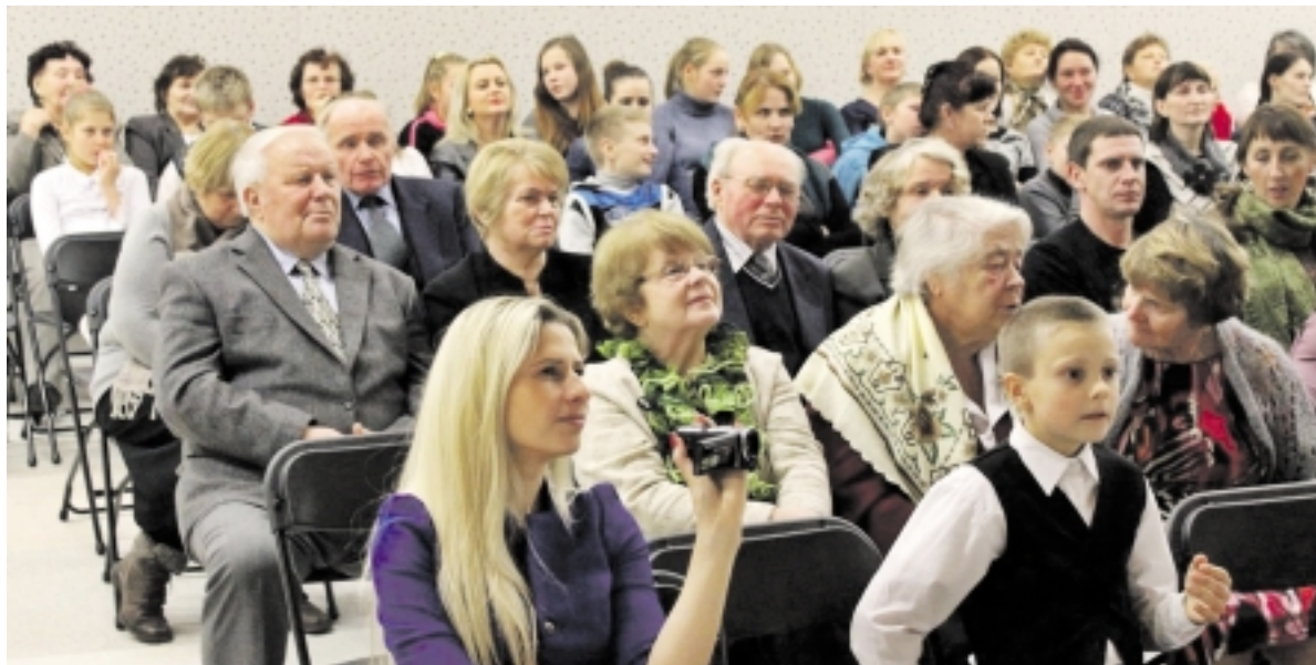
Į renginį susirinko gausus būrys stoniškėčių.