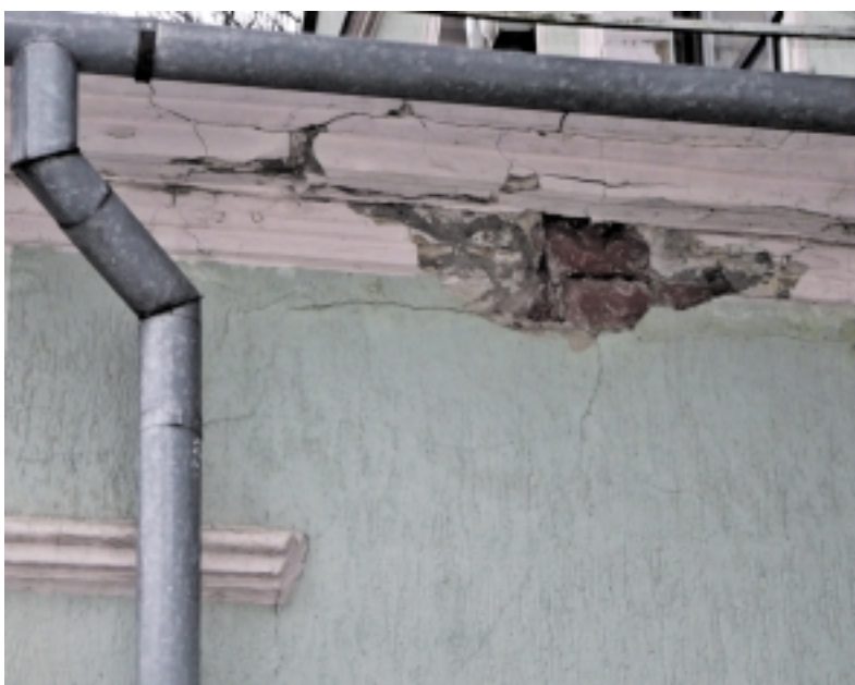
Šilutės apylinkės teismo pastatas nuo Nepriklausomos Lietuvos laikų rimčiau remontuotas dar nebuvo.