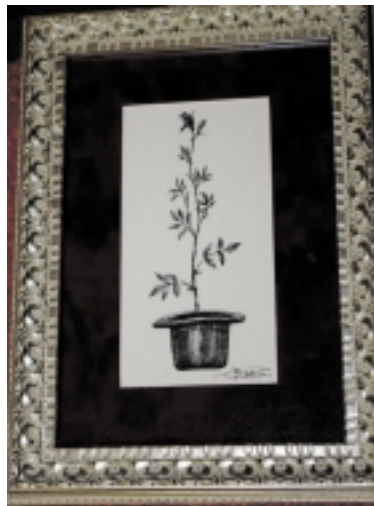
Štai kaip atrodo organizatorių išgirti ypatingieji pakvietimai į H. Šojaus dvaro atidarymą.

rusiško stiliaus „dvaro renginį“, kuriame dalyvaus tik 60 vienetų rajono ponijos. Mūsų, baudžiauninkų, vieta yra tik už meninės kalvystės darbo dvaro tvoros. Ir tai pristatoma kaip renginys, kurio misija – suteikti postūmį Šilutės kultūrai!