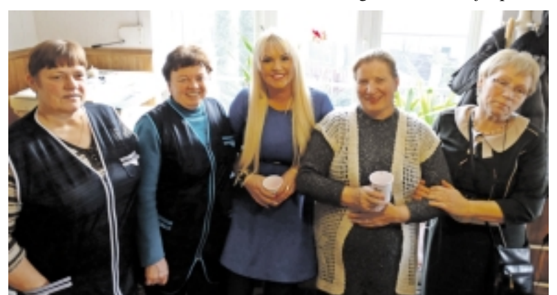
„Heide“ bendrijos aktyvistės.