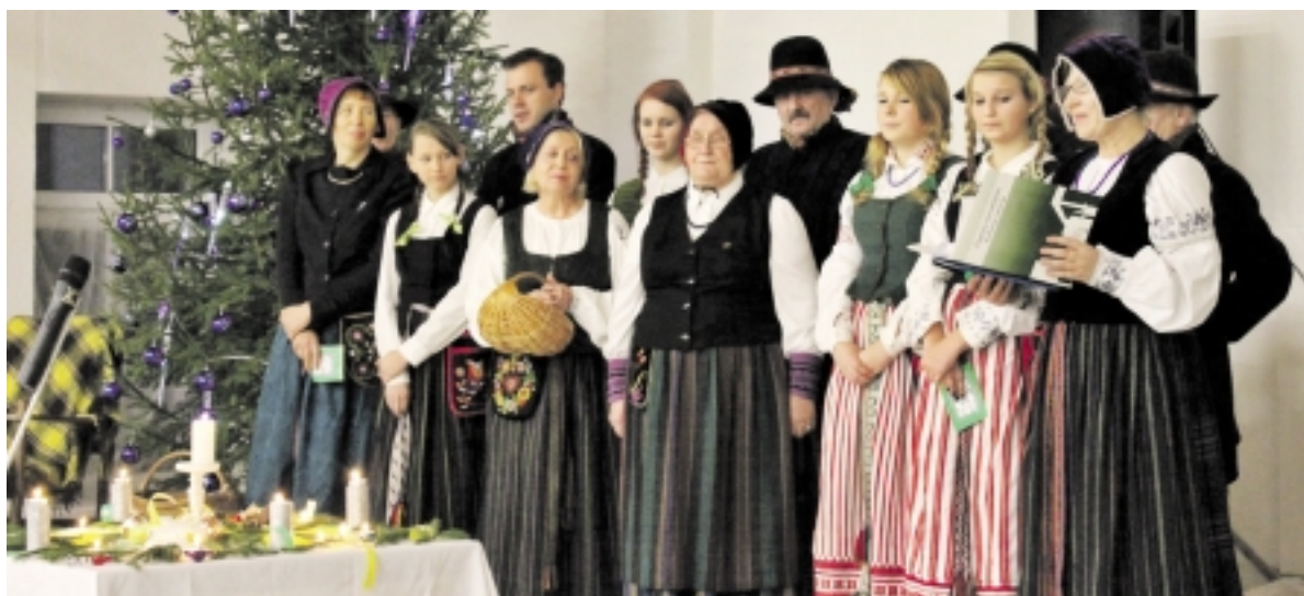
Folkloro ansamblis „Kamana“ visus džiugino eilėmis, dainomis, šokiais bei žaidimais.