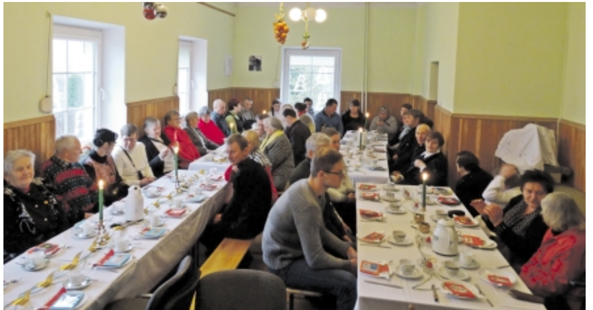
Prie bendrijos stalo susirinko gausus būrys dalyvių.