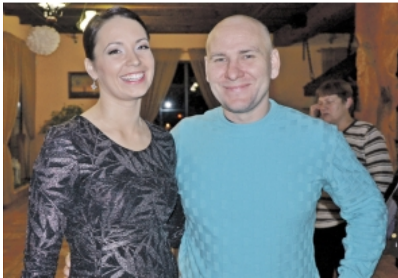
Tarp gražiausiai gyvenančių daugiavaikių šeimų – jaunyste spindintys veidai.

Vėjuotą gruodžio 12-osios vakarą į Pagrynių kaimo prieigose įsikūrusią „Jeronimo užėigą“ sugužėjo daugiau nei du šimtai kviestinių svečių. Šio susiejimo tikslas – pasveikinti gražiausiai savo gyvenimą kuriančias daugiavaikes šeimas.