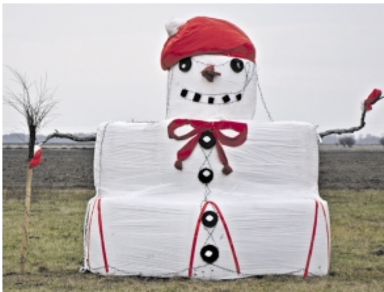
Nors pamaryje sniego šiuo metu nė su žiburiu nerasi, tačiau apie išibėgėjančią žiemą perspėja milžiniškas senis besmegenis.

Vieną dieną ėmė ir išdygo didžiulis senis besmegenis visai šalia ūkio, kuriame ūkininkauja rusniškė. Niūrioje, lietaus permerktose