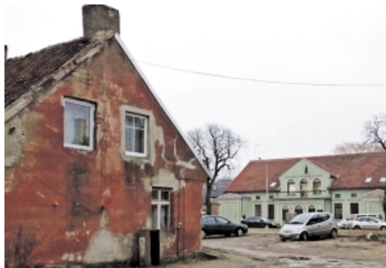
Šilutėje, M. Jankaus g. 3 name, buvo nužudytas 35-erių metų vyriškis.