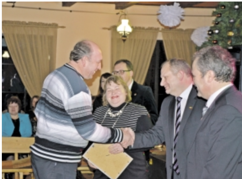
Padėkos dovanų atsiėmimas šeimoms sukėlė daug džiaugsmo.