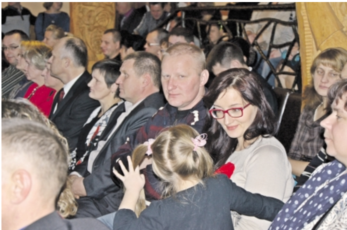
Susirinkusieji klausėsi sveikinimo žodžių bei šventinio koncerto.