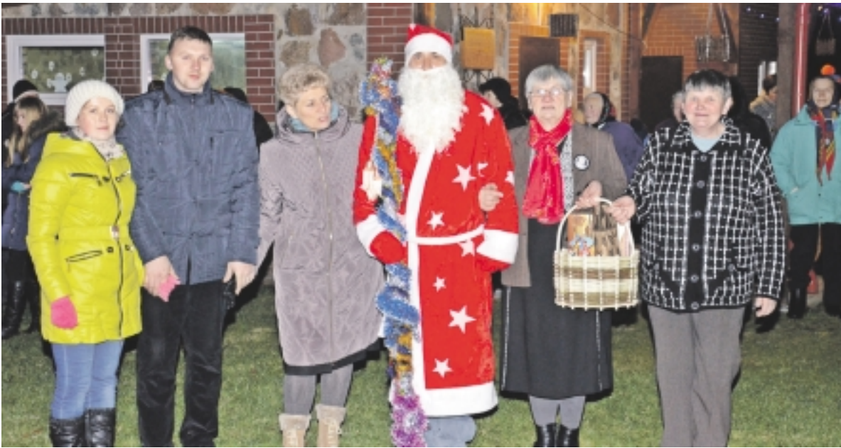
Akimirka iš Stubrių kaimo šventės.

Nors šiemet žiema mūsų nelepina žiemiškais orais – sniego pamaryje nerasime nė lopinėlio – nenumaldomai artėja gražiausios metų šventės. O iki jų Šilutės rajono bendruomenės renkasi į adventinius vakarus. Stubriškiai – ne išimtis.