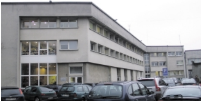
Kita Savivaldybės pusė.

Kaip sakoma apie tyrimo metodiką, pagal išvardintus kriterijus savivaldybės indeksuojamos. Gautus balus pavertus indeksais LLRI idealia laiko tokią savivaldybę, kuri moka taupyti mokesčių mokėtojų pinigus, gyvena pagal savo pajamas, skaidriai naudoja biudžeto lėšas, savo veikla neriboja vartotojų pasirinkimo, skatina konkurenciją tarp paslaugas teikiančių įmonių ar įstaigų. Idealiomis savivaldybėmis laikomos ir tos, kurios mažina