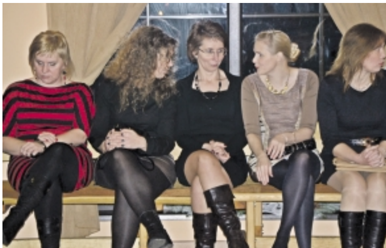
Šilti pokalbiai netilo visą vakarą.

tingas dėmesys. Gardžiais užkandžiais nukloti „Jeronimo užėigos“ stalai kvietė skanauti, o sveikinimo žodžiai ir dainos netilo visą vakarą. Šešioms dešimtims šilutiškių šeimų buvo įteikti padėkos raš-