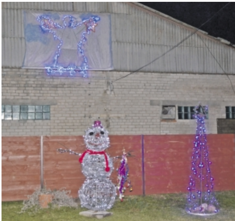
Įmantriomis kompozicijomis papuoštas ir Radvinskų ūkis.

Tad tie, kurie dar nematė šių žiemos nuotaiką spinduliuojančių grožybių, gali apsilankyti Rusnėje. Milžiną senį besmegenį rasite važiuojant pro Rusnės degalinę link Skirvytėlės gatvės, 2-osios krantinės link.