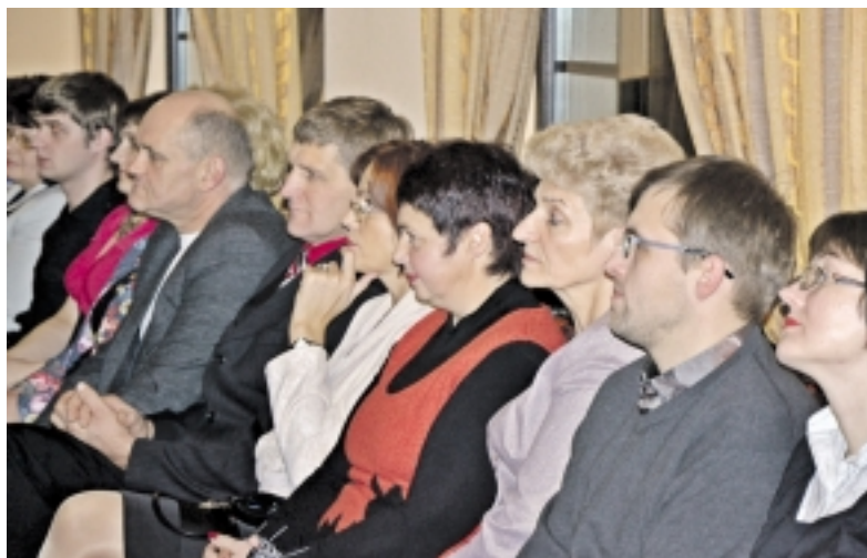
K. Komskui mieliai sutiko padėti ir seniūnijų darbuotojai.