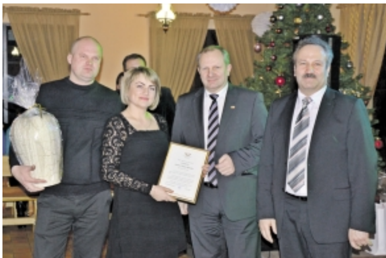
Pasveikinta 60 daugiavaikių šeimų.

Lietuvos Respublikos Parlamentui 2014 metus paskelbus Šeimos metais, mūsų kraštiečiui, LR Seimo vicepirmininkui Kęstui Komskui kilo idėja pasveikinti Šilutės rajone gražiausiai gyvenančias