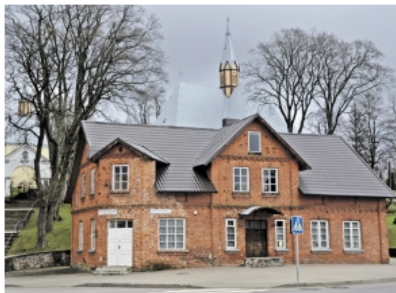
Visai šalia bažnyčios veikia Žemaičių Naumiesticio šarvojimo salė.

Žaibiškai suderintų veiksmų dėka pavyko likviduoti problemą ir jau 2014 metų vasaros pabaigoje ir degutiškiai, ir visos seniūnijos gyventojai džiaugėsi sėkmingai atliktais darbais. „Viskas pavyko puikiai, tai buvo labai didelis įvy-