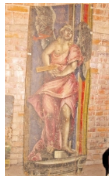
Anot L. Kavaliausko, angelo figūra, tapyta ant lentų, greičiausiai buvo panaudota kaip dekoracija bažnytinės šventės metu.

Švėkšnoje daugelį metų niekieno nematomos dūlėjo bažnytinės relikvijos, jas įvertino paveldosaugininkai ir ištraukė jas į dienos šviesą.