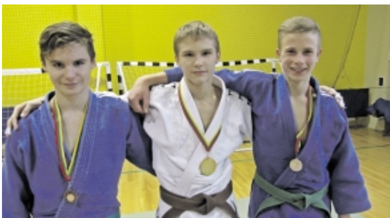
Jaunieji Šilutės SM dziudo atstovai.

Sausio 10 dieną Kaune organizuotas tarptautinis dziudo turnyras „Sausio 13-osios aukoms atminti“. Į turnyrą susirinko sportininkai iš Lenkijos ir Lietuvos miestų.