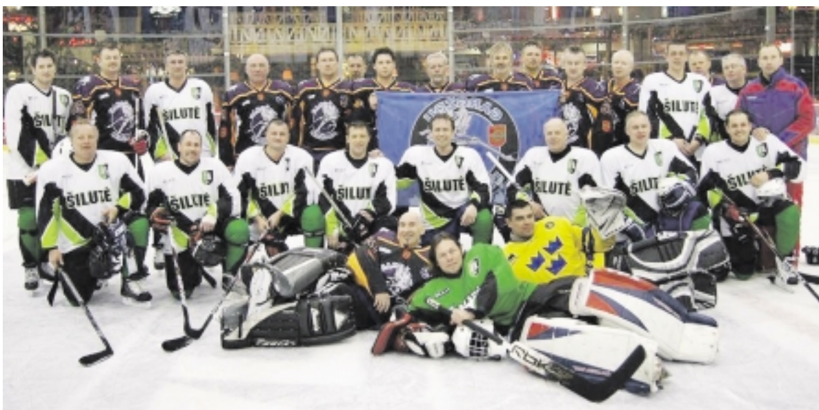
Šilutiškiai drauge su kolegomis iš Gargždų „Ledžigos“.

„Šilutės“ ledo ritulio klubas kovas ant ledo tęsia „Žemaitijos ledo“ čempionate ir po septynių rungtynių turėdami 10 taškų drauge su Klaipėdos „Toto“ ekipa turnyrinėje lentelėje dalijasi 3–4 vietas. Šilutiškiai aršiai kovojo čempionate dėl Mažosios taurės. Sausio 19 dieną ant Klaipėdos „Akropolio“ ledo „Šilutė“ išmėgino jėgas su vietos „Toro“ ekipa. Bandyimų ir progų pelnyti įvartį turėjo abi komandos, tačiau kėlinukai baigėsi „sausai“. Išaiškinti nugalė-