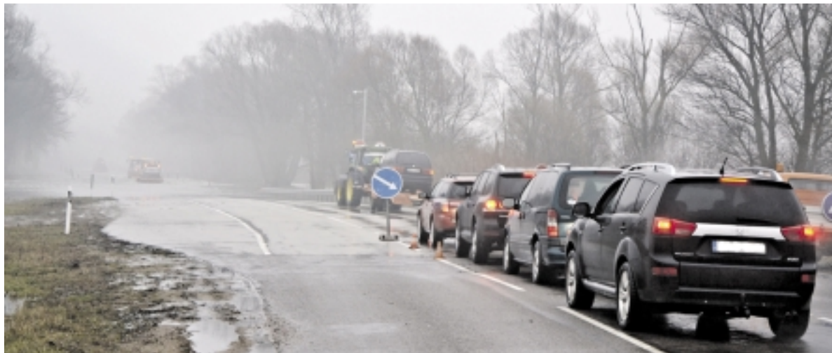
Štai tokia rusniškių kasdienybė potvynio metu...

Sausio 23 dieną į Šilutės rajono savivaldybės didžiąją posėdžių salę susirinko Ekstremalių situacijų komisijos nariai, taip pat Šilutės rajono seniūnijų seniūnai. Tuokart aptarta, kaip pasiruošta šių metų potvyniui. Žinia, pirmoji potvynio banga pamarij jau pasiekė.