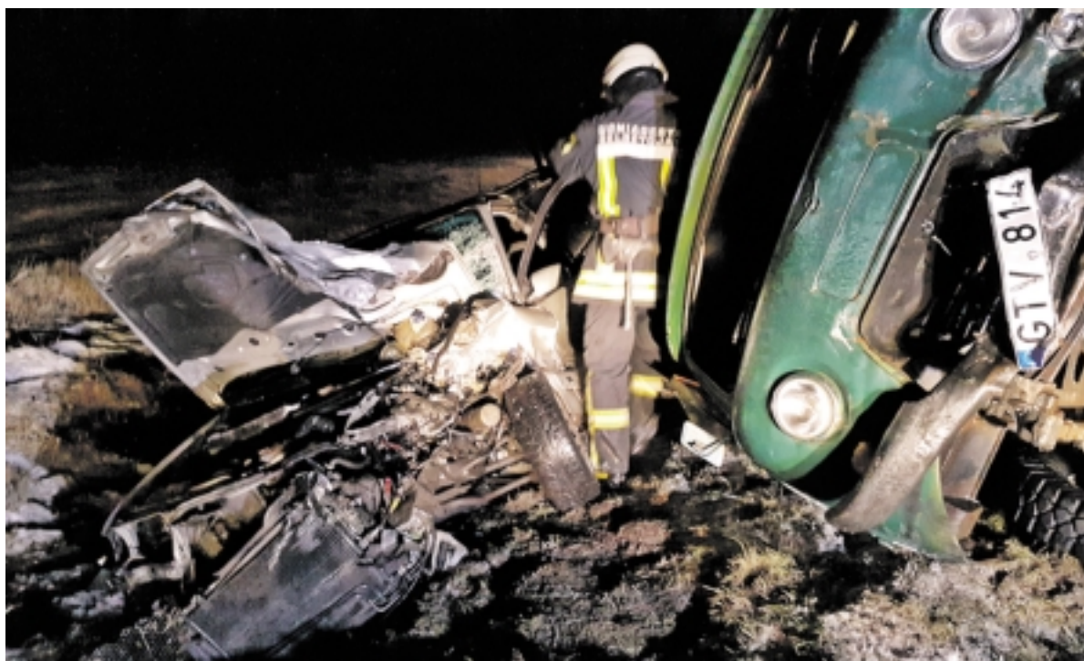
Girto vairuotojo vairuojamas „UAZ“ kaktomuša rėžėsi į „Audi“.