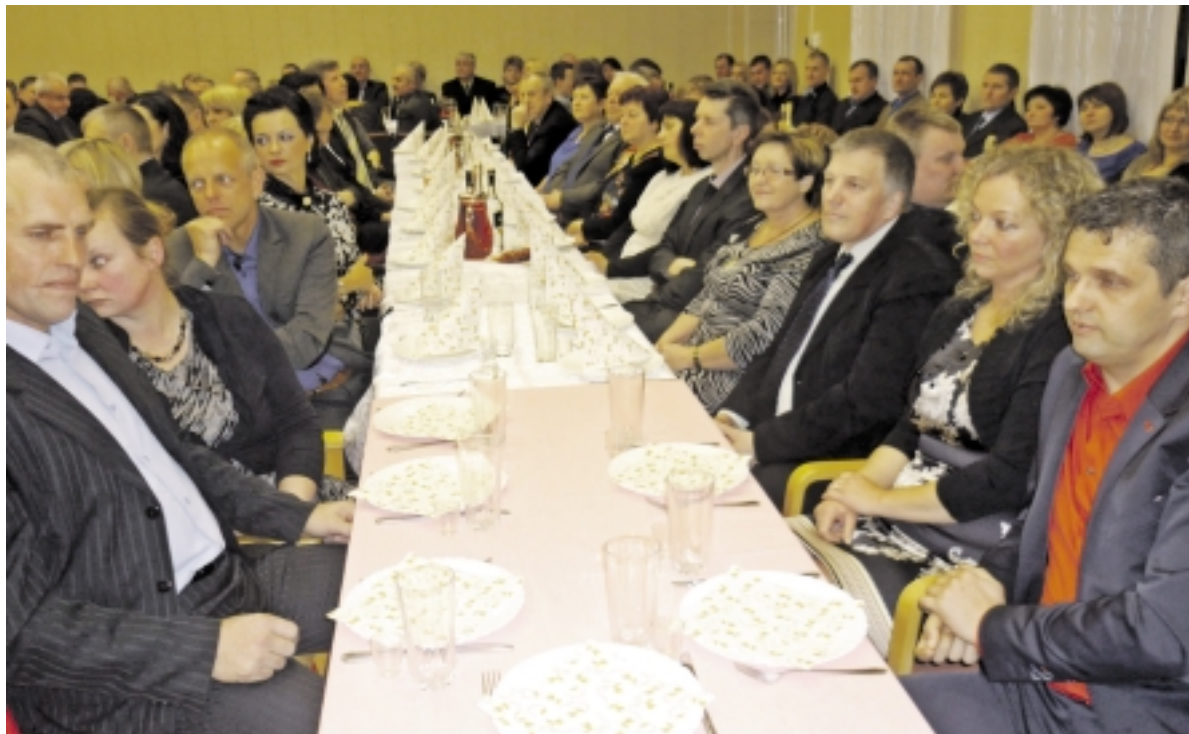
Ūkininkai vos tilpo prie gražiai papuoštų stalų.

Graži Pagėgių krašto žemdirbių šventė praėjusio penktadienio vakarą buvo surengta Piktupėnų kaimo bendruomenės namuose. Juos sveikino valdžios ir įmonių, parduodančių žemės ūkio techniką ir trąšas, atstovai, linksmino grupė „Ambrozija“, dangų nušvietė fejerverkai.