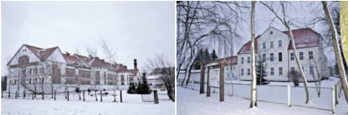
Rusnės specialioji mokykla įsikūrusi ištis didelėje teritorijoje. Čia įstaigos ugdytiniai jaučiasi puikiai, tačiau jų ateitis lieka neaiški. Vis dėlto tėvai nesutinka, kad jų vaikai būtų iškelti į Šilutėje esančias žymiai mažesnes patalpas.

Sausio 30 dieną į Rusnės specialiosios mokyklos salę sugužėjo ištis daug šios mokyklos ugdytinių tėvelių. Tuokart ne tik aptarti pusmečio mokinių rezultatai, bet ir diskutuota itin aktuali klausimu. Žinia, kad šią mokyklą iš Rusnėje esančių pastatų komplekso norima iškraustyti ir įkurti čia Jūrų kadetų mokyklą. Tėvai gyvena nežinioje, mat neaišku, koks likimas laukia jų neįgalių vaikų. „Apie tai, kad nori mūsų mokyklą iškraustyti, sužinojome iš spaudos, niekas mums nieko neaiškina“, - piktinosi mokyklos ugdytinių tėvai.