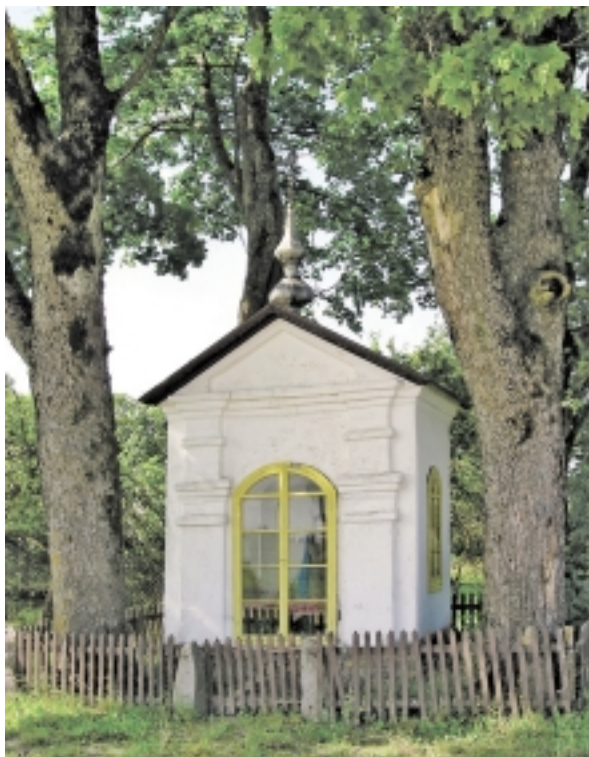
Mūrinė koplytėlė Bikavėnuose. 2005 m.

Ryškiausias kaimo akcentas – prie Šilalės–Šilutės plento, ties žvyrkelio į Aušbikavį atsišakojimu, boluojanti mūrinė koplytėlė. Tai