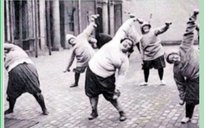
Iki vasaros liko keturi mėnesiai. Laikas, mergaitės, laikas.