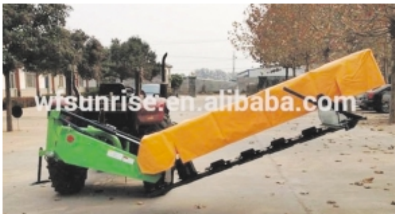
Tokias Kinijoje pagamintas šienapjovės siūlo pirkti internetinė parduotuvė „Alibaba“, o tokias – jau su lentele „Praha“ parduoda UAB „Agropara“.