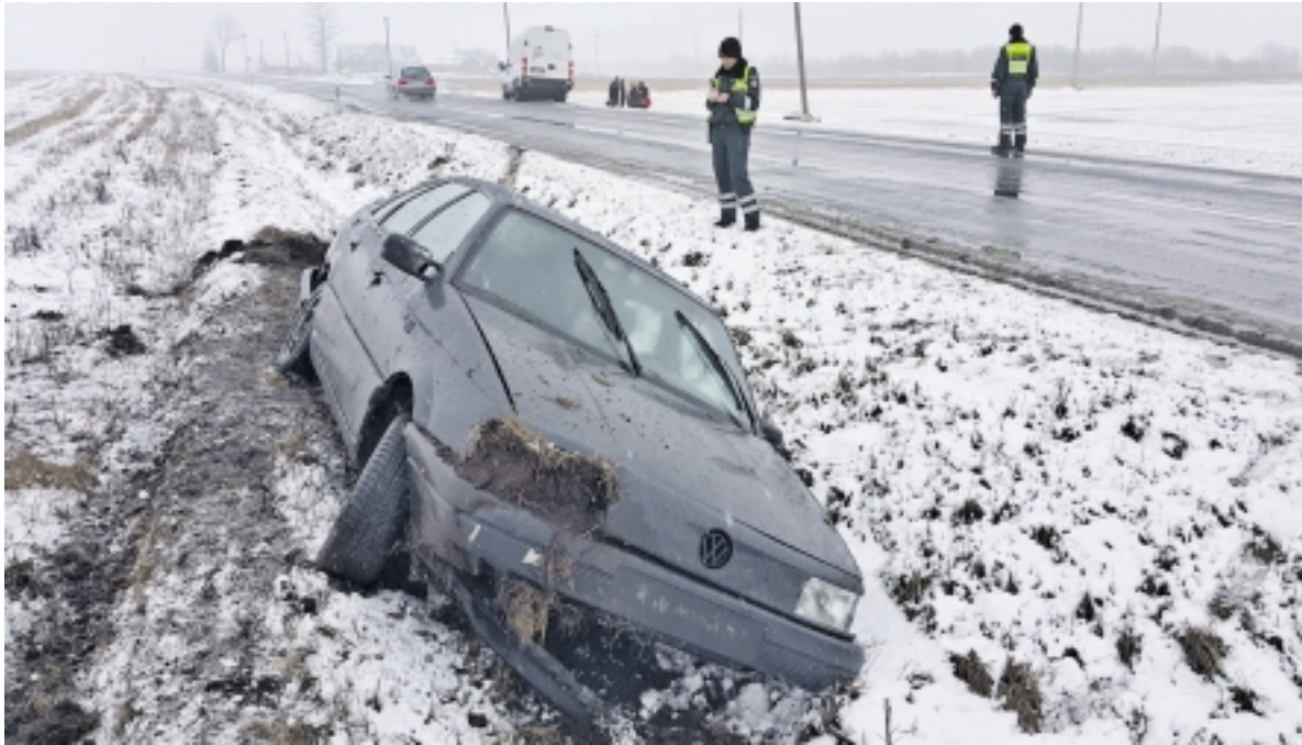
Netoli Laučių gyvenvietės automobilis „VW Passat“ atsitrenkė į maršrutinį autobusą ir atsidūrė griovyje.