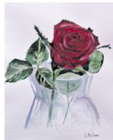
„Rožė yra rožė“.

užsukti Šilutėje į „Raganės“ gėlių saloną.