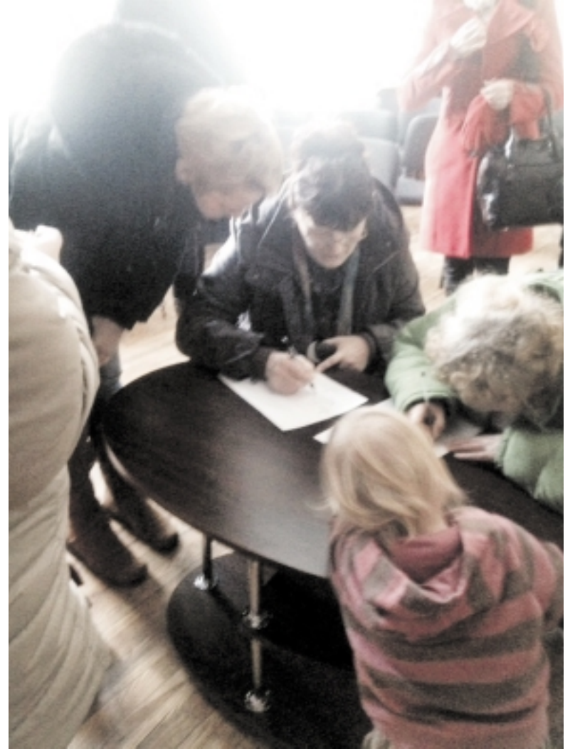
Tėvai surinko parašus ir su jais ketina kreiptis į rajono valdžią, gal tuomet jiems bus kas nors paaiškinta. Anot susirinkusių Rusnės specialiosios mokyklos ugdytinių tėvų, jei niekas nepadės, šie kreipsis ir į LR Prezidentę Dalią Grybauskaitę.

Rusnės specialiosios mokyklos ugdytinių tėvai susirinkimo metu labiausiai domėjosi dėl jų mokyklos išskeldinimo į Šilutę. „Mes pirmiausia išgirdome šią informaciją iš žiniasklaidos, jaučiamės lyg ir nuošalyje. O juk mūsų vaikai yra jūsų įstaigos klientai“, - kalbėjo viena iš mamų. Bene labiausiai tėvus dominantis klausimas, ar išliks savaitinės grupės? Žinia, daugelis vaikų Rusnės specialiojoje mokykloje gyvena visą savaitę ir tik savaitgaliais sugrįžta namo. Daugelis tėvų yra dirbantys, kai kurie sa-