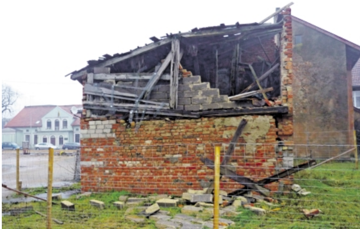
Išliko tik penktoji tvarto dalis, kurios savininkė ruošiasi ją rekonstruoti.