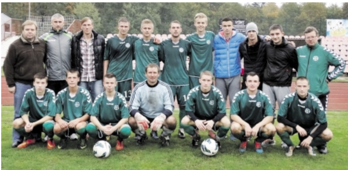
VšĮ „Šilutės sportas“ futbolo komanda viena pirmųjų Lietuvoje įgijo licenciją žaisti naujajame futbolo sezone.

Lietuvos futbolo federacijos (LFF) klubų licencijavimo procese baigėsi pirmasis įvertinimo ir sprendimų priėmimo etapas. Po pirmadienį vykusio LFF licencijavimo komiteto posėdžio A lygos licencijos suteiktos penkiems, I lygos licencijos – keturiems klubams. Likusieji per savaitę turės galimybę apeliuoti ir ištaisyti trūkumus.