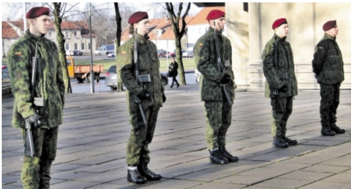
Šilutės kuopos savanoriai ginklu pagerbė 1923 metų Klaipėdos krašto sukilimo dalyvius.

Sausio 15-ąją, Klaipėdos krašto dieną, prie Šilutės r. savivaldybės pastato esančio 1923 metų Klaipėdos krašto sukilimo žyminio paminklo susirinkusieji be jau įprastai tą dieną pasirodančių Šilutės jaunųjų šaulių matė ir karius savanorius. Jie trimis šautuvų salvėmis pagerbė prieš 92 metus vykusius įvykius. Kariškai atrodančių savanorių dalyvavimas parodė, kad Šilutės žmonės nėra visai vieni vis labiau susipriešinančiame pasaulyje.