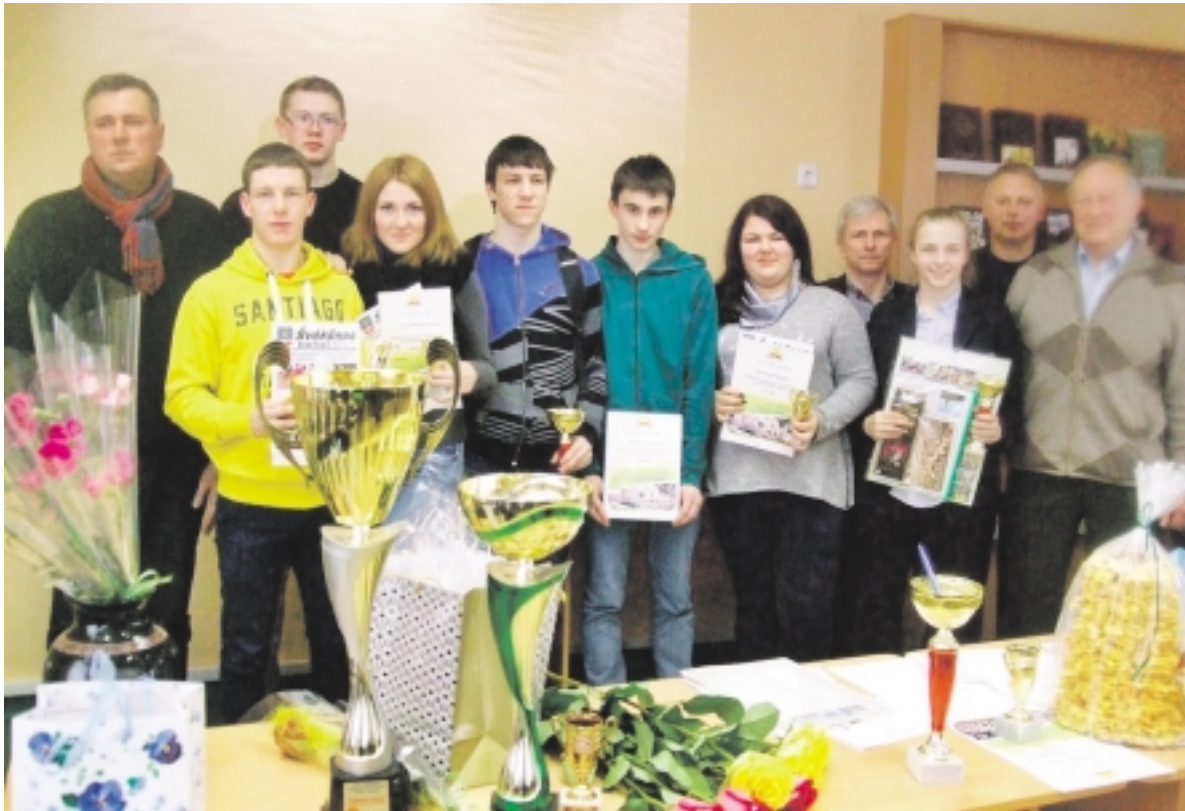
Penkiasdešimtą kartą Švėkšnoje apdovanoti geriausi seniūnijos sportininkai.