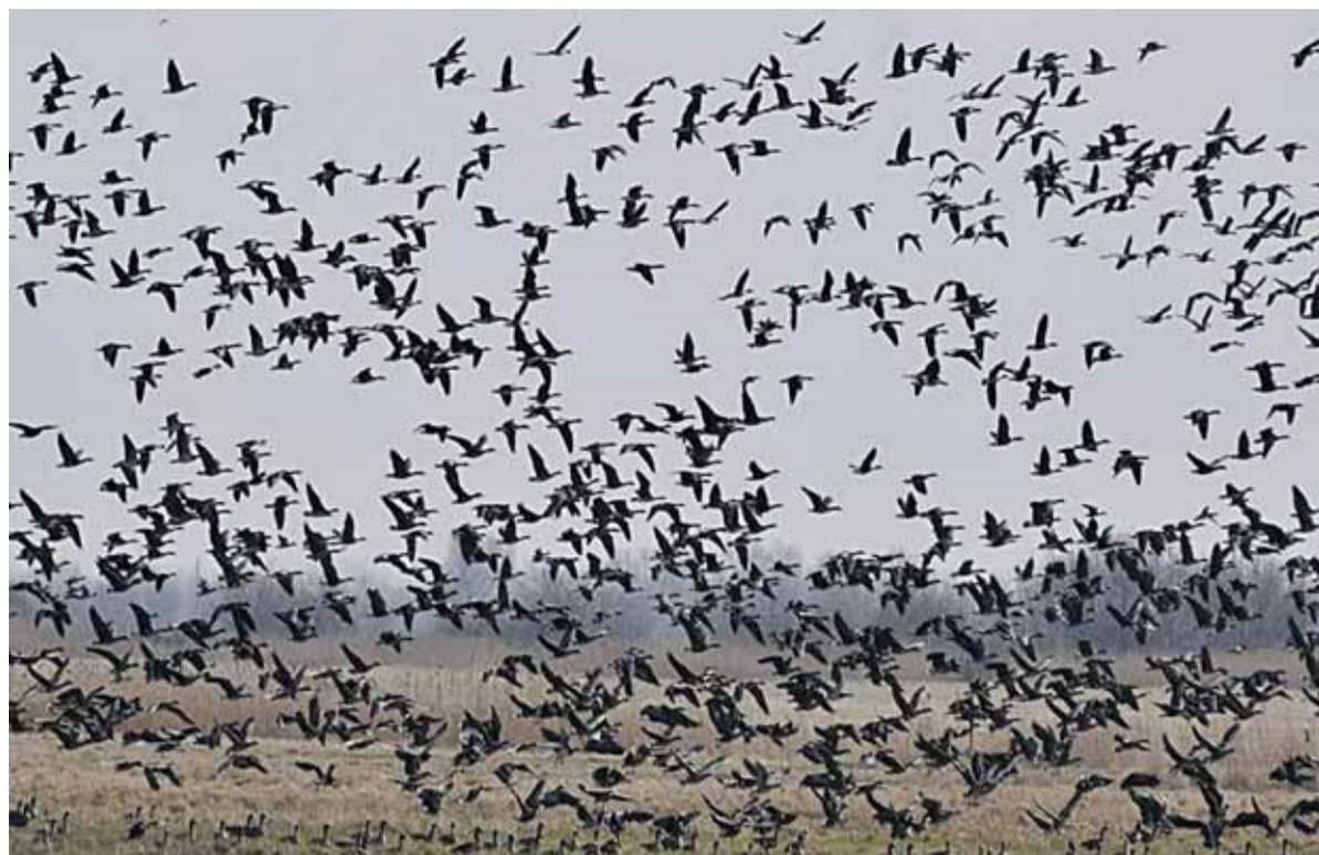
Ūkininkų ir ŽŪB „Agromanija“ laukus „apgulę“ žąsų.

didelę žalą. Pavyzdžiui, žieminiai rapsai ar žiemkenčiai atauga, tad pergyventi tikrai nėra dėl ko. Ūkininkai savo pasėlius turėtų būti apsidraudę, tad dar kartą patikinu, labai baimintis nereikėtų“, – teigė A. Klimavičius.