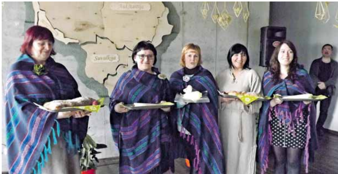
Kultūros centro darbuotojos siūlė paragauti visų penkių Lietuvos regionų valgių.