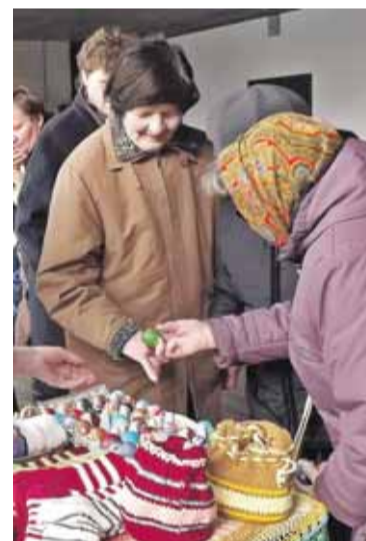
Jomarkedje buvo ne tik velykinių margučių, bet ir tautodailininkų įvairiausių rankdarbių.

Jomarkedje grojo linksma muzika, žmonės pirko kas ką tik norėjo. Pagėgiškiai spėjo mišles, juokavo ir t. t.