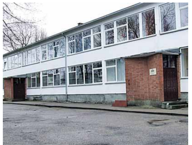
Šilutės lopšelyje-darželyje „Žibutė“ auklėtoja per prievartą, galimai smaugdama vaiką, bandė supilti jam į gerklę sriubą.