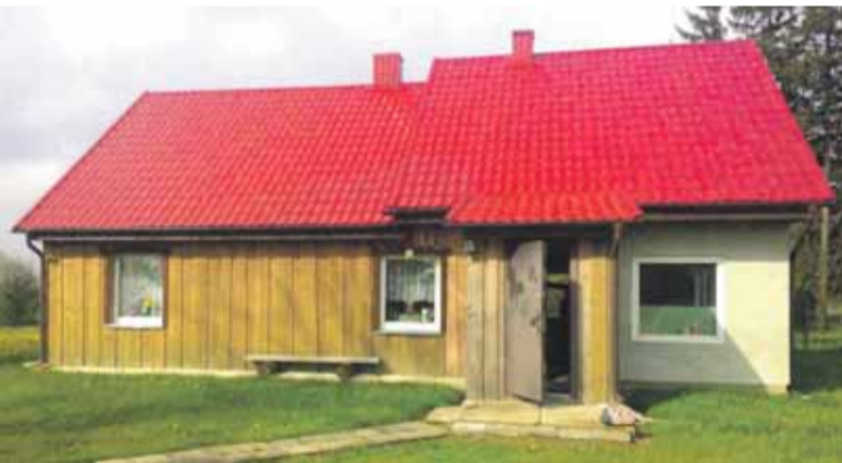
Dėl šio namo susipyko giminės.