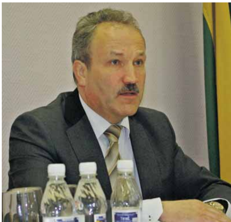
Trečiadienio spaudos konferencijoje naujas mero kostiumas buvo didesnė naujiena nei jo pasakytos mintys.

niasklaidai buvo svarbiau sužinoti ne tai, kas yra kaltas dėl politinių interpeliacijų bangos, o tai, kurios politinės jėgos šiandien valdo rajoną ir kokios idėjos bei vertybės šias jėgas vienija. Taip pat aktualus yra klausimas, ar tokios konfigūracijos dauguma išsilaikys iki pakartotinių rinkimų.