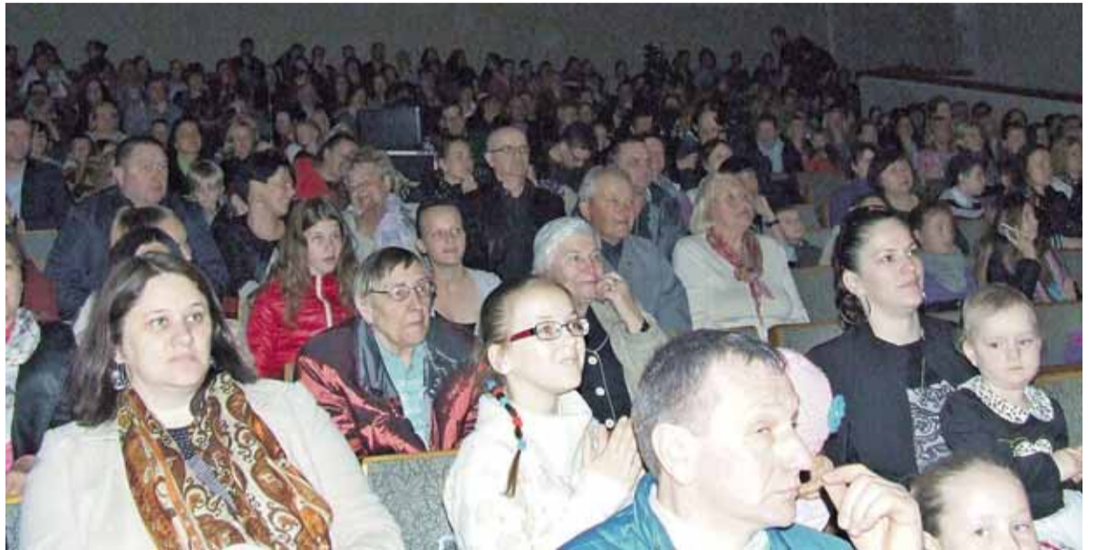
Mamos, močiutės ir net tėveliai rinkosi į Kultūros ir pramogų centrą pasiklausyti ir pažiūrėti, ką Mamos dienos proga paruošė jų vaikai.