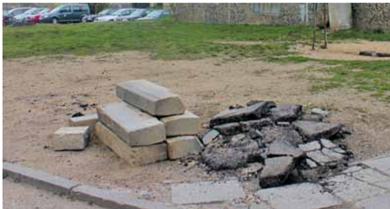
Nepavojingos atliekos statybvietėje gali būti ne ilgiau kaip vienerius metus nuo jų susidarymo dienos, tačiau ne ilgiau kaip iki statybos darbų pabaigos.