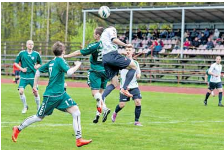
Išvykoje FK „Šilutė“ mače su „Kražante“ sužaidė lygiosiomis 2:2.