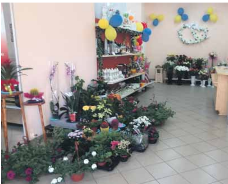
Gėlių salone „Kornemija“ – ryškiaspalvės gėlės, išskirtinės dovanėlės ir puikus aptarnavimas.

Darbas kirpykloje Šilutėje, reikalai Žemaičių Naumiestyje įkurtoje gėlių parduotuvėje „suvalgo“