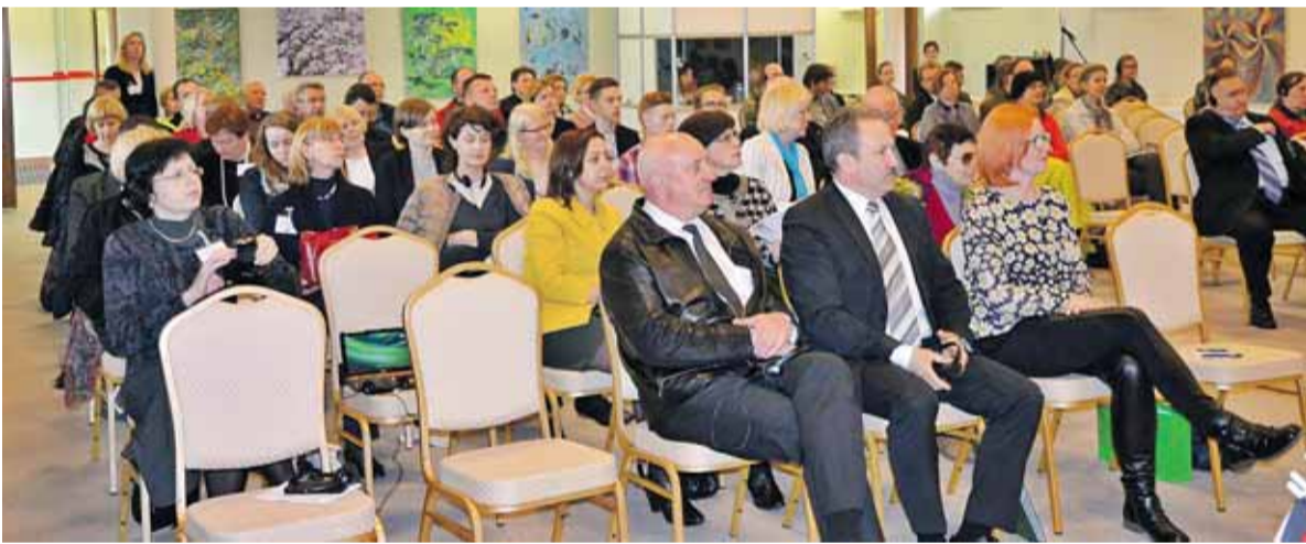
Šilutėje, H. Šojaus dvare rūmuose, dvi dienas vyko išskirtinė konferencija.

Susirinkusieji negailėstingų valdymo režimų aukas pagerbė tylos minute, kurios metu kaip niekad medžiuose išsismarkavo didžiulis vėjas, apgobdamas kiekvieną ten buvusį tarsi padėka už tai, kas daroma praecities įvykių atminimui.