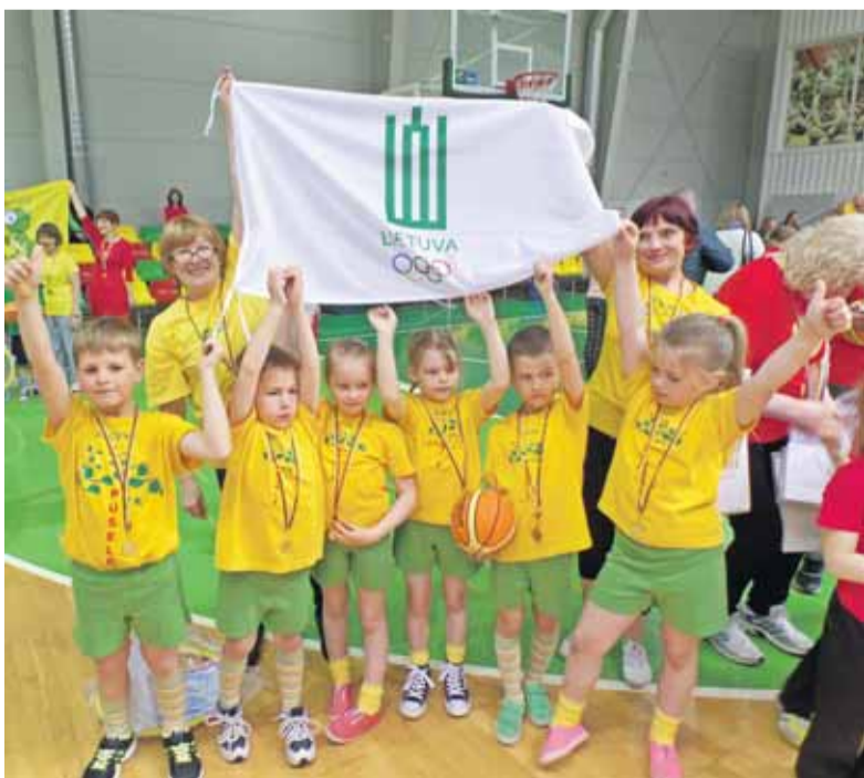
Mažieji lopšelio-darželio „Pušėlė“ vaikučiai respublikiniame festivalyje „Mažųjų olimpiada“.

Jau keletą metų iš eilės šiam projekte dalyvauja ir Šilutės miesto lopšeliai-darželiai „Raudonkepūraitė“ ir „Pušėlė“. Pirmajame šio festivalio etape varžėsi šių ikimokyklinių įstaigų vaikučiai, atlikdami įvairias kombinuotas estafetes. Nugalėtojai – „Pušėlės“ vikruoliai – buvo pakviesti gegužės 16 dieną į Kauną, Sabonio krepšinio centre vykusį finalinį festivalį, kur rinkosi dalyviai iš 24