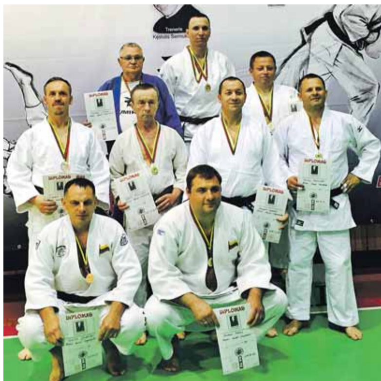
„Kumikata“ vyriausieji sportininkai – pavyzdys jaunimui. Jie turnyre iškovojo čempionų vardus.

Savaitgalį, gegužės 23 dieną, Plungėje vyko tarptautinis dziudo turnyras, skirtas treneriui K. Šermukšniui atminti. Čia susirinko gausus būrys sportininkų iš Latvijos ir Lietuvos miestų.