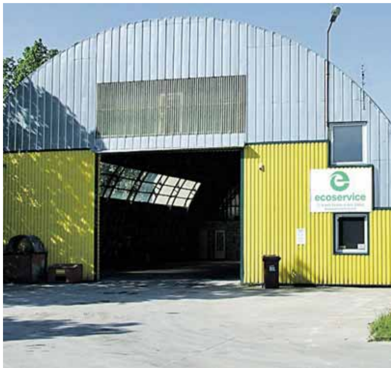
Į šią aikštelę šilutiškiai gali atvežti nebereikalingas stambiagabaritines atliekas.