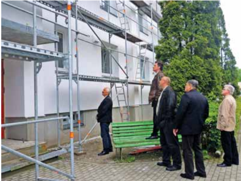
Programos įgyvendinimo priežiūros komiteto nariai apžiūrėjo renovuojamą Cintjoniškių g. 5a daugiabutį namą.

...Statistiniai duomenys liudija, kad Lietuvos mastu daugiabučių namų renovacija Šilutės rajone vyksta gerai.