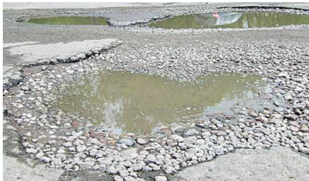
Štai per tokius kraterius kasdien važiuoja tiek nauji kitų miestų, tiek savi Šilutės autobusų parko autobusai.