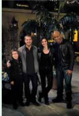
1.10 „Specialioji Los Andželo policija“. N-7. 2.05 Sveikatos ABC televizina. 2.40 Lietuva Tavo delne.