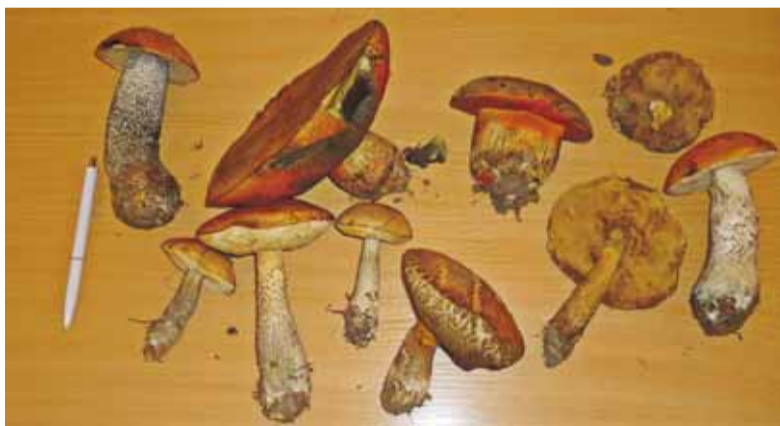
Miške prie Pagėgių jau dygsta raudonviršiai.

„Mes irgi esame labai nustebę, - „Šilokarčemai“ sakė seniūnas, - orai yra neprognozuojami – šiandien šalta, rytoj šilta – ir taip toliau. Ta gamta taip ir „blūdinėja“. Iš vienos pusės gerai, kad rudeniniai grybai dygsta pavasarį, iš kitos pusės – ne... O jeigu rudenį nebus grybų? Miškai Pagėgių savivaldybėje užima tik nedidelę jos teritorijos dalį, keletą kartų mažesnę nei vidutiniškai Lietuvoje. Miškus gali-