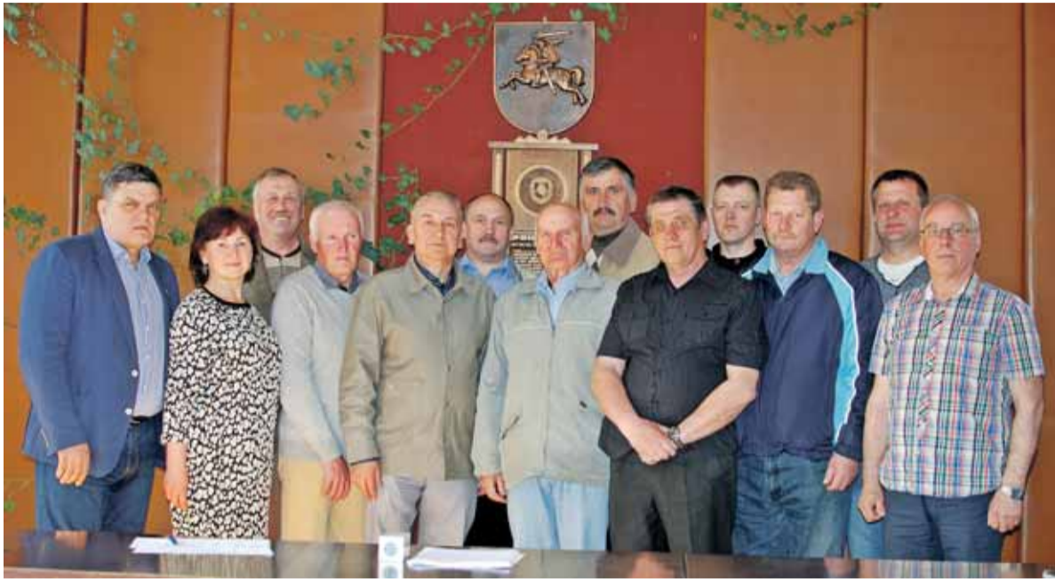
Policijos veteranai aptarė jiems aktualius klausimus.

Tauragės apskrities vyriausiojo policijos komisariato Šilutės rajono policijos komisariate vyko Lietuvos policijos veteranų asociacijos (LPVA) Šilutės filialo steigiamasis susirinkimas.