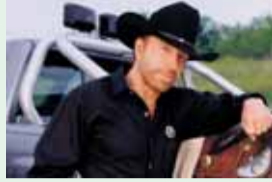
7.50 „Volkeris, Teksaso reindžeris“. N-7. 8.50 24 valandos. N-7. 11.10 Yra kaip yra. N-7. 12.15 Nuo...iki... 13.15 „Džonis Testas“. 13.45 „Ančiukai Duoniukai“. 14.10 „Bėgantis laikas“. N-7. 16.30 Labas vakaras, Lietuva. 17.15 24 valandos. N-7. 18.30 Žinios. 19.30 Tikras gyvenimas. 21.30 Žinios. 22.10 „Grėsminga žemė“. N-14. 0.15 „Visa menanti“. N-7.