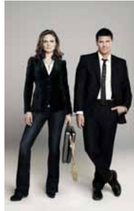
18.00 „Kaulai“. N-7. 19.00 „CSI Majamis“. N-7. 20.00 „Tėtušiai“. N-7. 21.00 „Naša Raša“. N-14. 21.30 „Savas žmogus“. Kriminalinė drama. N-14. 0.05 „Meilė ir krepšinis“. Romantinė komedija. N-7. 2.00 „CSI Majamis“. N-7.

15.00 Kovotojas nindzė. N-7. 16.00 Crisso Angelo iliuzijų pasaulis. N-7. 17.00 „Porininkai“. N-7. 18.00 „Kerštas“. N-7. 19.00 „Laukinis angelas“. N-7. 20.00 Labanakt, vaikučiai. 20.35 „Pamiršk mane“. N-7. 21.00 „Princesė ir liokajus“. Komedija. N-7. 22.55 „Kerštas“. N-7. 23.50 Pasikeisk! N-7.