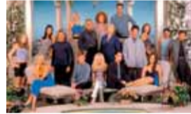
15.00 „Žavūs ir drašūs“. N-7. 16.00 Ekstremalūs namų pokyčiai. 17.00 Pasikeisk! N-7.

6 7.40 „Žavūs ir drašūs“. N-7. 8.05 „Žavūs ir drašūs“. N-7. 8.30 „Rutos Rendel detektyvai“. N-7. 9.30 „Linksmieji draugai“. 10.00 Senoji animacija. 10.40 „Gabalėlis dangaus“. N-7. 12.40 Ekstremalūs namų pokyčiai. 13.35 „Laukinis angelas“. N-7. 14.30 „Pamiršk mane“. Drama. N-7.