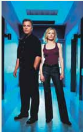
1.15 „CSI kriminalistai“. N-14. 2.10 „Gražuolė ir pabaisa“. N-7. 3.00 „Las Vegasas“. N-14.