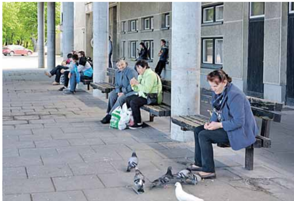
Didžiulė Šilutės autobusų stotis – apleista ir niekam nereikalinga.

Kur pažvelgsi, vien tik duobės, bilda ratai, kur dairais, ilgas pasakas vadovas seka miestelėnams ištisai.... Tik šių šmaikščių aforizmų pagalba ir tegalime apibūdinti apverktiną Šilutės autobusų stoties būklę. Sovietmečiu dvelkianti atmosfera autobusų stoties laukimo salėje: senos, kažkada oda aptrauktos kėdės, nuo pat stoties pastatymo nepakitęs sienų ir grindų dekoras, ore tvyro šlapimo dvokas, matosi kažkada buvusios užkandinės likučiai. Laukimo salėje sėdėjusios moterys, pamačiusios „Šilokarčemos“ korespondentę, nudžiugo. „Kaip tik sėdėdamos stotyje ir laukdamos autobuso kalbėjomės apie stoties pastato būklę. Čia būtų juokinga, jei nebūtų gaudu. Dabar – pietų metas. Ką daryti žmogui, užsimaniusiam į tualetą? Eiti į krūmus, nes darbuotoja pietauja”, - ironizavo moterys.