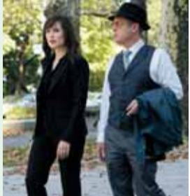
0.05 „Juodasis sąrašas“. N-7. 1.00 „Prokurorų patikrinimas“. N-7. 2.05 Bamba TV. S.

15.00 Kovotojas nindzė. N-7. 16.00 Crisso Angelo iliuzijų pasaulis. N-7. 17.00 „Porininkai“. N-7. 18.00 „Kerštas“. N-7. 19.00 „Laukinis angelas“. N-7. 20.00 Labanakt, vaikučiai. 20.35 „Pamiršk mane“. N-7. 21.00 „Princesė ir liokajus“. Komedija. N-7. 22.55 „Kerštas“. N-7. 23.50 Pasikeisk! N-7.