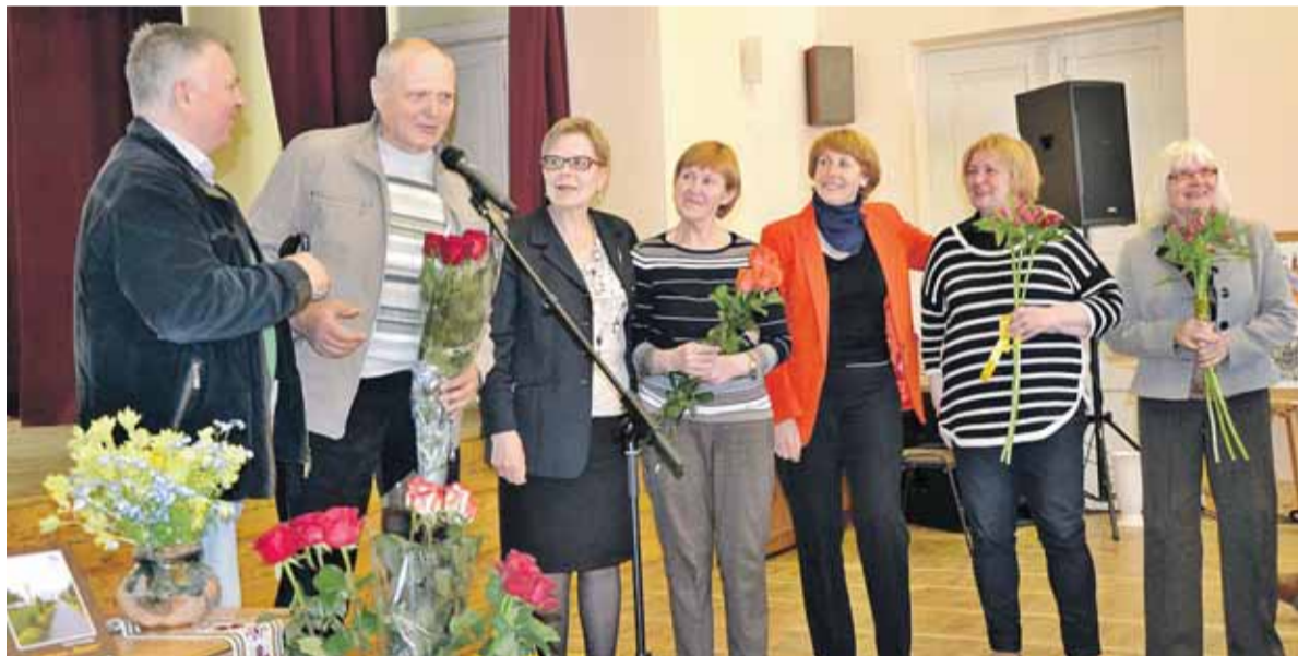
Naujosios knygos apie Švėkšną sutiktuvių akimirka.