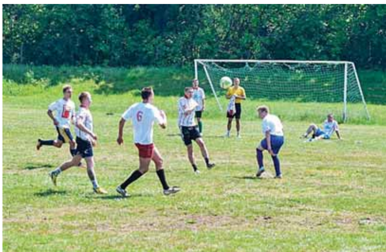
Futbolo rungties dalyviai.

Šviesų ir ankstyvą šeštadienio rytą Šilutės tinklinio, stalo teniso, šaškių, šachmatų, krepšinio ir futbolo aikštelėse vyko varžybos. Iš viso rungėsi 9 seniūnijos (iš 11).