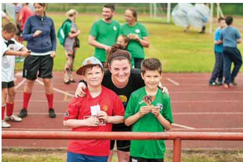
Šeimų futbolo turnyro dalyviai.

Zorbas arba Zorbing – tai pramoga arba sportas, kurį sukūrė Naujojoje Zelandijoje ir kuris prigijo visame pasaulyje. Zorbas – tai neįtikėtino dydžio pripūstas gumi-