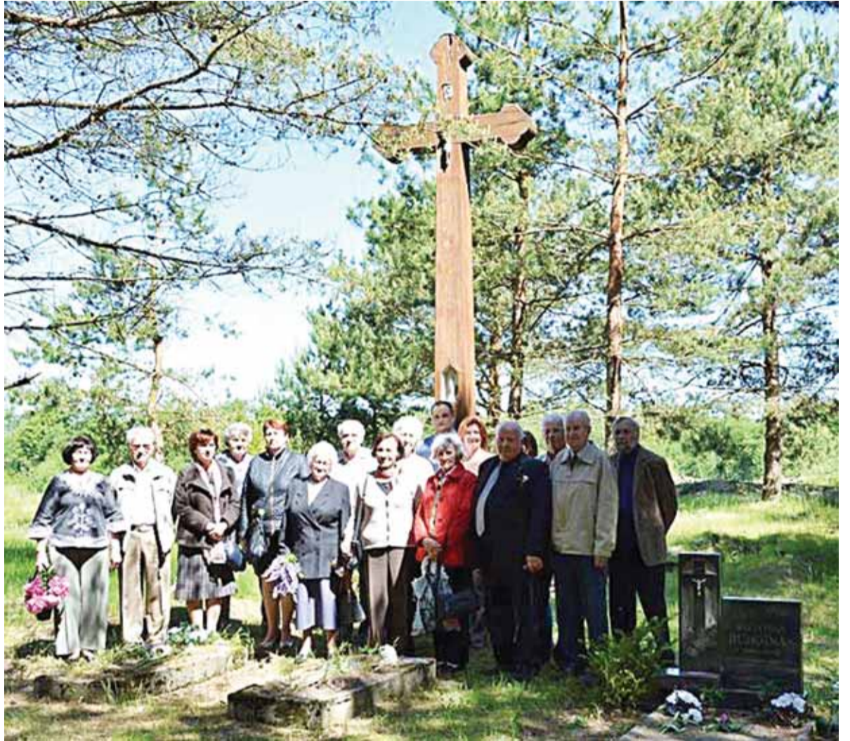
Birželio 12 dieną Macikų lagerio kapinaitėse, prie kryžiaus žuvusiems atminti, buvo pagerbti mūsų tautiečiai, žuvę buvusioje koncentracijos stovykloje.

Šioje stovykloje 1948–1955 metais žuvo, mirė 365 kaliniai. Iš jų net 312 lietuvių, 70 vaikų, iš ku-