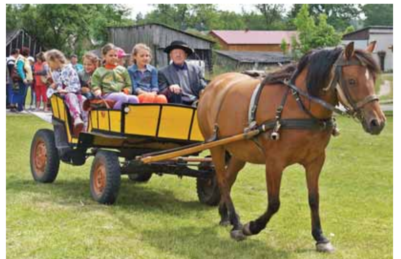
Liaudies amatų stovyklos akimirkos.