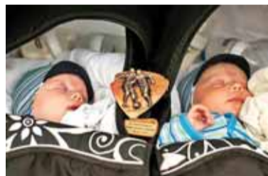
Jauniausi, bet jau šauniauši, šeimų turnyro dalyviai.

Vienvaldžiai A grupės lyderiai – komanda iš Klaipėdos „Gimė nuošalėje“ – nepatyrę nė vieno pralaimėjimo į finalinę kovą stojo labai ryžtingai sutikdami B grupės lyderius „Sniegelį“. Pirmąjį kėlinį 1:0 laimėjęs „Sniegelis“ toliau mėgino laikytis gynybinės taktikos, bet „Gimė nuošalėje“ antrojo kėlinio pradžioje išlygino rezultatą (1:1). Tikslint paskutiniajai antrojo kėli-