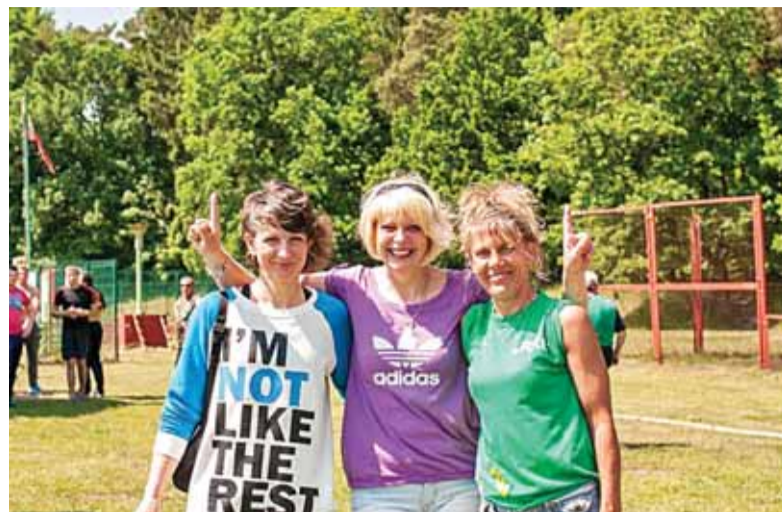
Krepšinio rungties nugalėtojos – Šilutės merginos.

nas Budreckas. Šiais metais sporto žaidynių rajone organizatorius VšĮ „Šilutės sportas“ į Šilutės rajono seniūnijų sporto žaidynių programą įtraukė 9 varžybas: stalo tenisą, krepšinį 3x3, parko tinklinį 3x3,