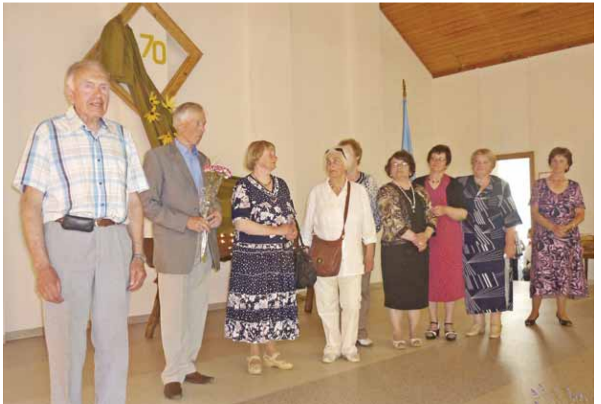
Scenoje - pirmųjų dešimties abiturientų laidų atstovai, dalyvavę mokyklos 70-ies metų jubiliejaus šventėje.

Padėkomis buvo apdovanoti šventės rėmėjai, tarp kurių daugiausia – Stoniškių krašto ūkininkai. Padėka įteikta ir informacinio rėmėjo „Šilokarčemos“ laikraščio atstovui. Šventei baigiantis pasodintas atminimo ažuoliukas, o buvę mokiniai ir jų mokytojai dar ilgai su bendraklasiais bendravo Stoniškių pagrindinėje mokykloje.