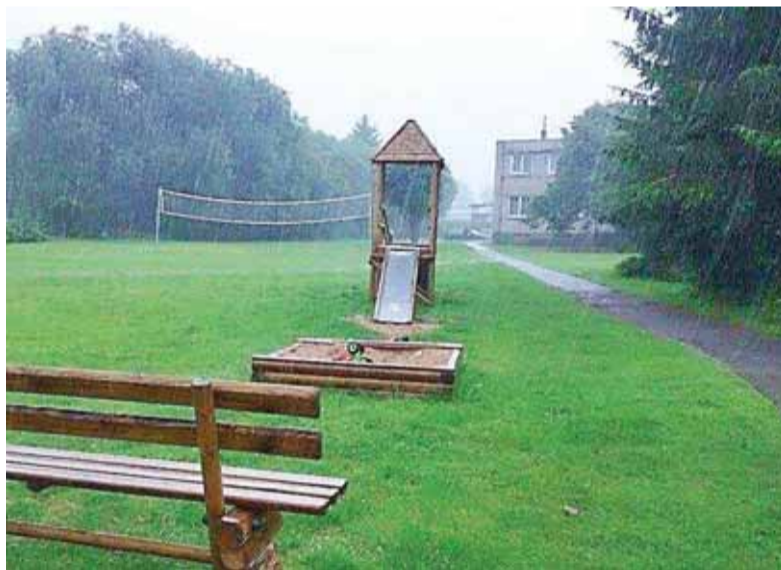
Miestelyje yra įrengta žaidimo aikštelė, kurioje gali žaisti kiekvienas mažasis gardamiškis

Į „Šilokarčemą“ šį kartą kreipėsi gardamiškė. Anot moters, šiame miestelyje visiškai nėra rūpinamasi mažaisiais gardamiškiais. Pabandėme rasti atsakymą į šį klausimą - rūpinamasi tais mažaisiais vaikais Gardamo bendruomenėje, ar ne?