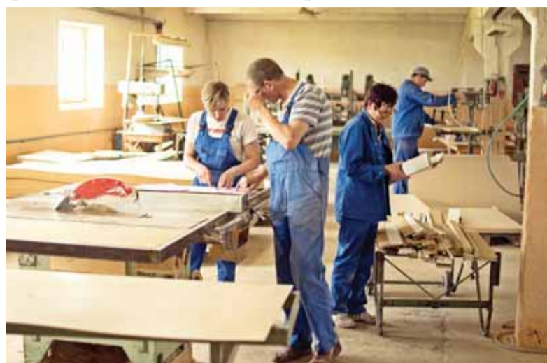
UAB „Ileda“ medžio apdirbimo cechas.