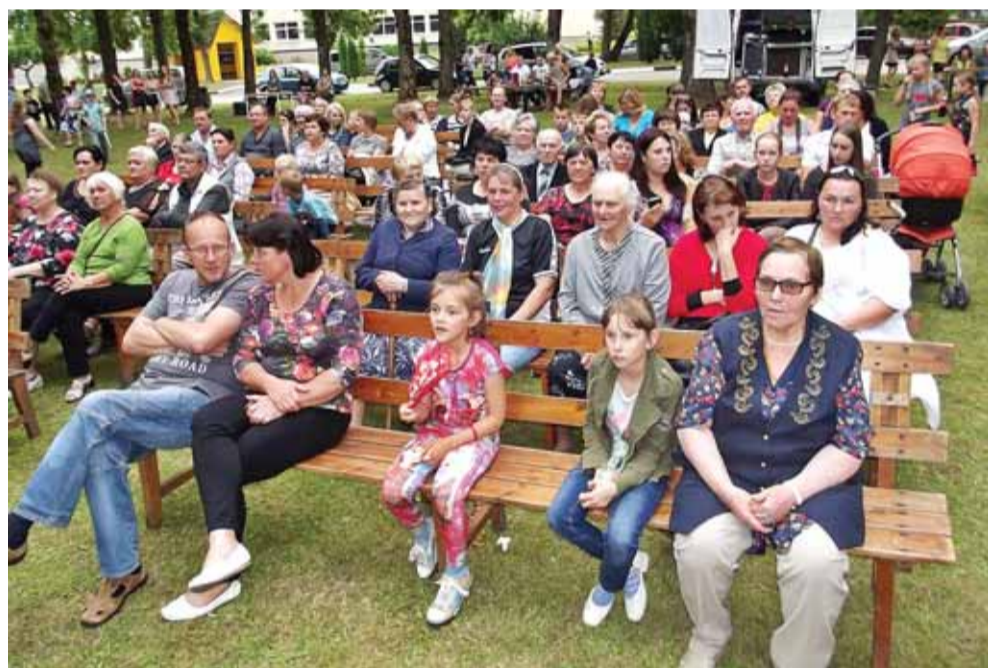
Į šventę suėjo, suvažiavo daug Natkiškių seniūnijos gyventojų.