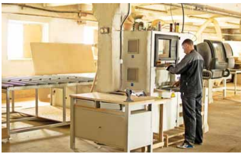
UAB „Ileda“ daug investuoja į įrangos tobulinimą. CNC medžio apdirbimo centras veikia per Windows operacinę sistemą.

Šiuo metu UAB „Ileda“ vienoje pamainoje dirbuoja 33 žmonių komanda. O štai darbo grafikas išties