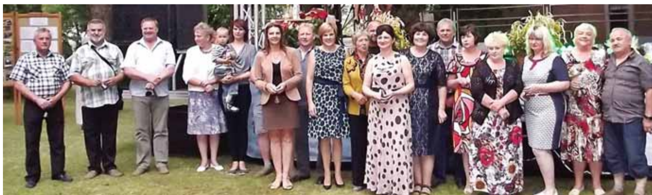
Padėkota Natkiškių seniūnijos šventės rėmėjams.