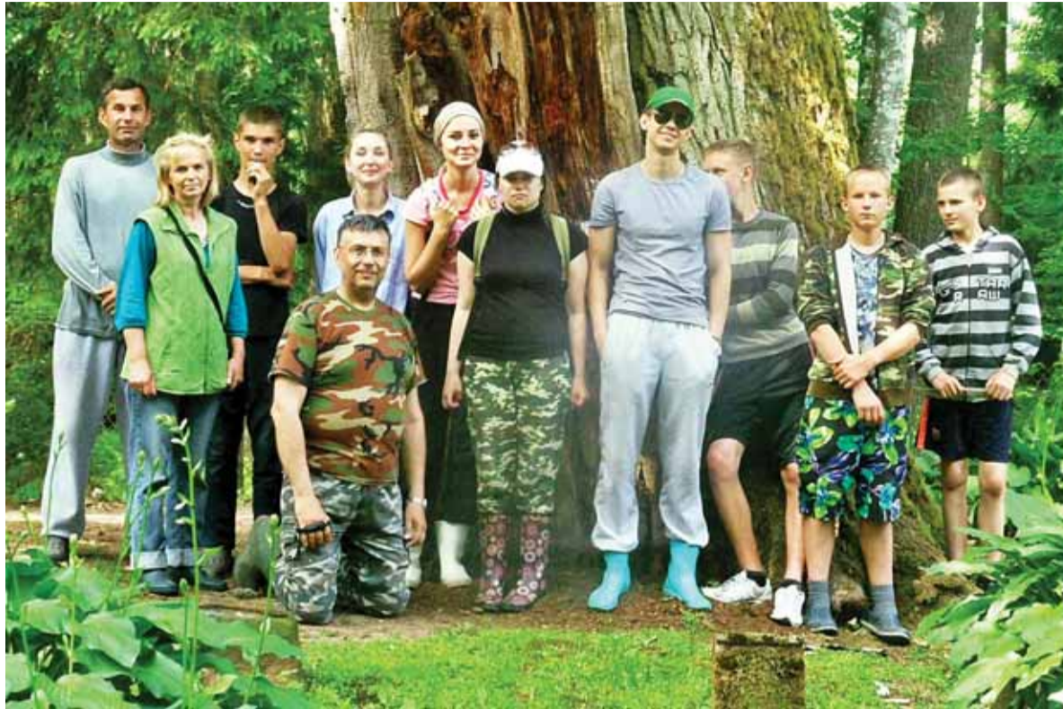
Akimirka iš ekspedicijos, vykusios Kavolių kapinaitėse.