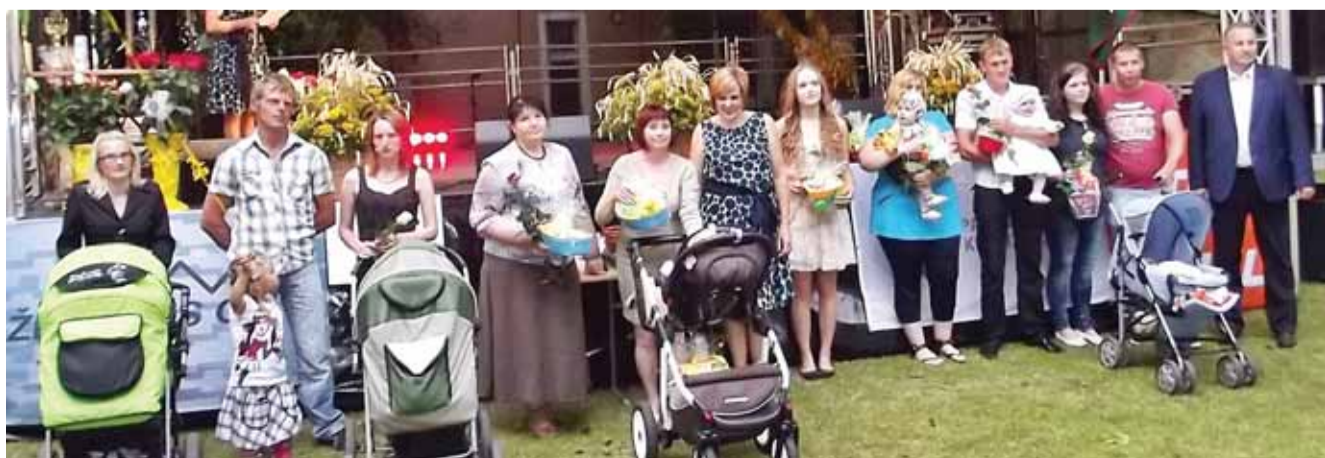
Buvo pasveikinti tėveliai, į kurių šeimas gandrai atnešė naujagimius.