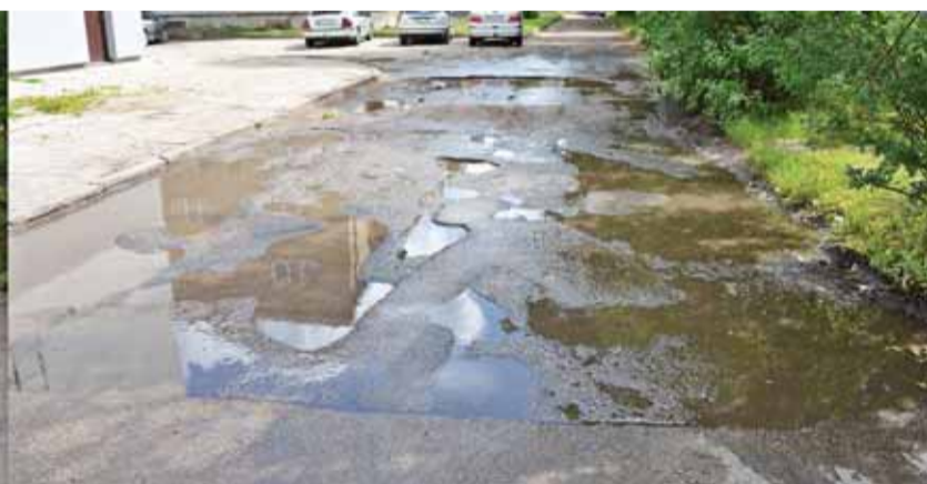
Situacija nuo liepos 9-osios Taikos g. 10 namo kieme nepasikeitė. Stipriau palijus kieme telkšo didžiulės balos.