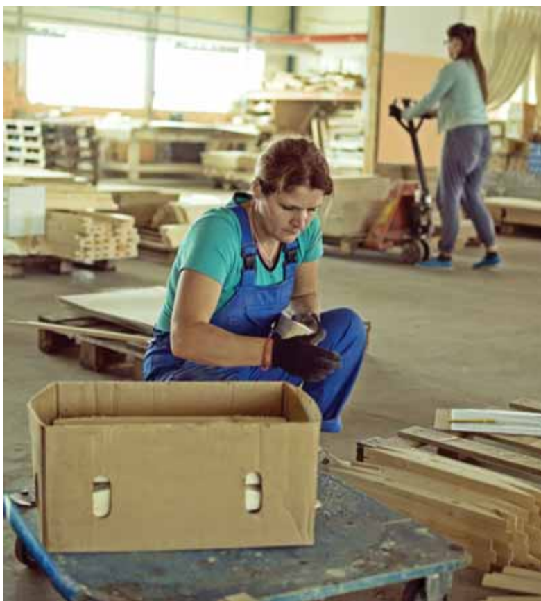
Pakavimo skyriuje darbuotojos kruopščiai atlieka savo darbą.