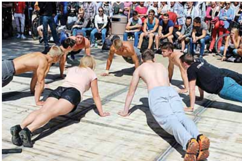
Lietuvos ekstremalaus sporto entuziastai Palangoje.

Liepos 11 dieną Palangoje vyko jaunimo ilgai lauktos ekstremalaus sporto varžybos. Savo jėgas panoro išbandyti ir į kurortą atvyko ne tik Lietuvos ekstremalaus sporto mėgėjai, bet ir aukšto meistriškumo atletai iš užsienio. Džiugina ir tai, kad čempionate dalyvavo ir šilutiškiai, grupės „Quatro“ gatvės gimnastai.