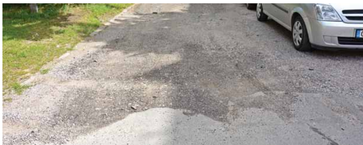
Taikos gatvėje kol kas sutvarkytas tik 8-ojo daugiabučio įvažiavimas.