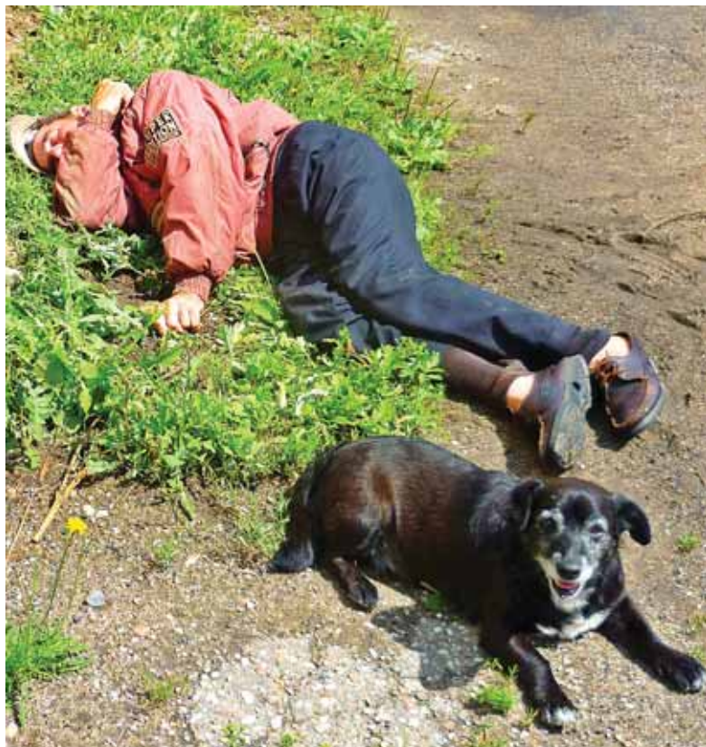
Taip vidury baltos dienos viename Pagėgių krašto kieme keturkojis draugas neseniai saugojo „pavargusį“ savo šeimininką...

Pagėgiškiai pasakojo, kad šitą 59 metų vyrškį iš kažkur buvo parsivežę čigonai, pas kuriuos jis dirbo įvairius darbus. Paskui pastarasis