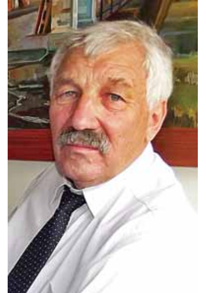
A. Balčyčio santaupos siekia kiek daugiau nei 700 tūkst. Lt.