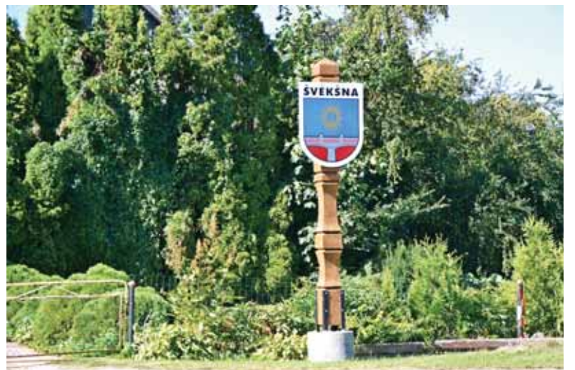
Beveik 3 m aukščio informaciniais stendais papuošti trys įvažiavimai į Švėkšną.

Informaciniai stendai – tai medinė kolona, kurią nemokamai padarė švėkšniškis Vytautas Bliū-