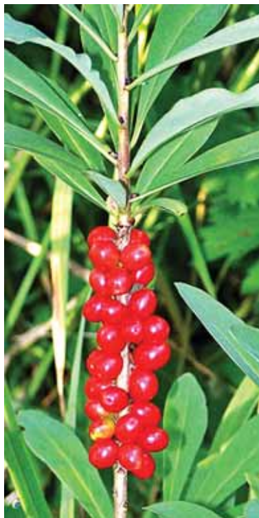
Ypač nuodingi žalčialunkio vaisiai – 7 ar 9 uogos yra mirtina dozė.