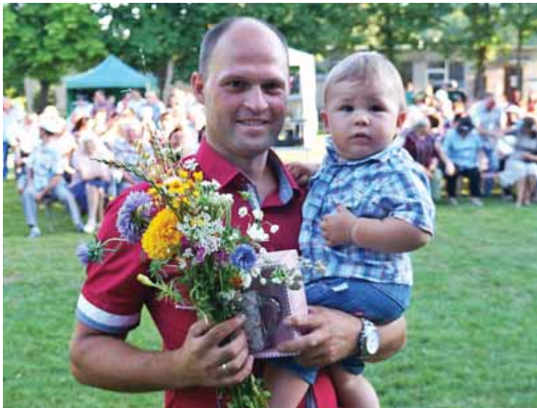
Tradiciškai šventės metu apdovanojami Roko vardo savininkai. Šiame gėlės įteiktos mažajam Rokučiui, kuris apdovanojimą atsiėmė kartu su tečiu.