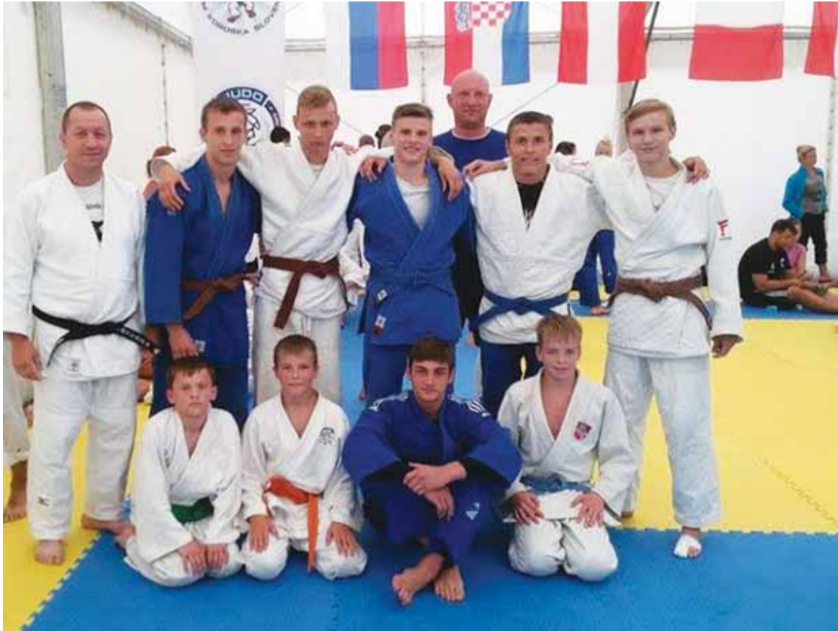
„Kumikata“ sportininkai mokomojoje treniruočiu stovykloje Kroatijoje su treneriu.