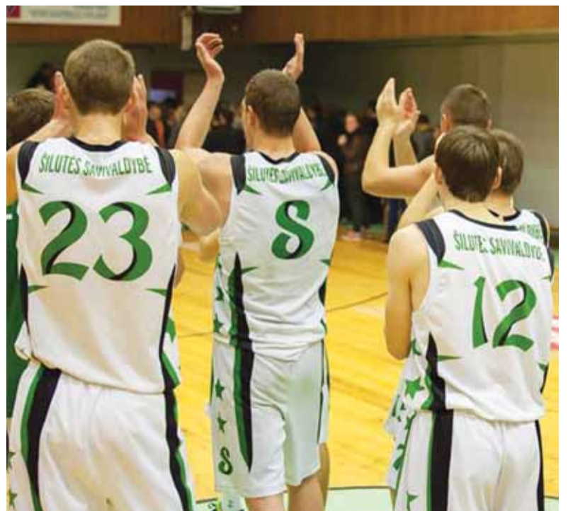
Krepšinio komanda „Šilutė“ drauge su dar 14 komandų, startą su oranžiniu kamuoliu aikštėje pradės spalio 1 dieną.

Nesužaistos liko trejos rungtynės. Didžiausio žiūrovų dėmesio tikimasi I lygos debutanto „Panevėžio“ ir „Šilutės“ akistatoje, kuri vyks rugsėjo 2 dieną. LFF II lygos pietų zonos lyderiai „Druskininkai“ priims patyrusią „Gariūnų“ ekipą. Šiomet į tolimiausią išvyką besileisiantis „Visaginas“ tikisi laimėti pajūryje – Klaipėdos jų lauks vietos „Koralas“.