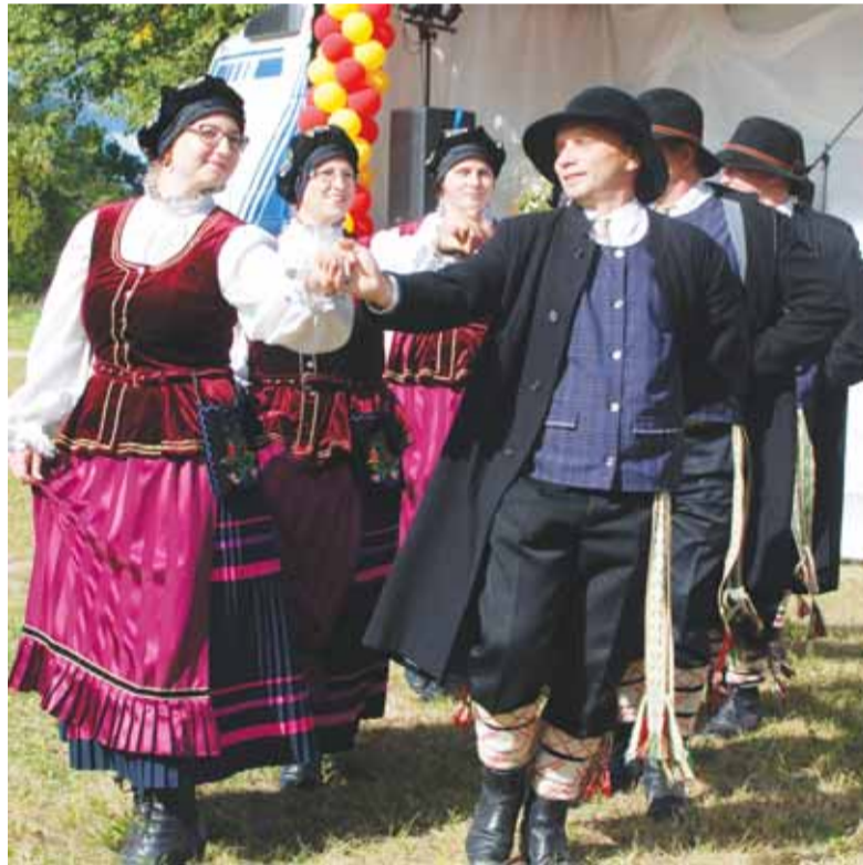
Savo šokius susirinkusiesiems dovanavo Vilkyčių kaimo šokių kolektyvas „Veiviržas“.