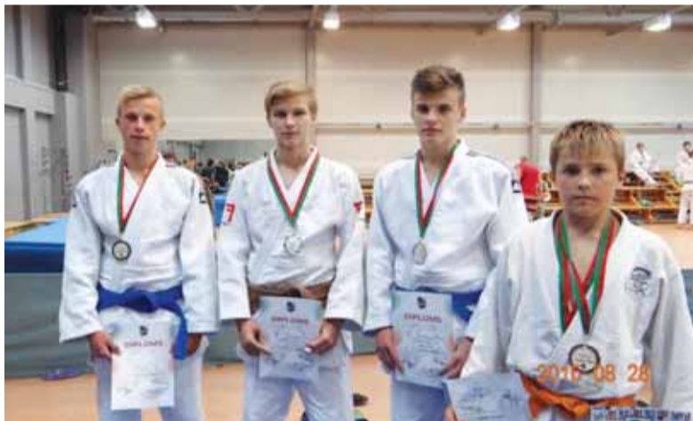
Jaunieji tatamio meistrai iš Šilutės iškovojo kelias prizines vietas turnyre Latvijoje.

Grįžę iš Kroatijos sportininkai išvyko į kaimyninę Latviją. Rugpjūčio 28 dieną Liepojoje vy-