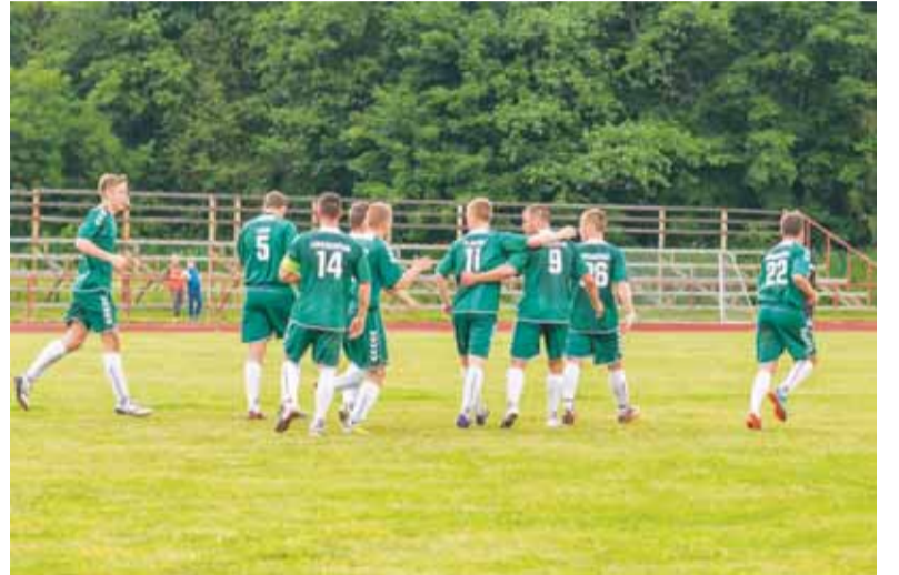
Rugsėjo 2 dieną laukia intriguojantis susitikimas tarp debutantės „Panevėžio“ ekipos ir „Šilutės“ vienuolikės.

Laukiama „Panevėžio“ ir „Šilutės“ akistatos