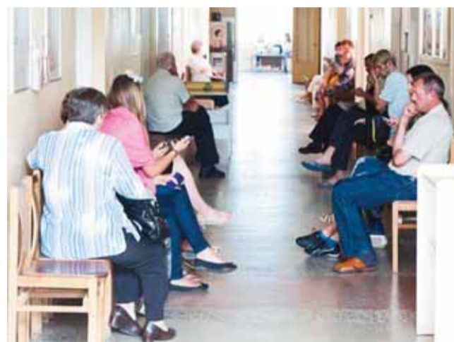
Asociatyvi sekunde.lt nuotrauka

Į mus kreipėsi UAB Šilutės medicinos centro „Puriena“ pacientė, nusivylusi centro darbuotojų elgesiu ir teikiamomis paslaugomis. Kas atsitiko?