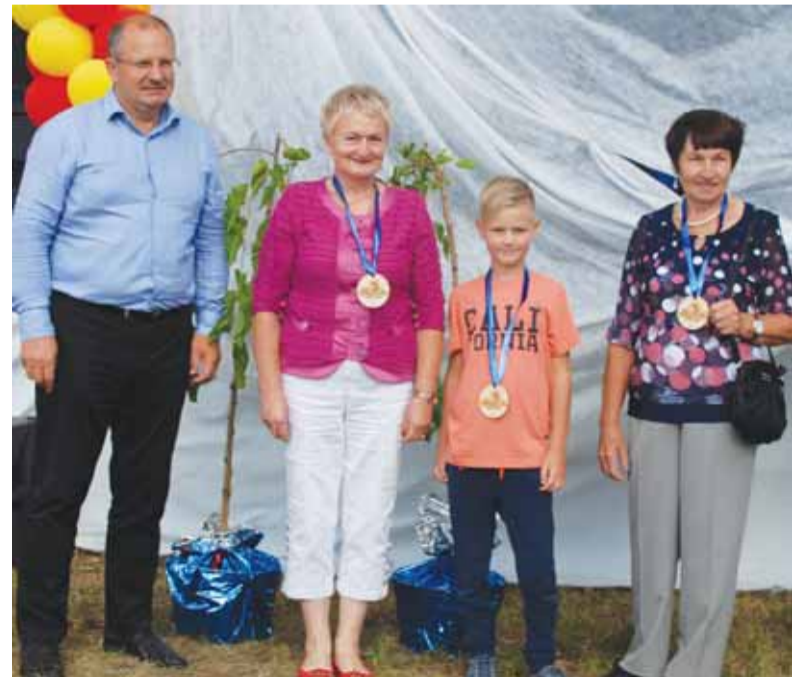
Dėmesys skirtas ir gražiausių sodybų šeimininkams.