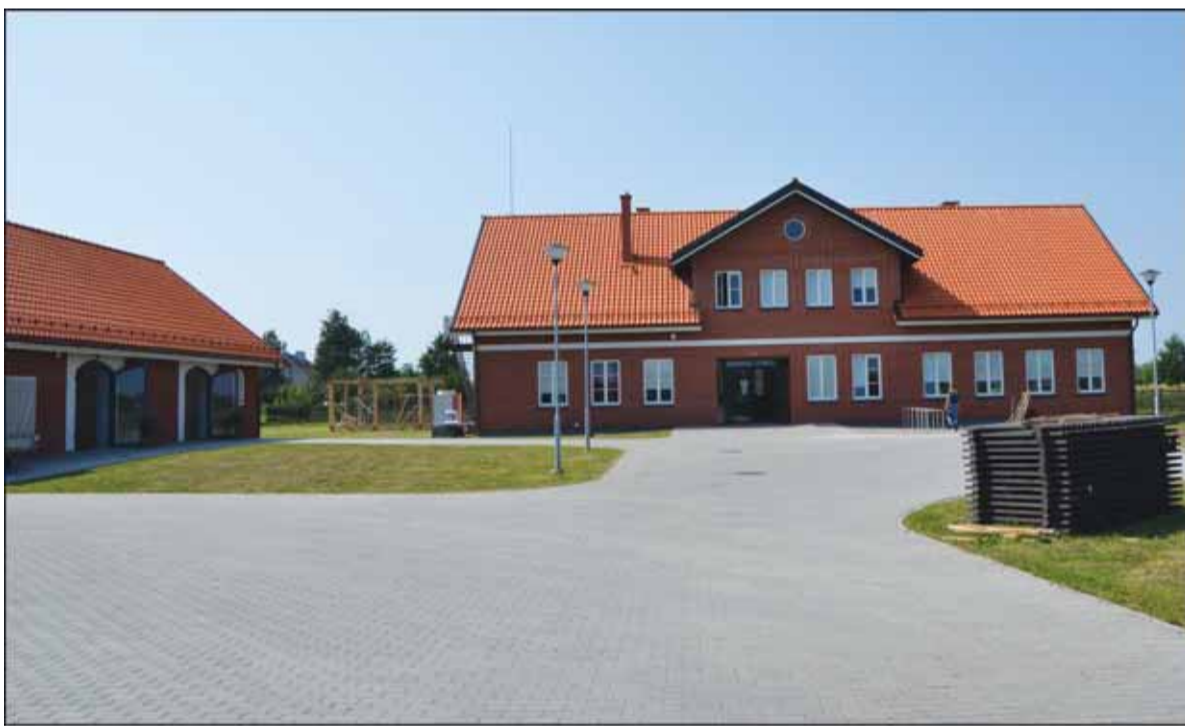
Jau šį mėnesį duris atvers naujas lankytojų centras.

kupė“, - kalbėjo V. Pavilionis. Projektui įgyvendinti skirti 2,5 mln. Lt. Erdvioje teritorijoje pastatytas dviejų aukštų lankytojų centras. Pirmajame pastato aukšte bus įkurtos ekspozicijos. Šiuo metu atliekami paskutinieji suderinimo darbai. „Jau turime viziją, kaip ekspozicija turėtų atrodyti. Lankiausi Danijoje, Vokietijoje, Austrijoje esančiuose tokiuose centruose. Pamačiau juos ir supratau, ko neturėtų būti pas mus. Mūsų centre turėtų būti daugiau interaktyvių lentų, kad žmonės nesivargintų skaitydami pateiktą begalę informacijos. Lankytojai turėtų pamatyti, galėti paliesti ir pajusti. Tikiuosi, kad tokias vizijas pavyks įgyvendinti“, - planais dalijosi Nemuno deltos