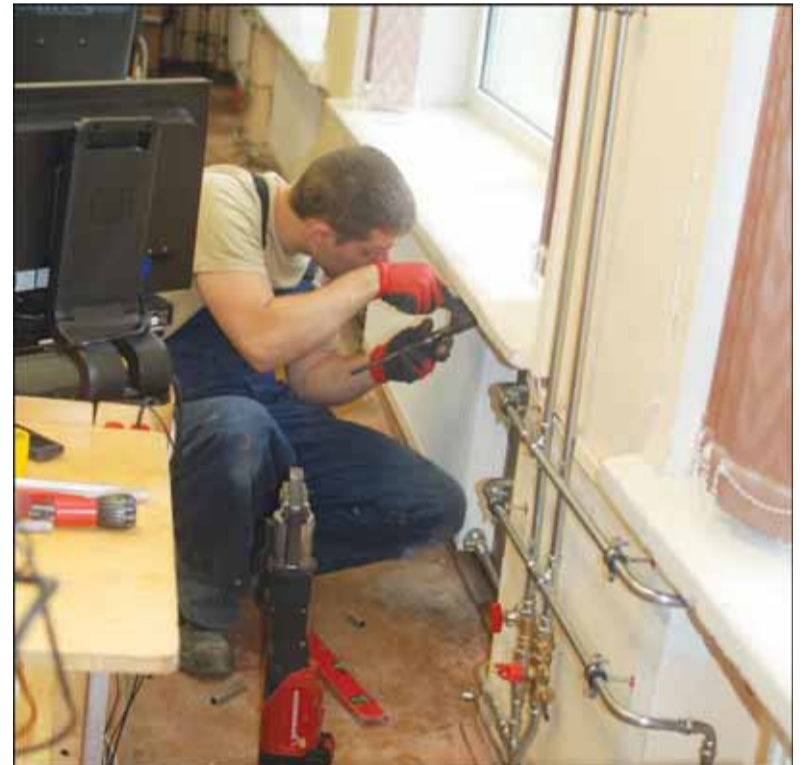
Statybininkai žada darbus baigti dar šiais metais.

Dabar planuojama, kad statybininkai gimnazijos pastatą paliks iki gruodžio 1 dienos, bent taip pastarieji žada vainutiškiams. „Džiugu, mūsų mokykloje visų supratinumas labai didelis. Nė vieno nebuvo besiskundžiančio, priešingai