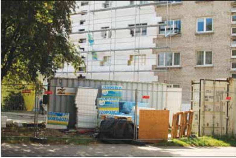
Laisvės alėjos 4 name dar nepadaryti santehnikos darbai.

Lygiai prieš mėnesį Panevėžio apygardos teisme priimtas pareiškimas iškelti bankroto bylą UAB „Šilo statyba“, kuri ne vieną daugiabutį renovavo ir mūsų mieste. Tą pačią dieną Bankroto departamentas paskelbė bankroto administratoriaus atranką, o teismas įmonei pritaikė taip laikinąsias apsaugos priemones.