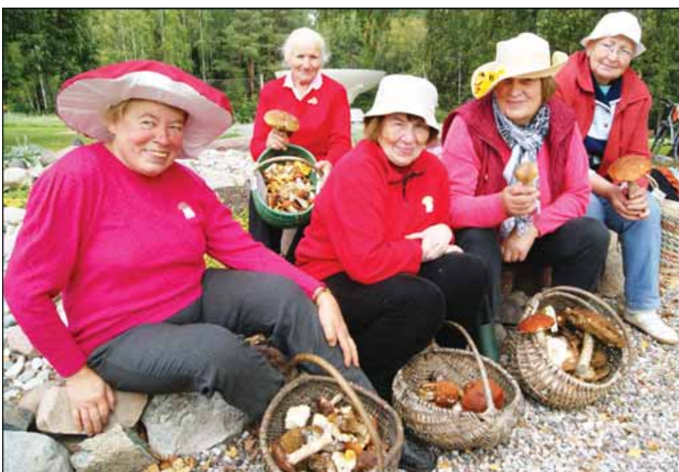
Čempionatą ir Rudens taurę laimėjo komanda „Makavykai“.

Nors grybų gausa šį sezoną labiausiai džiugino vasaros viduryje, šiuo metu šių gamtos turtų miškan išsiruošia tik užkietėję grybautojai. Nesuklysimė, kad tokie grybautojai šį šeštadienį rinkosi Švėkšnos seniūnijoje Papjaunių kaime, kur vyko ketvirtasis Grybavimo čempionatas. Jo metu rastas neįtikėtinas skaičius grybų.