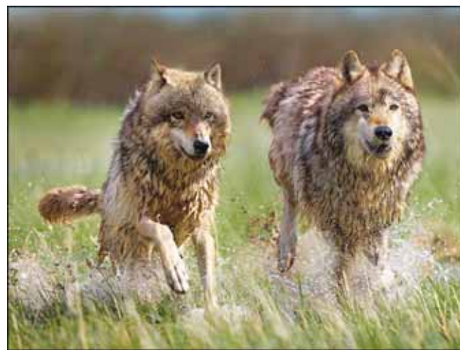
Miško sanitaro gyvenamasis arealas – apie 50 kvadratinų kilometrų.

Paleičių kaimo (Juknaičių sen.) gyventojai jau bijo dėl savo auginamų gyvulių saugumo – jie neva matė didžiules vilkų bandas. Sanitarais vadinami žvėrys jau darbavosi Užlieknių ir Paleičių kaimų ūkininkų bandose. Žmonės nuo plėšrūnų ginasi ir parako kvapu, ir saulės energija pasikraunančiomis lempomis. Aišku tai, kad jų šios priemonės neatbaido. Vilkų šiemet daugiau nei įprastai.