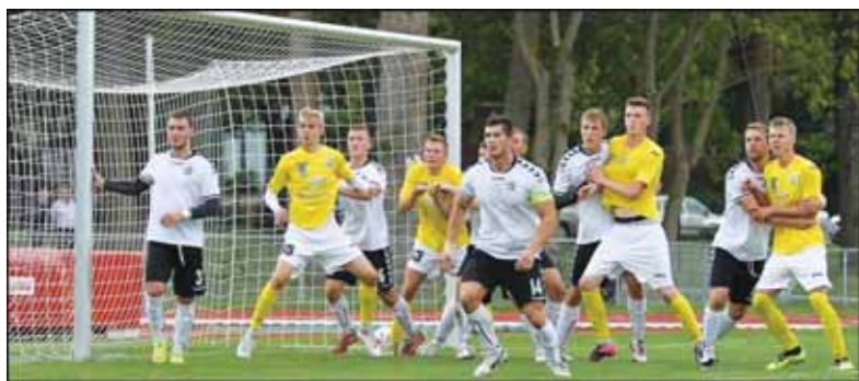
„Palangos“ bandymas pelnyti įvartį prie „Šilutės“ vartų.

S ekmadienį atkakliame mače FK „Šilutė“ legionieriaus M. Lukaševičiaus įvartis lėmė pergalę. LFF pirmos lygos dvidešimt septintojo turo „Palangos“ ir „Šilutės“ susitikime pergalę rezultatu – 1:0 (1:0) – šventė šilutiškiai. Primename, kad pirmąjį sezono susitikimą ekipos baigė lygiosiomis – 1:1.