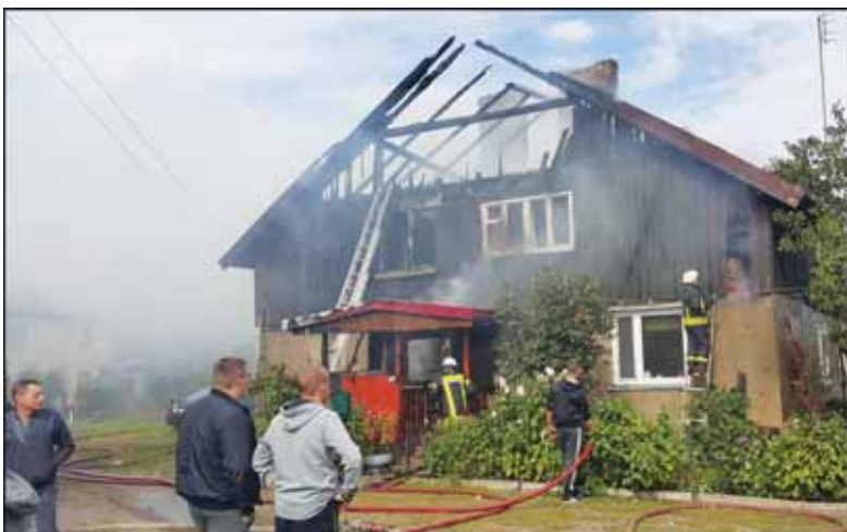
Šeštadienį, prieš vidurdienį, didelis gaisras įsiplieskė netoli Pagėgių - Rukų kaime, Saulėlydžio gatvėje. globos namuose.