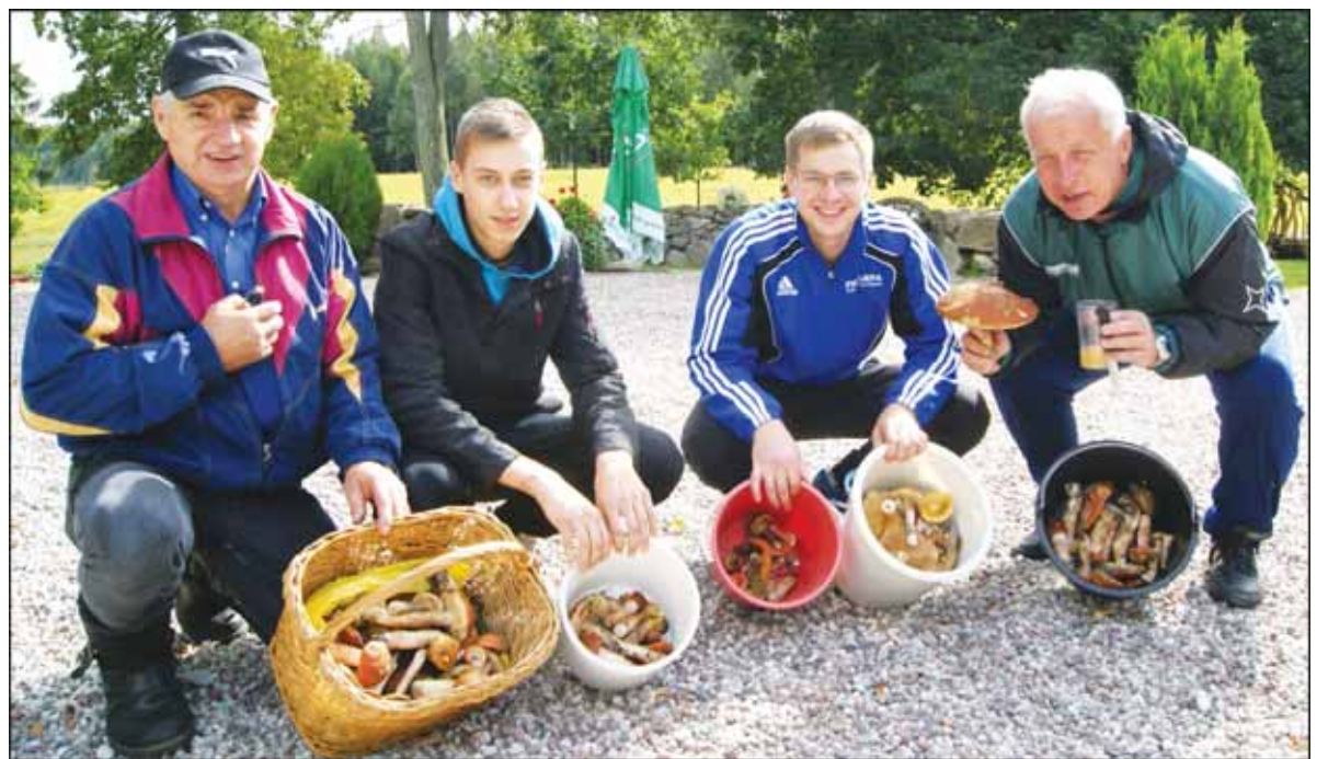
Komandos „Stasys ir kiti“ nariai pelnė ne vieną apdovanojimą.