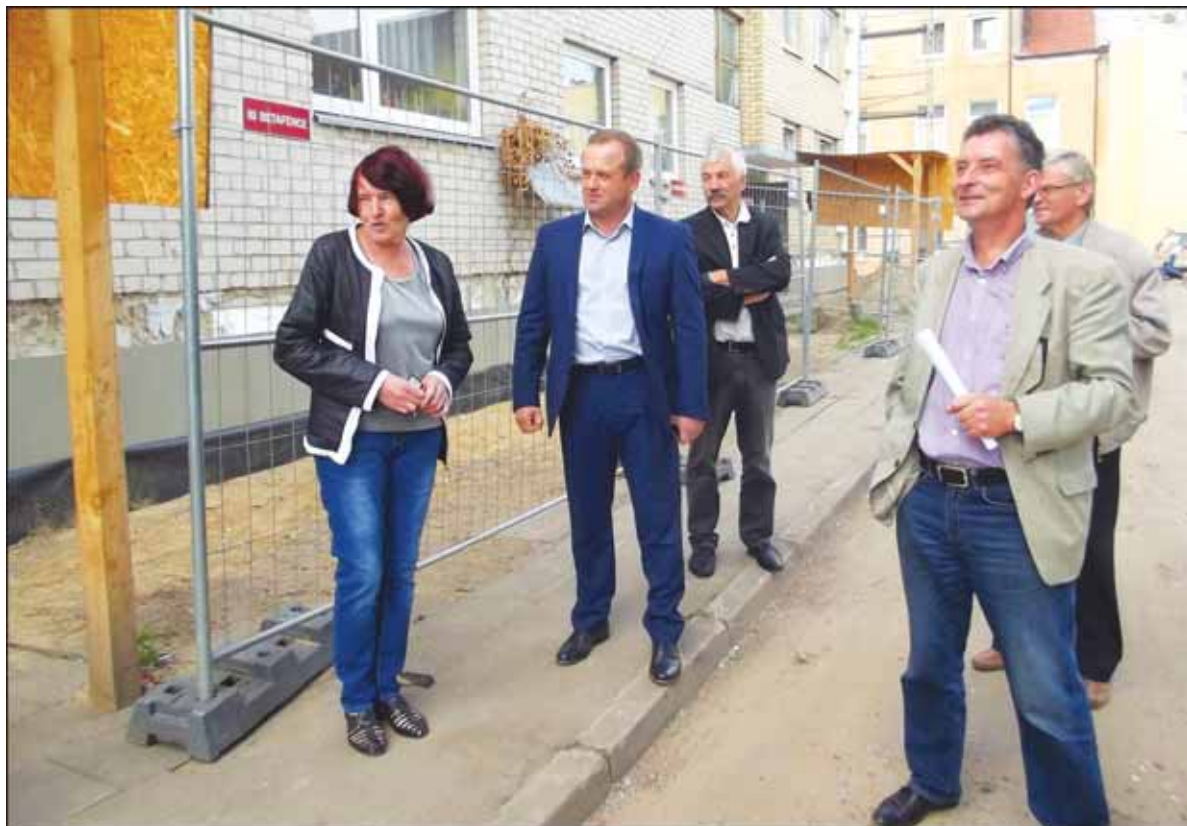
Sutvarkyti aplinką nenumatyta ir prie Žalgirio gatvės 3-iojo namo.