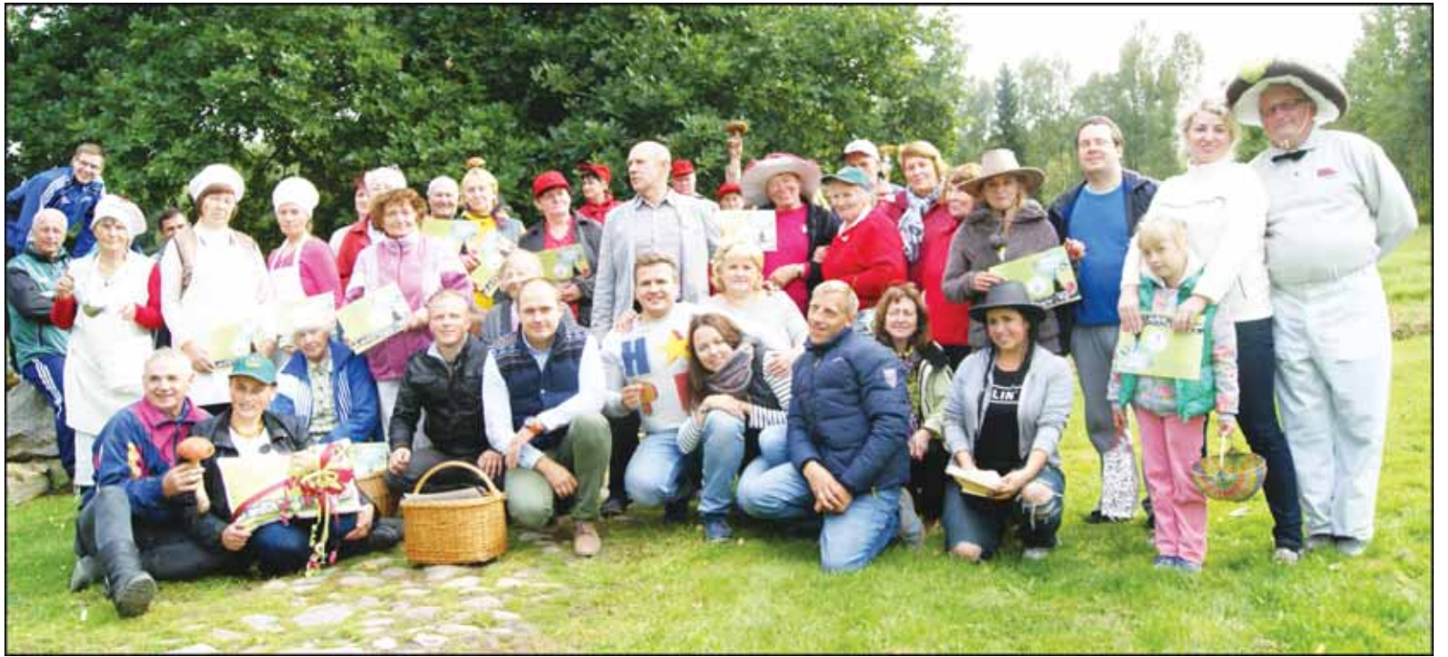
Grybavimo čempionato dalyviai.

Čempionato dalyviai aiškino, kaip teisingai grybauti – grybą išrauti ar nupjauti? Girininkas pamokė – pirmiausia išrauti, o paskui nupjauti, mat grybai dauginasi sporomis. Netrukus prisistatė visos komandos: „Ereliai“, „Raudonviršiai“, „Stasys ir Ko“ ir „Ma-