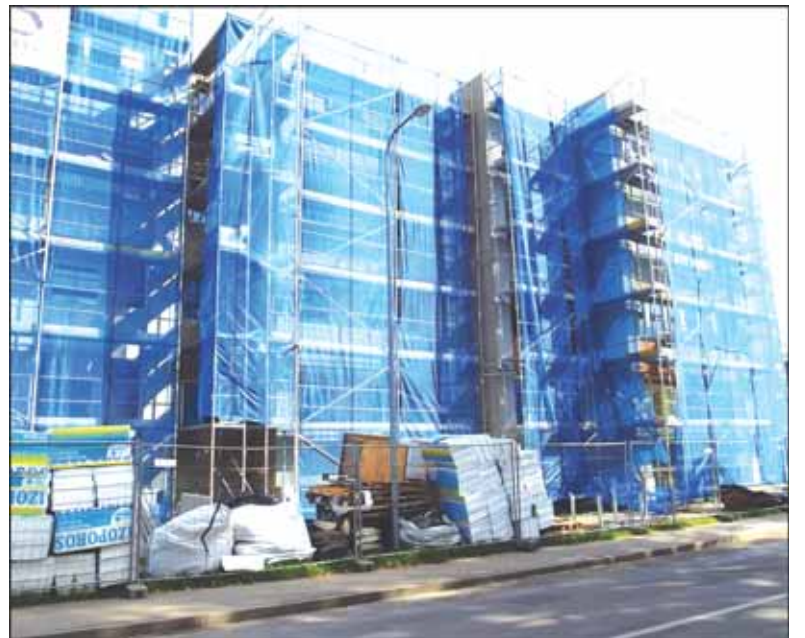
Renovuojamas Žalgirio gatvės 3-iasis namas.

Gyventojai žino, kad kuo anksčiau bus pradėta jų namo renovacija, tuo pigiau kainuos statybos darbai. Dalyvaujantiems pirmuosiuose dviejuose etapuose valstybė kompensuos 40 proc. statybos darbų, trečiame etape parama mažesnė – tik 35 proc. Nuo šiol gyventojai turės sumokėti už techninio