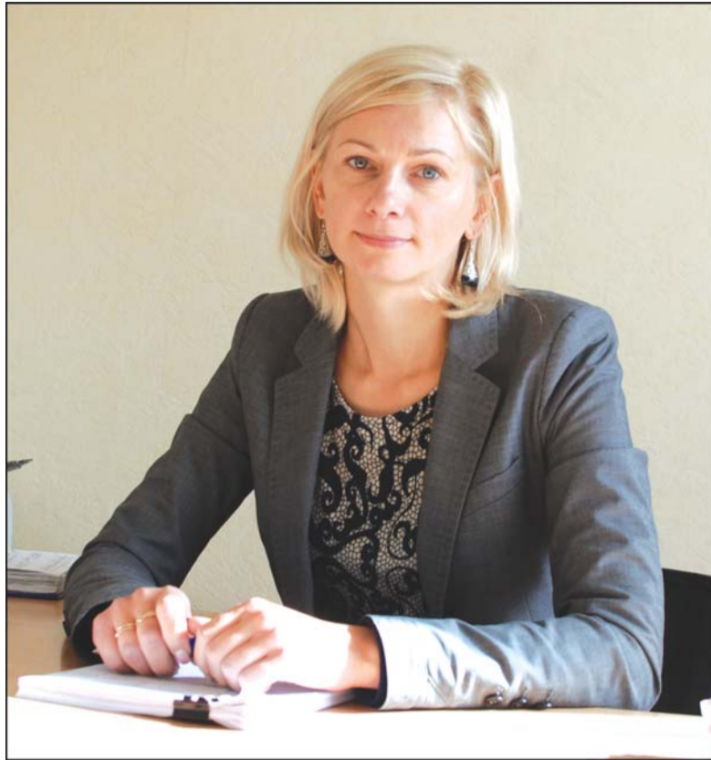
Pareigūnė J. Nausėdienė mano, kad „auklėdama“ savo vyrą moteriškė nesitikėjo tokių pasekmių.

P. niekada nedirbo, o tik visko reikalavo iš savo antrosios pusės. Vyrui išėjus į darbą, ji net maistą paimdavo, susidėdavo į maišelį ir iš-