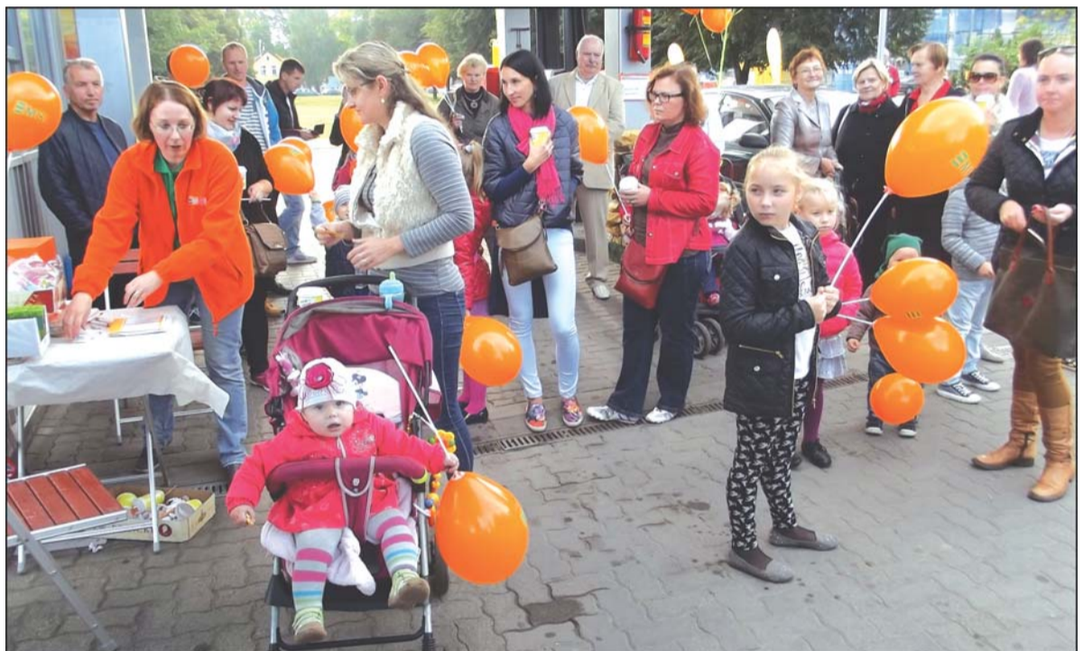
Šventinio gimtadienio akimirka.