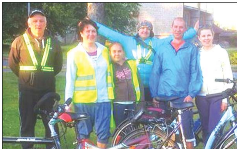
Po pirmojo pasivažinėjimo liepos 7-ąją.