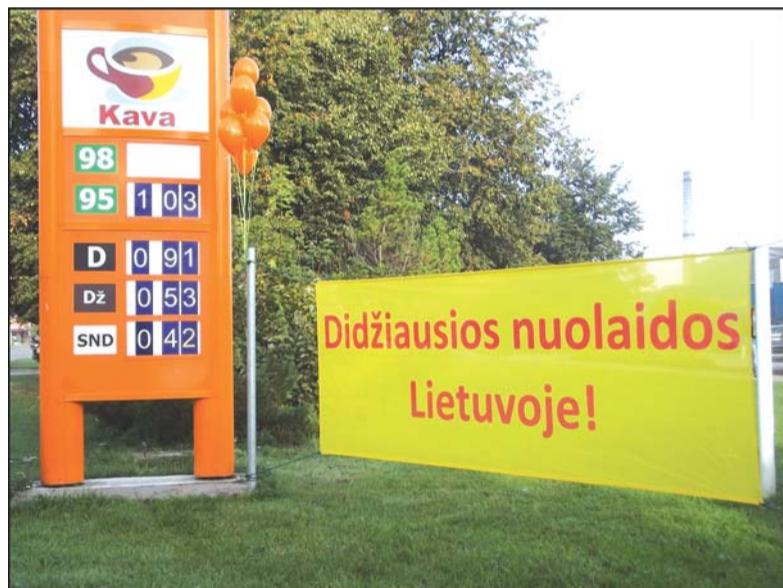
Šeštadienį šioje degalinėje buvo mažiausios degalų kainos Lietuvoje.

nus bei gamtos apsaugos reikalavimus. Šiuo metu bendrovėje dirba daugiau nei 170 žmonių. Tarp įmonės partnerių yra fiziniai asmenys, ūkininkai, privačios bendrovės ir valstybinės institucijos.