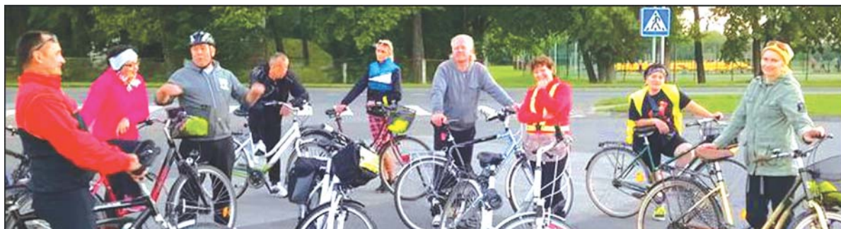
Išvykų dviračiais akimirka.

Dviratininkų klubo nariais yra įvairaus amžiaus žmonės - moksleiviai, bedarbiai, pensininkai, įvairių profesijų – nuo paprastų darbininkų iki mero patarėjo.