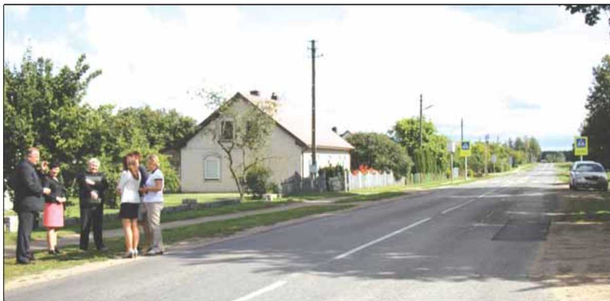
Jau kitais metais prasidės darbai centrinėje Lumpėnų gatvėje.