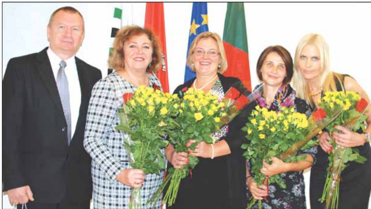
Renginyje dalyvavo ir komanda iš Saugų vaikų globos namų.

darbuotojų asociacijos iniciatyva nuo 2004 metų kasmet rugsėjo 27 d. Lietuvoje oficialiai švenčiama Lietuvos socialinių darbuotojų diena. Šventės data pasirinkta atsižvelgus į tai, kad rugsėjo mėnesį 1993 metais įvyko pirmasis Lietuvos socialinių darbuotojų asociacijos suvažiavimas. Be to, diena siejama ir su šv. Vincento Pauliečio vardu.