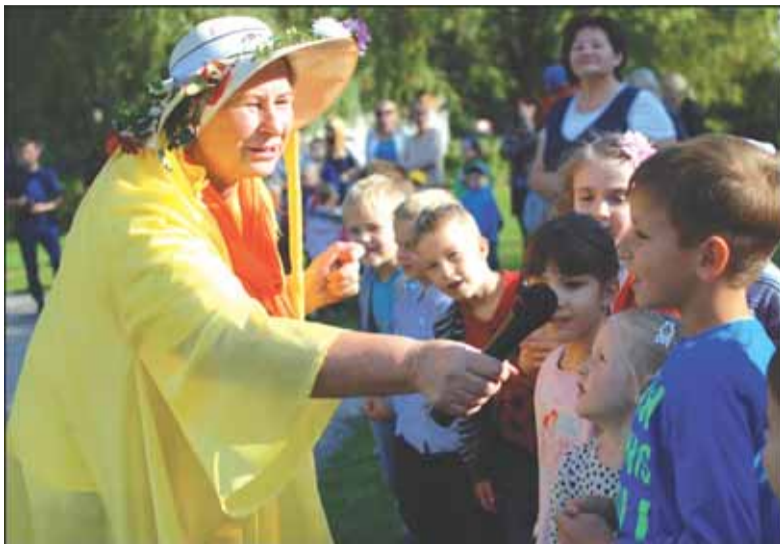
Atskubėjęs Rudenėlis mielai šoko ir dainavo drauge su lopšelio-darželio bendruomene.