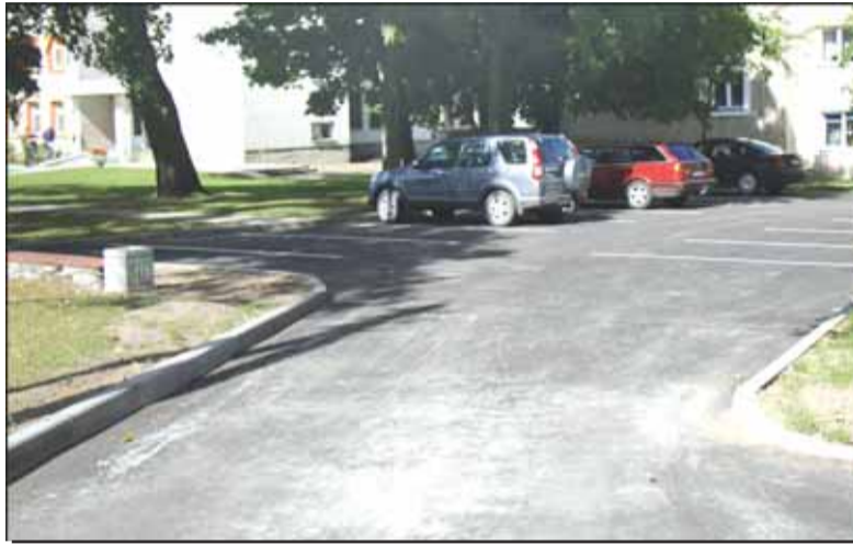
Šiemet Lumpėnuose naujai išasfaltuota ir sužymėta automobilių stovėjimo aikštelė.