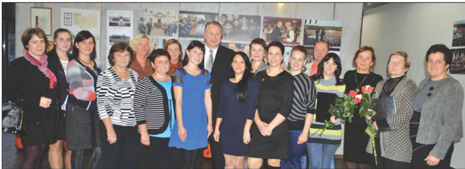
Pagėgių savivaldybės Socialinių paslaugų centro darbuotojai ir Pagėgių savivaldybės meras Virginijus Komskis (centre).

Meras kalbėjo ir apie Pagėgių vaikų globos namus, mat prieš kelerius dienas jis dalyvavo Panemunės pilyje Socialinės apsaugos ir darbo