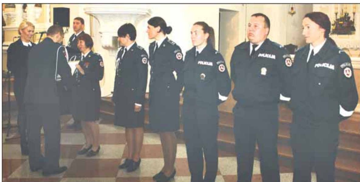
Pagėgių policijos komisariato pareigūnai.

tus stiprinant teisėtumą buvo įteikti pasižymėjimo ženklai bei padėkos.