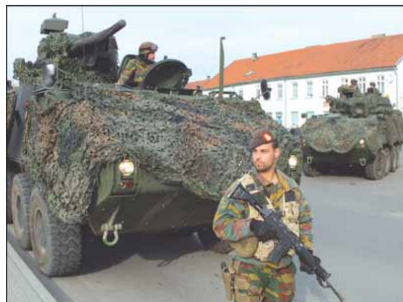
Pratybų „Baltijos piranija“ dalyviai iš Belgijos ir Liuksemburgo valandai stabtelėjo Šilutėje, senojo turgaus aištėje.

gos, kariai treniruosis vykdyti stabilizacijos operacijas, kitų bendrų veiksmų.