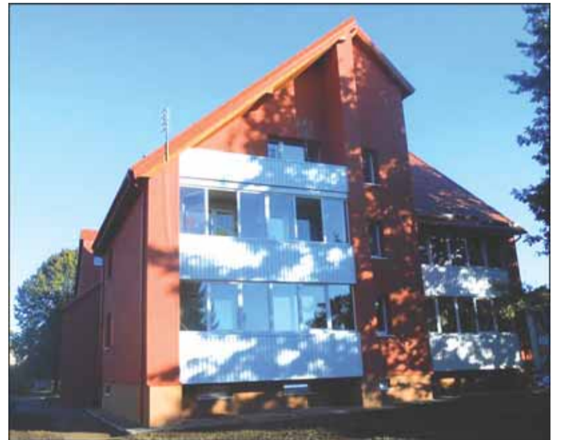
Šiloko g. 4 namas prieš renovaciją ir po jos.

pačius likusius kleckus , kurie buvo iki tol“, - dėstė Laimutė Barauskienė.