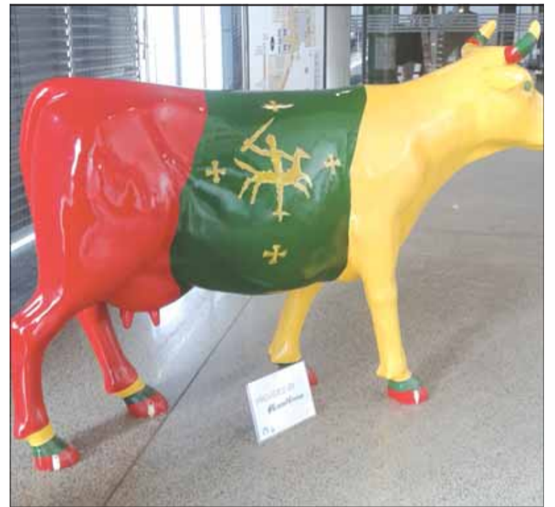
Lietuviškai „trispalvei“ karvutei už pieną mokama mažiausiai ES.