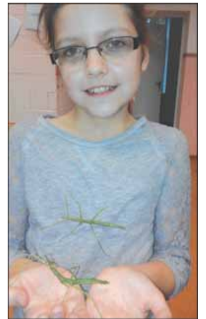
Gabija su gyvalazdėmis

Šis žmogus – gražus pavyzdys šiuolaikinėje visuomenėje, kurioje stokojama pagarbos ir sąžiningumo, rodan-