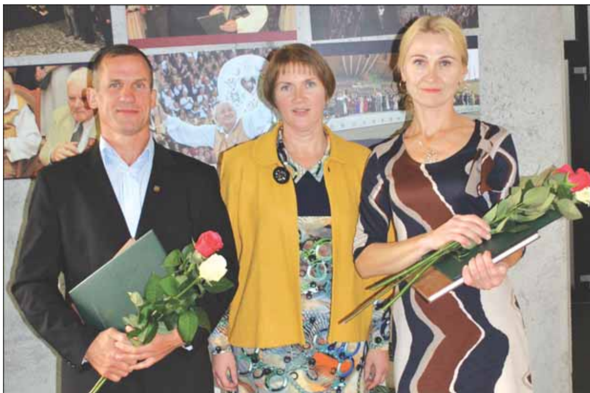
Pagėgių savivaldybės Meno ir sporto mokyklos pedagogai.

ministerijos kartu su regioninės plėtros atstovais surengtame posėdyje ir ten kalbėta, kad be tėvų likę vaikai turi gyventi šeimose. Mero manymu, tai būtų tikrai gerai – tik reikia dirbti, šviesti visuomenę, ir tai gali užtrukti apie dešimt metų.