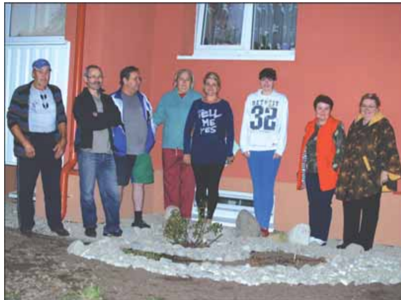
Po renovacijos namo gyventojai vieningai kibo į aplinkos tvarkymo darbus.

Darbininkai darbus atliko itin netvarkingai. Pavyzdžiui, besidarbuodami prie šildymo sistemos gyventojų butuose visiškai nesirūpi-no, kad jiems padarytų kuo mažiau nepatogumų. „Kai jiems reikėjo išgręžti skylę, išjungė drėklę. Atėjau ir išsigandau - bute viskas bal-