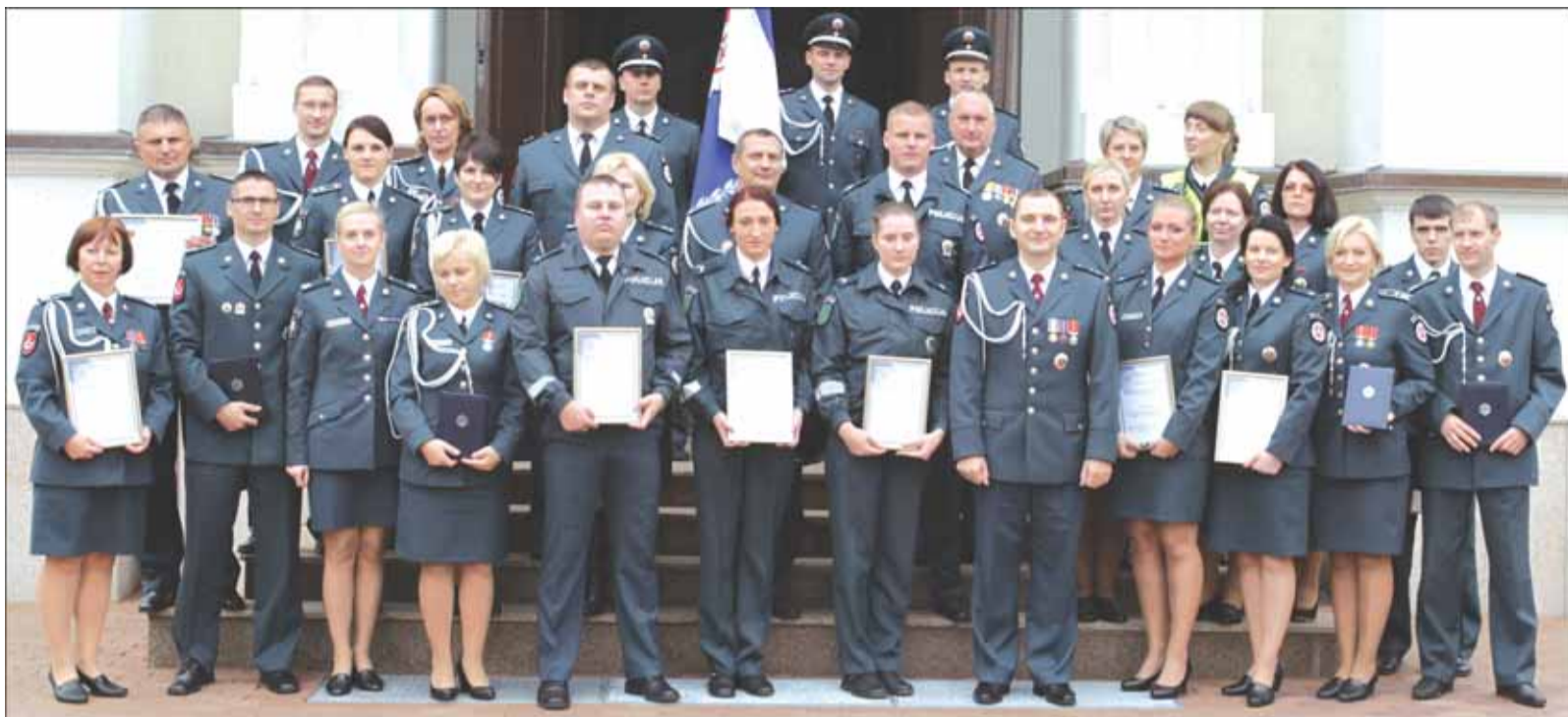
Šilutės rajono policijos komisariato pareigūnai.

Angelų sargų dienos proga buvo apdovanoti tarnyboje pasižymėję policijos pareigūnai. Jiems už nepriekaištingą ir pavyzdinę pareigų atlikimą, pasiektus rezulta-