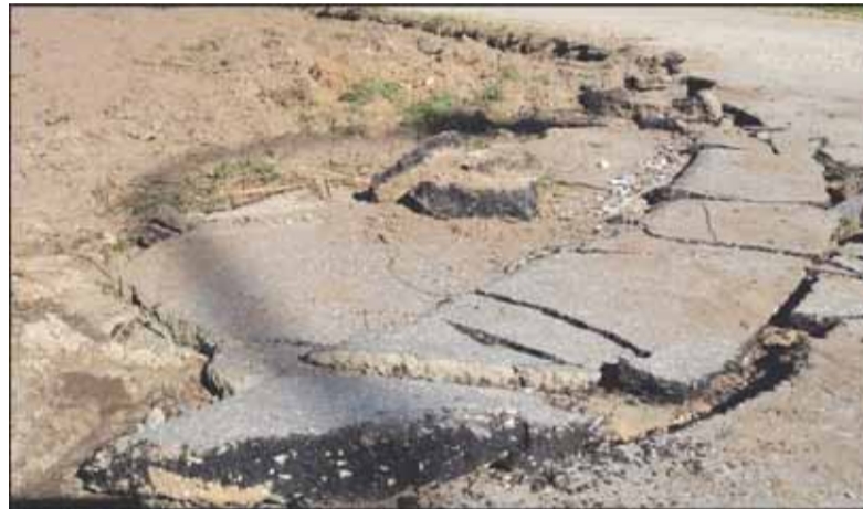
Kaimynai įsitikinę, kad ūkininkas kelią sugadino specialiai, nes jam nėra gražinama žemė.