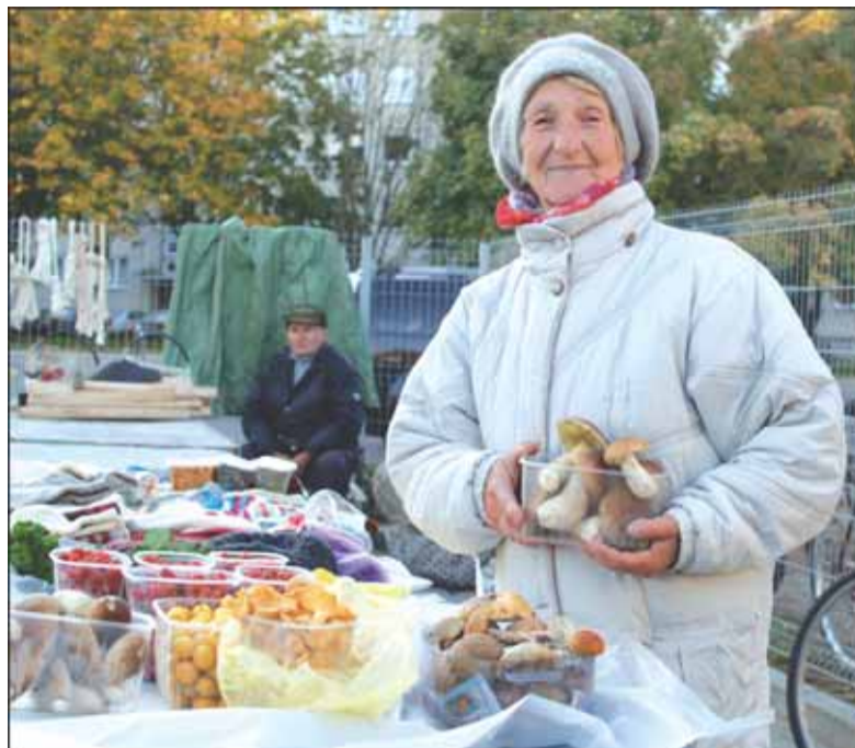
Šilutiškei G. Golubovskajai turguje tiesiog smagu pabendrauti su žmonėmis.