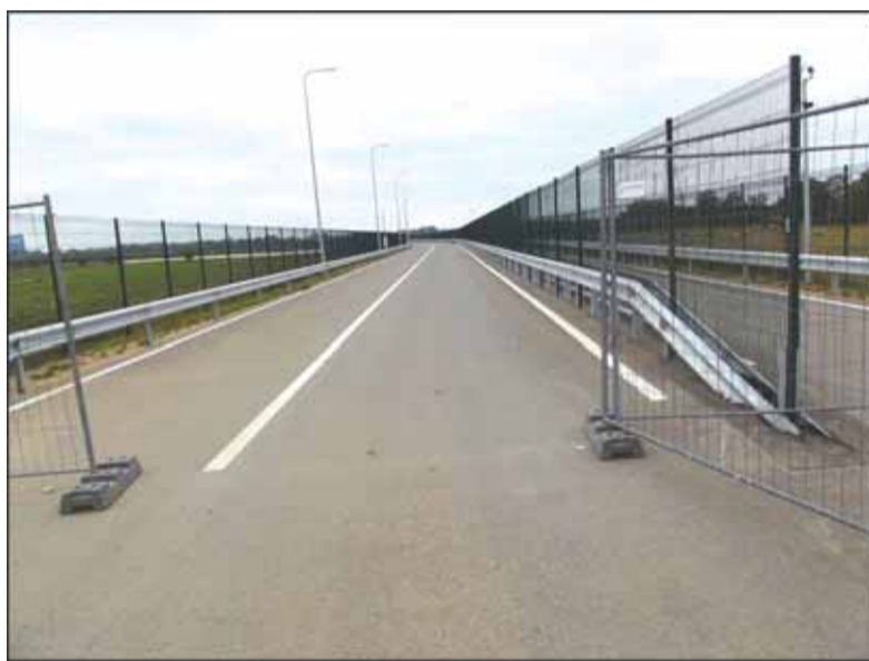
Aplinkkelis iš abiejų pusių yra aptvertas aukšta tvora, saugomas ir šalia būdinių pareigūnų, ir stebimas vaizdo kameromis.