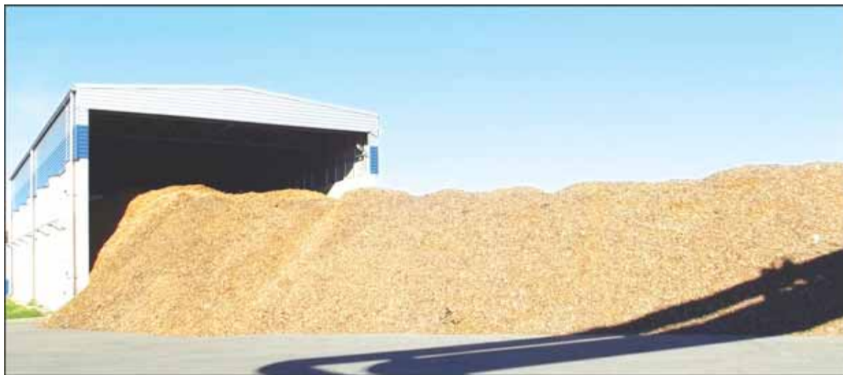
Vasarą nupirkta tiek daug pigaus biokuro, kad jo užteks beveik dviem mėnesiams.