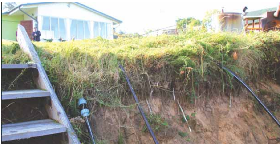
Griūvantiems Jūros upės krantams sutvarkyti reikia milijono eurų, o Pagėgių savivaldybė tiek pinigų neturi...