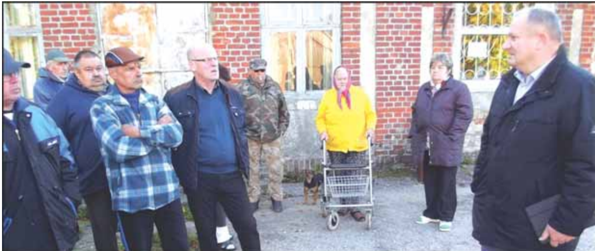
Paleitiškiams svarbiausia buvo išgirsti, kada gi bus išasfaltuotas 1,16 km ilgio žvyrkelis prieš gyvenvietę.

Kalbėdamas apie atlyginimus dar K. Komskis sakė, kad negali mokytoja ir valytoja gauti tokį pat atlyginimą – žmonės turi turėti motyvaciją mokytis, siekti karjeros. Pakėlus atlyginimą iki 437 eurų visa tai išnyktų. Todėl siūloma kartu su minimalaus atlyginimo didinimu vienodai kelti atlyginimus ir įvairių sričių biudžetinių įstaigų darbuotojams.