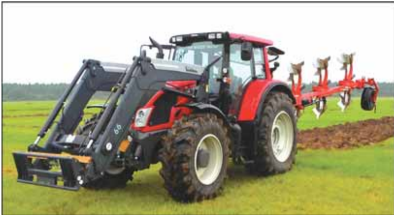
Rudeninio arimo konkurse bus išaiškintas geriausias Šilutės rajono rudeninio arimo artojas.

Jau lapkričio mėnesį vyks ypač jauniesiems ūkininkams aktualūs komerciniai mokymai „Agrarinė aplinkosauga ir kraštovaizdžio gerinimas“, „Aplinkosauga ir tręšimo planavimas“. O lapkričio 12 dieną vyks seminaras „Augalininkystės ir