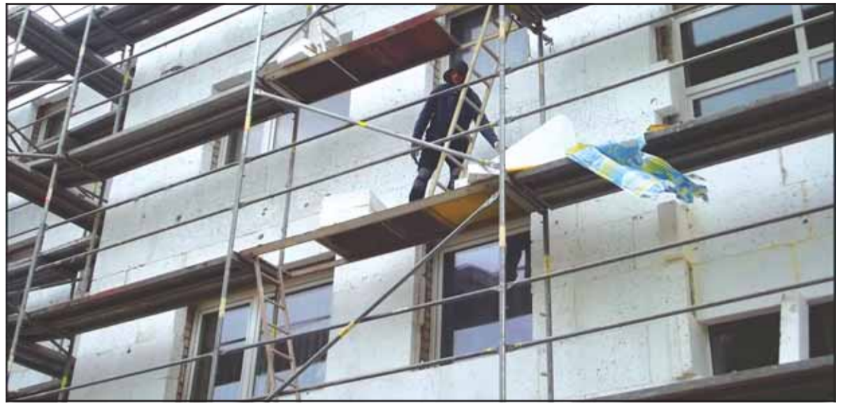
Mažai bedirba statybininkų, bet jų gali nebelikti nė vieno, nes statybinei įmonei nemokama už atliktus darbus.

„Prašėme statybininkų, kad jie dar dirbtų ir palauktų pinigų savai-