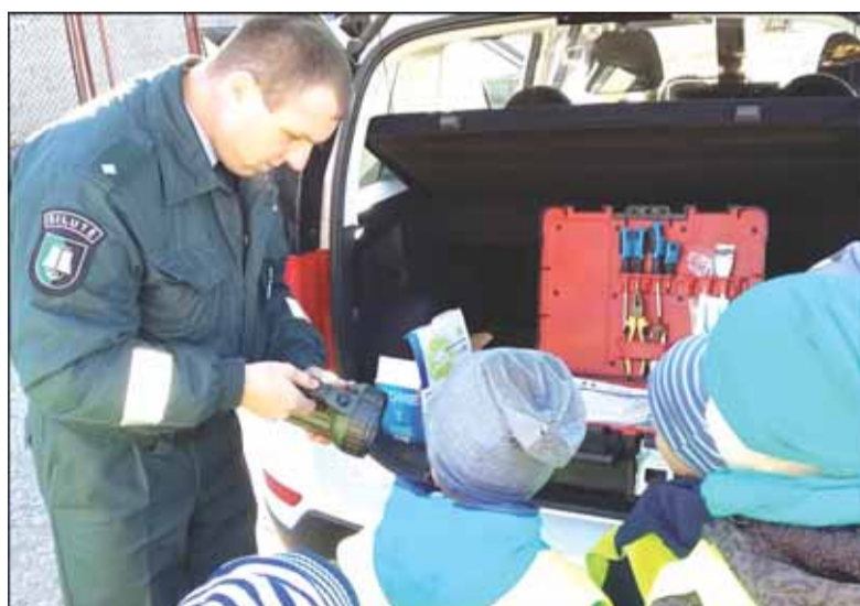
Policininkų susitikimo su darželinukais akimirks.

Projekto metu vaikai aiškino, ką reikia žinoti apie saugų eismą, žiūrėjo trumpametražius mokomojus filmukus apie saugaus eismo taisykles, piešė piešinius, darė knygutes bei atliko praktines užduotis saugaus eismo tema. Kartu su auklėtojais vaikai keliavo į Šilutės miesto centrą, kur mokėsi, kaip taisyklingai pereiti gatvę. Pareigūnai mažiesiems eismo dalyviams ne tik padėjo saugiai pereiti šviesoforo reguliuojamą sankryžą, bet ir pasakojo apie policininko profesiją, leido apžiūrėti policijos automobilį, pačiupi-