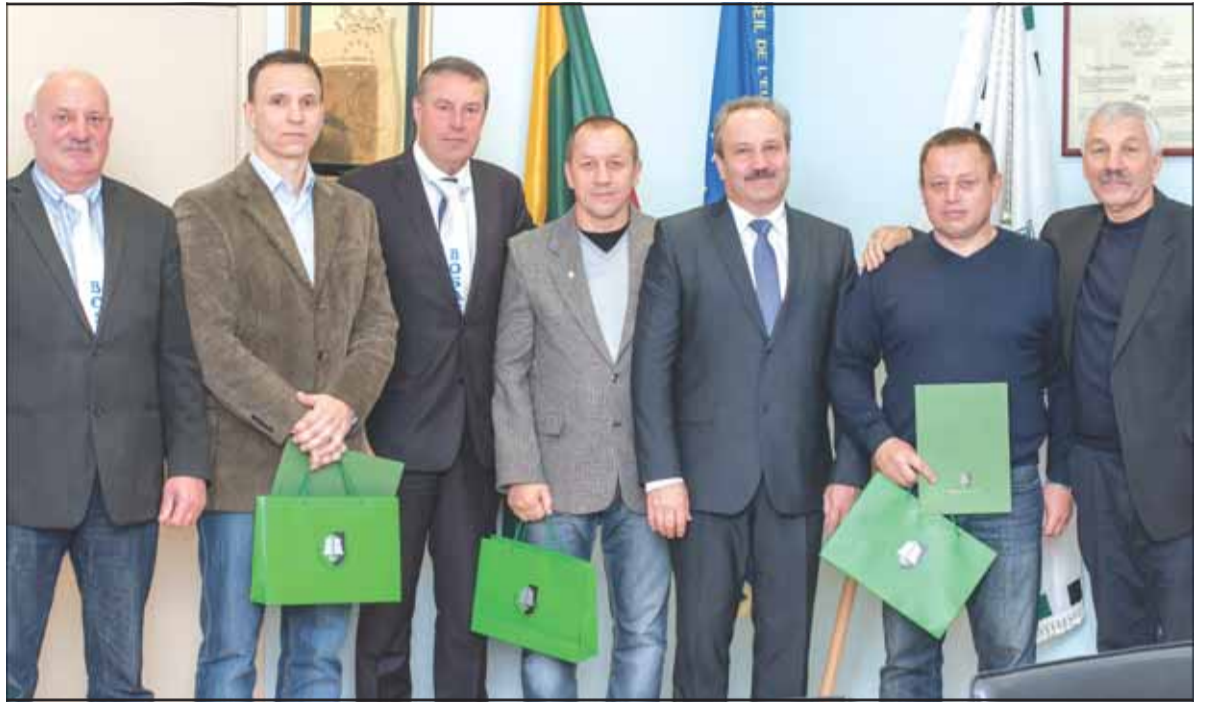
Šilutės dziudo imtynininkus, grįžusius iš žaidynių, sveikino Šilutės rajono valdžia.