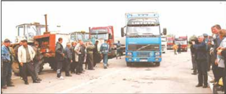
2003 metų gegužę Šilutės ir Pagėgių krašto ūkininkai dalyvavo Klaipėdos-Kauno automagistralės blokadoje netoli uostamiesčio.

Ūkininkai, reikalavę didesnės piniginės paramos žemės ūkiui, 2003-ųjų gegužę blokavo kai kuriuos kelius, vedančius į pasienį su Latvija ir Lenkija bei automagist-