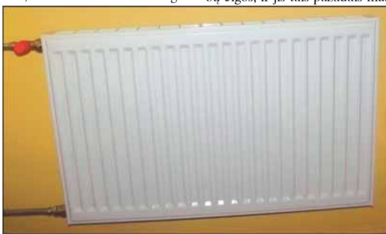
Kokia nauda iš to, kad radiatoriai nauji, bet nešildo?