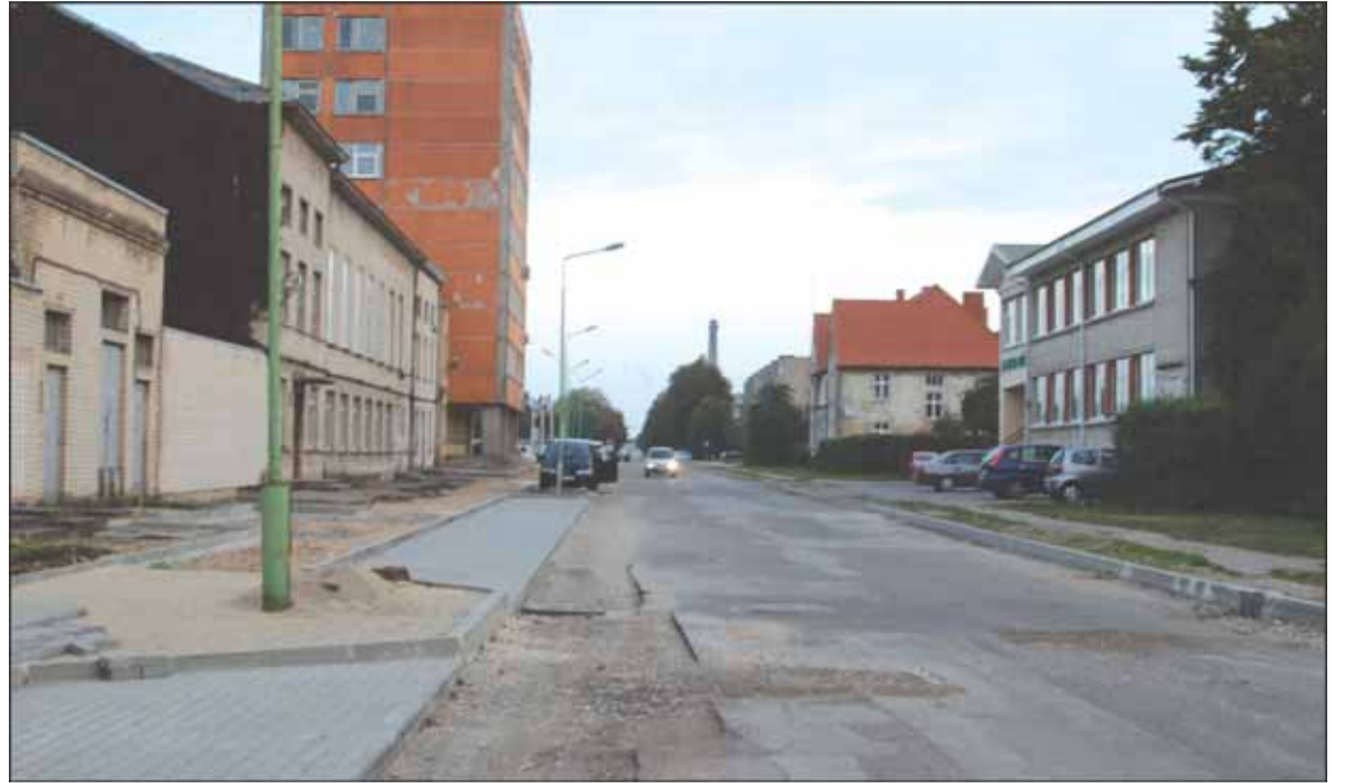
Dariaus ir Girėno gatvės gyventojai ateityje džiaugsis naujai pasodintais medžiais.

„Centrinė gatvė yra kultūros paveldo teritorijoje. Todėl vykdam darbus, pirmiausia važiuojame derinti su Klaipėdoje esančiu Kultūros paveldo departamento skyriumi. Visi gyventojai gali drąsiai kreiptis ir pranešti apie tai, kad kažkur yra pavojų keliantis medis. Mes tikrai juos apžiūrėsime ir imsime, reikalui esant, atitinkamų priemonių. Pasitaiko tokių, kad nori, jog būtų nupjautas sveikas medis. To gali niekas nesitikėti, nes sveikų medžių nepjauname. Apžiūrėję medį, pasakome tik – viso gero“, –