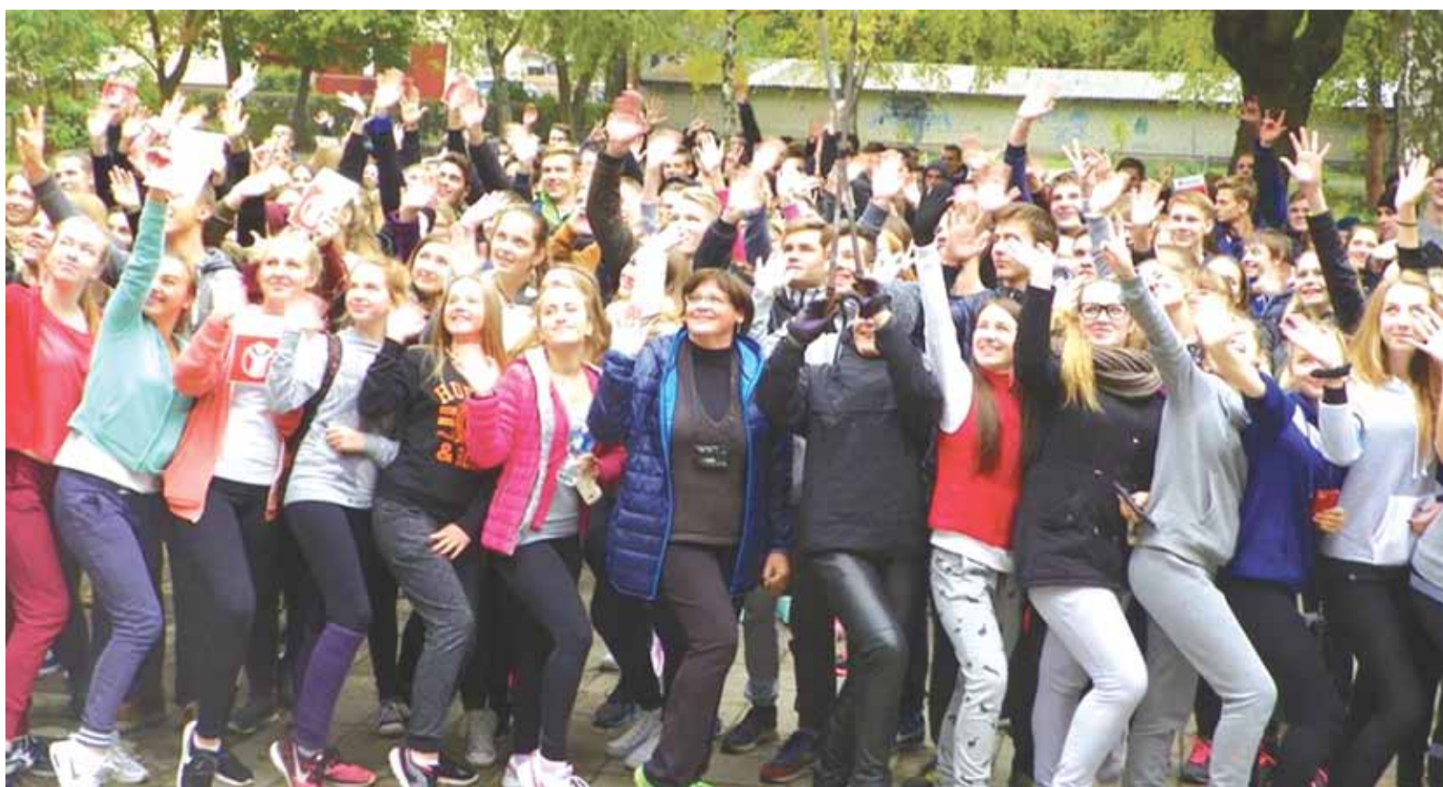
Solidarumo bėgimas Vydūno gimnazijoje suorganizuotas antrą kartą.

Solidarumo bėgimo tikslas – diegti solidarumo vertybes, empatiją, išpareigojimus ir aktyvų daly-