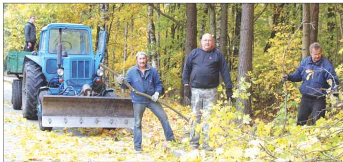
Darbuotojai mieliai tvarko teritoriją šalia kapinių.