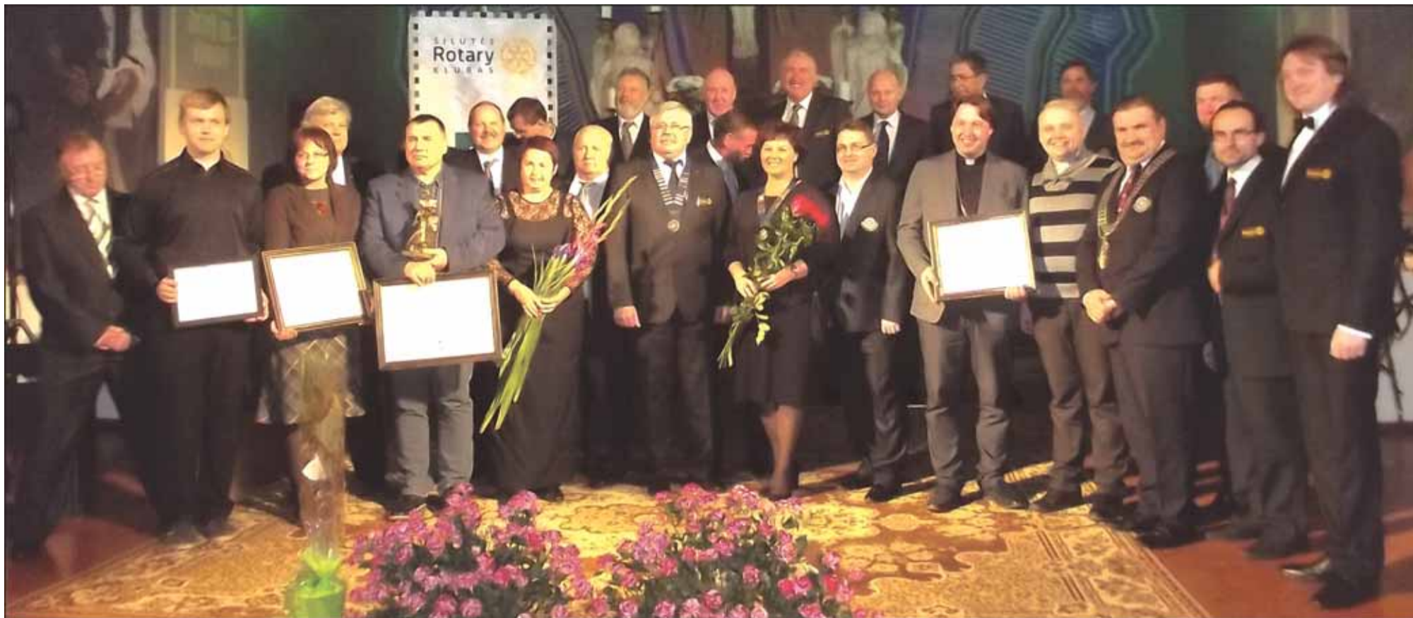
Šilutės Rotary ir „Inner Wheel“ klubų nariai nusifotografavo kartu su nominantais.