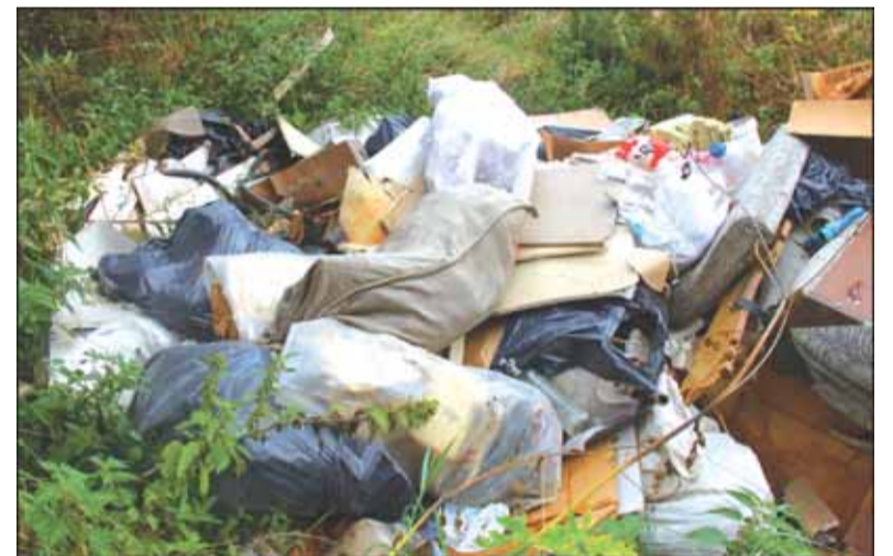
Blogiausia, kai nelegalūs ardytojai niekam neberekalingas automobilių detales išveža į gamtą.

„Už tai, kad nespėjo viską laiku susitvarkyti“, - atsakė bendruomenės pirmininkė.