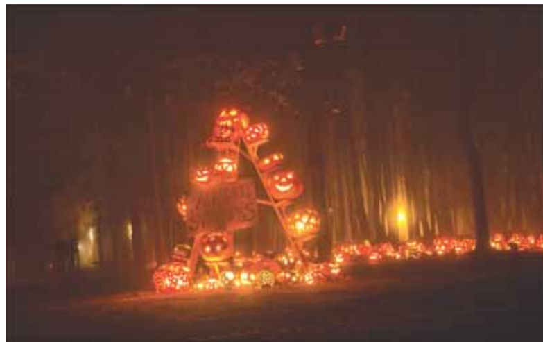
Švėkšniškių akcija „Mes už šviesą“ organizuojama ketvirtą kartą.