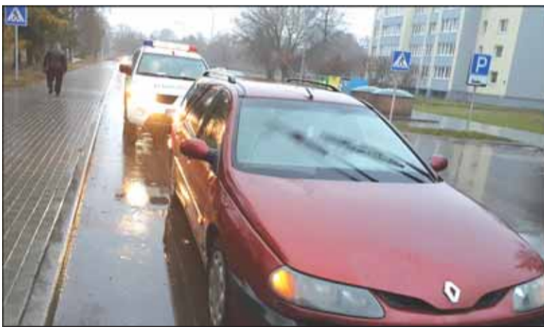
Cintjoniškių gatvėje sesutes partrenkė jauno, nepatyrusio vyriškio vairuojamas automobilis.

Sesutes partrenkė 25 metų vairuotojas lengvasis automobilis „Renault Laguna“. Jis vairuotojo pažymėjimą turi tik vienerius