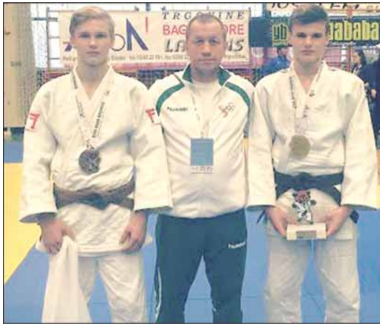
Tarptautiniame dziudo turnyre Panevėžyje šilutiškių jungtinė komanda su Plungės sportininkais lipo ant pakylos pasiimti apdovanojimų.

Du lapkričio savaitgaliai Šilutės dziudo atstovamas buvo itin aktyvūs – suspėta dalyvauti tarptautiniame turnyre Slovėnijoje bei tarptautinėse varžybose Panevėžyje. Puikūs šilutiškių sportiniai rezultatai, kurie nušluostė nosį ne vienam varžovui.