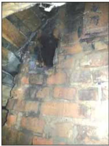
Šis kaminas - apgriuves, pro jį veržiasi dūmai. Šį kamina ir bando rasti „Šilutės būstas“.