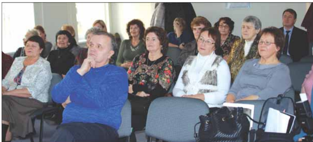
Į susitikimą atėjo būrys medicinos darbuotojų.

dainavo, bet ir visus susirinkusiuosius išuko į šokių sūkurį. Tadien ligoninės konferencijų salėje tiesiog ore tvyrojo gera nuotaika, nuoširdumas, o šventės dalyviai vienas kitam dovanojo šypsenas.