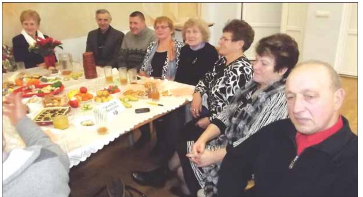
Festivalyje kaip svečiai dalyvavo ir Vainuto neįgaliųjų draugijos nariai.

Ne vieną valandą tą dieną Vainuto bendruomenės namų salėje aidėjo gražios dainos, trunkūs šokiai, skambė muzika – visiems buvo labai linksma. Festivaliui baigiantis seniūnas V. Mockus folkloro kolektyvų vadovams įteikė padėkas ir po firminį suvenyrą – kavos puodelį su Vainuto herbu.