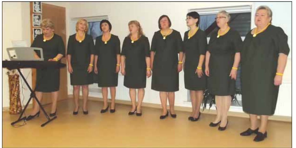
Savo muzikinius kūrinius dovanojo Saugų moterų vokalinis ansamblis „Artuma“.

„Mes dabar gyvename laukimo laikotarpyje. Ruošiamės jam. Pradedame nuo namų tvarkymo, papuošimo. Ieškome parduotuvėse kuo gražesnių žaislų, kad namai būtų jaukūs, šventiški, kad kiti jais pasidžiaugtų. Bet mes turime dar vienus namus. Tai sielos namai. Adventas - tas laikotarpis, kada labai geras laikas įeiti į savo dvasios namus. Praverti jų duris, kad nuvalytume pykčio dulkes, kad nurinktume pavydo voratinklius. Kad namai taptų erdvūs, pripildyti meilės, atjautos ir šilumos. O išėję į gatvę turėsime ką padovanoti vienas kitam. Prieš šį susitikimą buvau labai nuoširdžiamose susitikime, kuriame dalyvavo ir vienuolės. Viena jų išsakė labai gražią pastabą lietuviams. Jiems trūksta tik 2 centimetrų – vieno kairiajame lūpų kamputyje, kito dešiniajame. Rei-