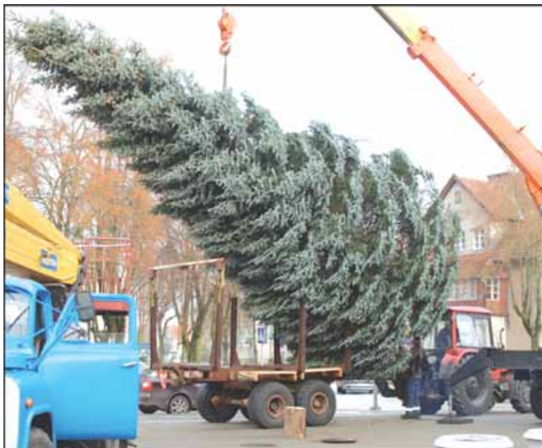
Ne vienas teigė, jog šiemet Šilutės kalėdinė eglutė bus gražiausia šalyje.