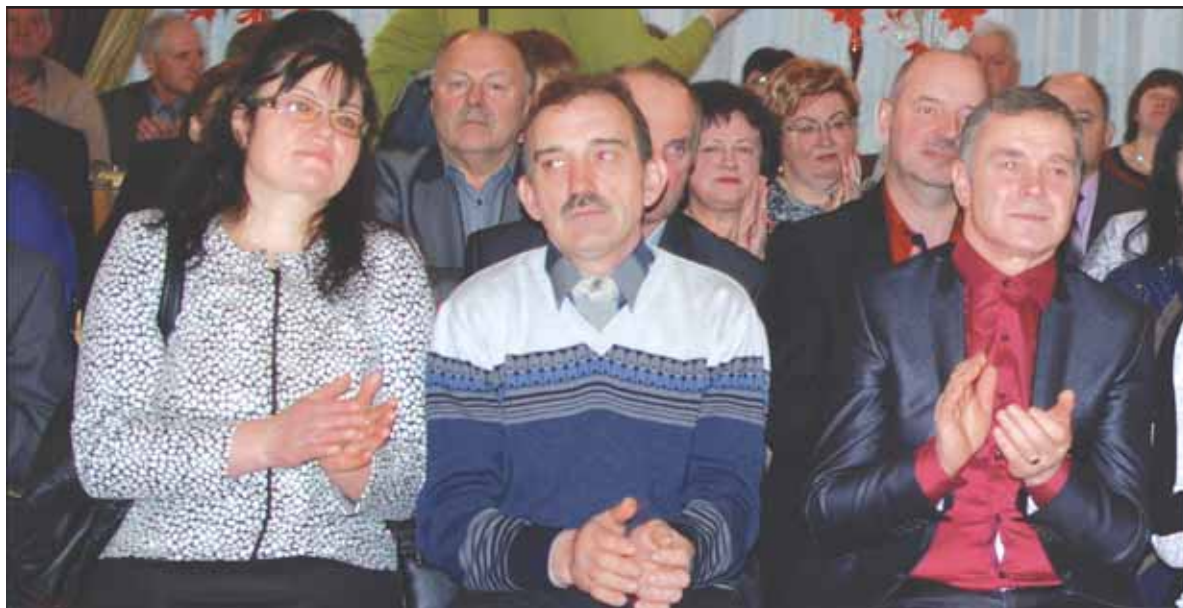
Susirinko gausus būrys ūkininkų.