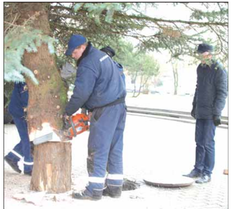
Eglutės pastatymo darbus atliko seniūnijos darbuotojai.

Eglė bus puošama šią savaitę. Jos įžiebimo šventė vyks penktadienį, gruodžio 11 dieną, nuo 10 valandos ryto. Eglutės įžiebimo ceremonijos pradžia 17 val. 30 min.