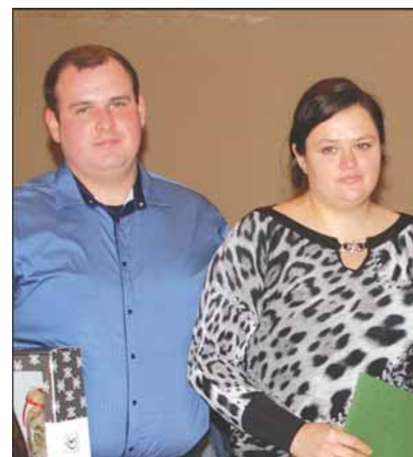
T. ir I. Erciai.

skriauda ūkininkams“, - dalijosi mintimis meras. Jis teigė, kad jau susikūrė Šilutės rajono pieno gamintojų asociacija. Tikimasi, kad ji suburs rajono ūkininkus.