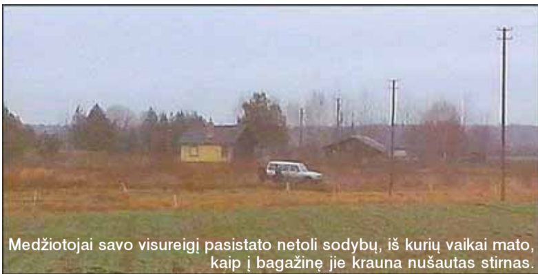
Medžiotojai savo visureigį pasistato netoli sodybų, iš kurių vaikai mato, kaip į багаžinę jie krauna nušautas stimas.

„Norėčiau žinoti, kada vyks medžioklė. Juk jeigu tuo metu aš ečiau pas kaimynę ar šiaip į miškelį pasi-