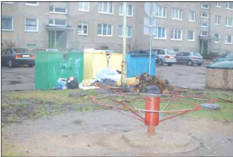
Vaikų žaidimų aikštelė Melioratorių alėjoje.