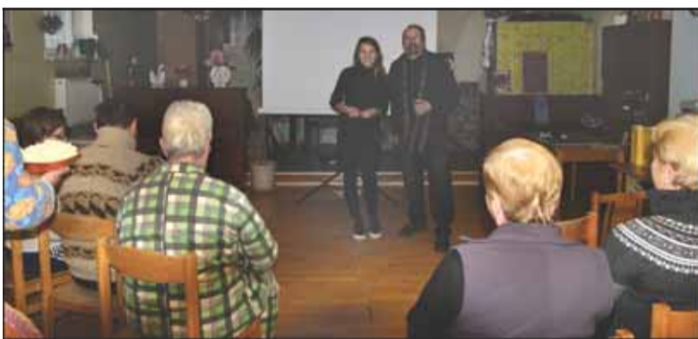
Pokalbis po filmo demonstravimo su Švėkšnos ligoninės pacientais.

P raėjusią savaitę Klaipėdos jūrininkų ligoninės Švėkšnos psichiatrijos departamentas sulaukė netikėtų svečių. Ligoniams nuotaikingą kino komediją „Kaip pavogti žmoną?“ atvežė Lietuvos kino studijos kūrybinė grupė, vykdanči projektą „Svečiuose – kinas“. Tai projektas, skirtas senelių namų globotiniams, pabėgėlių centrums, sanatorijų, ligoninių pacientams. Projektu siekiama sugrąžinti kolektyvines kino peržiūras, susitikimus su žiūrovais, bendrus diskusus, aptarimus su kūrėjais ir aktorais. Gydomo, globos namų, kitų įstaigų pacientai dažnai neturi jokios galimybės pasižiūrėti tikro kino, tad sumanyta keliauti ir rasti tą žiūrovą.