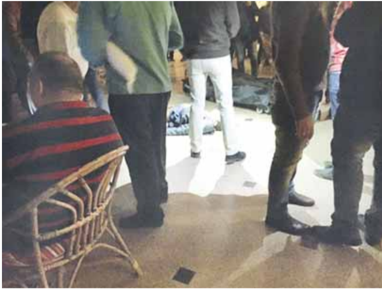
Po teroro akto buvo vienas vyriškis nušautas.

Visa tai matė ir šilutiškis verslininkas S. Stankevičius. Jis iš Egipto į Lietuvą parsiskrido jau kitą