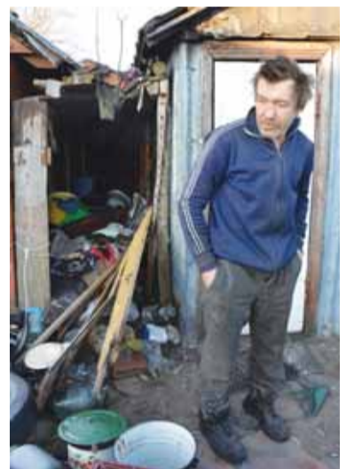
Vyriškio „namuose“ – be galo šilta, jis čia gyvena kartu su draugu.

pasidalino čiužiniu ir išsprendė problemą tiesiog jį sudegindami.