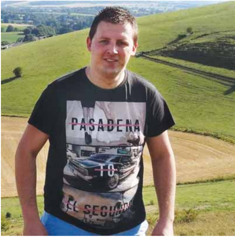
S. Zagursko filmuota vaizdo medžiaga įkelta į youtube sukėlė itin daug diskusijų.