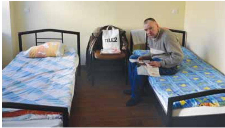
Kambariuose jauku, šilta ir tvarkinga. Gyventojai griežtai mokomi tvarkos bei švaros.

gautų produktų arba iš nuosavų pinigų nusipirktų. Iš savo gyventojų reikalaujame švaros ir tvarkos, net atvežtuosius naktį, jei reikia, būdintysis nuprausia ir perrengia švairiais rūbais“, – pasakojo centro direktorė.