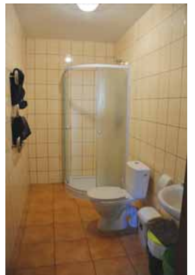
Štai tokie vonios kambariai įrengti kiekviename kambarielyje. Kiekvieną dieną gyventojai privalo juos sutvarkyti ir išvalyti.

Išvykome H. Šojaus gatvės link. Ten mus „pasitiko“ dar gana geros būklės, tačiau jau daug metų apleistas pastatas. Tik įžengus pro „duris“ tapo aišku, kad čia – benamių viena iš susibūrimo arba nakvynės vietų. Mažame kambarielyje pareigūnai aptuko sudegintą čiužinį ir čia pat pajaukavo, kad turbūt kambario „draugai“ susipyko, ne-