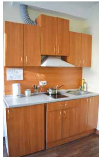
Tokiomis virtuvėlėmis kasdien naudojasi centro kambariuose gyvenantys gyventojai.