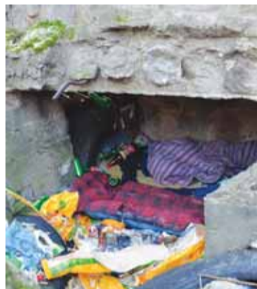
Pasivaikščiojus po tokius apleistus pastatus – nukrečia šurpas.

slaugų centre bebūtų gražu ir jauku, jame pabuvojęs susimąstai, jog geriau stengtis ir daryti viską, kad čia nepapultum.