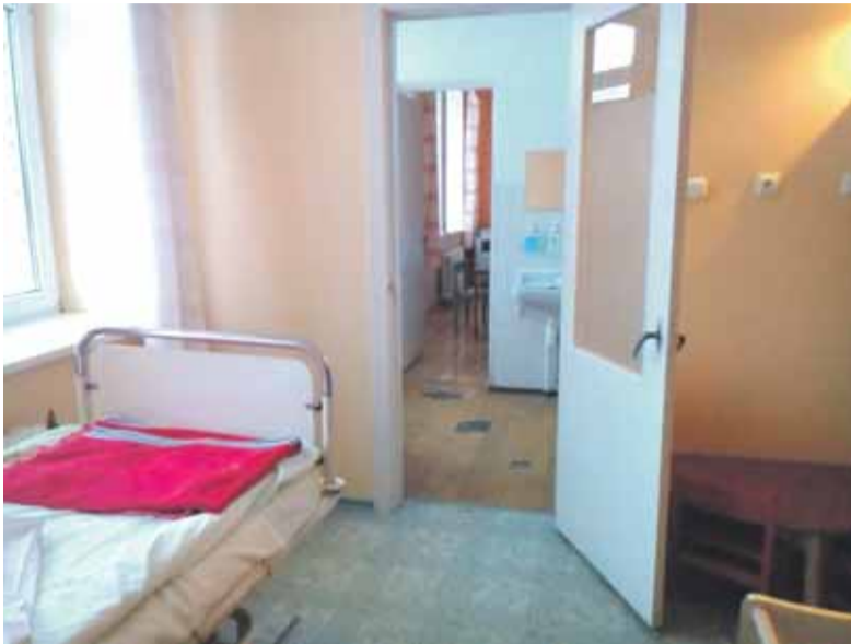
Taip atrodo palatos, kurios naudojasi vienu sanitariniu mazgu.