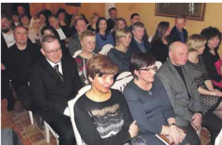
Padėkos vakare dalyvavo daug švėkšniškių ir svečių.