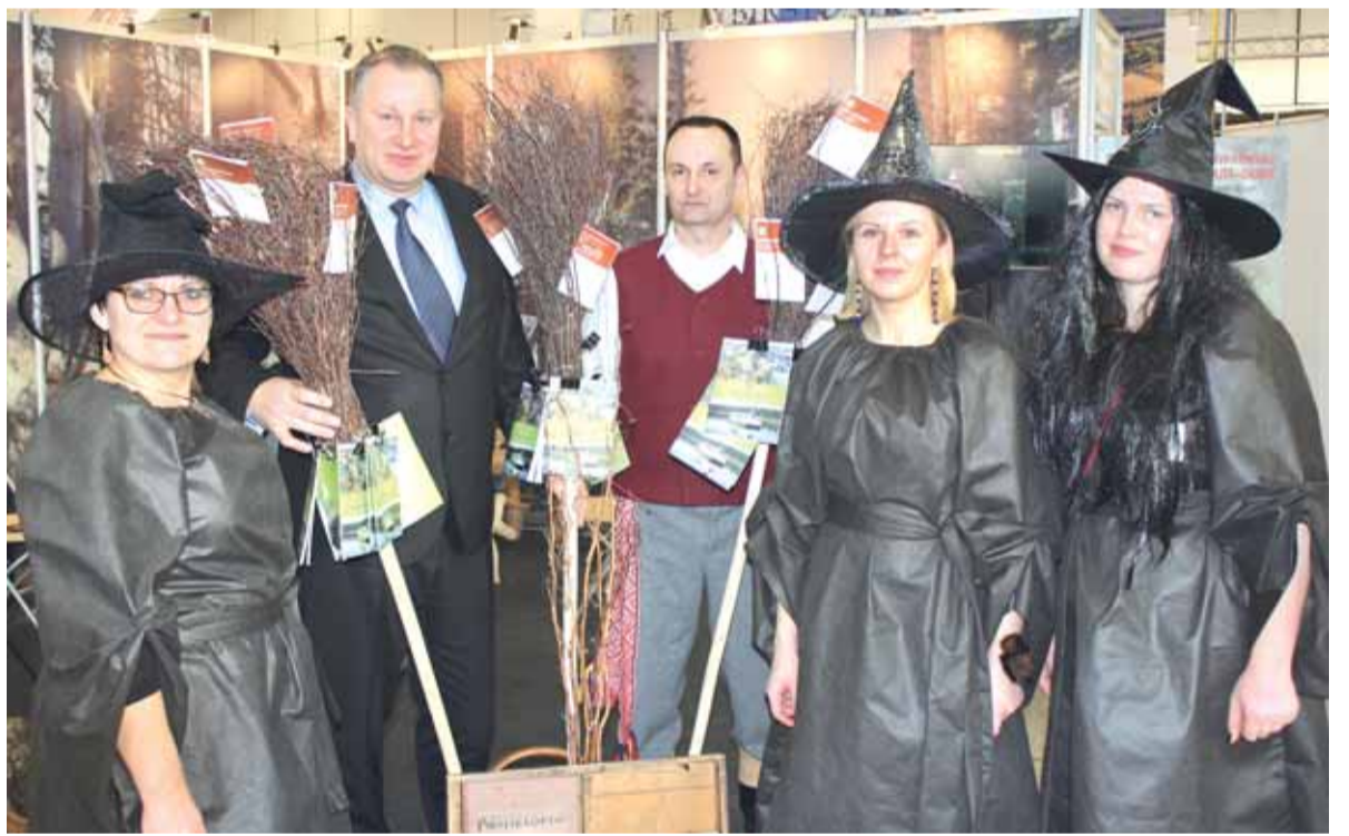
Pagėgiškiai parodoje „Adventur 2016“.

Besidomintiems krašto istorija pasiūlyta aplankyti įdomią ir in-