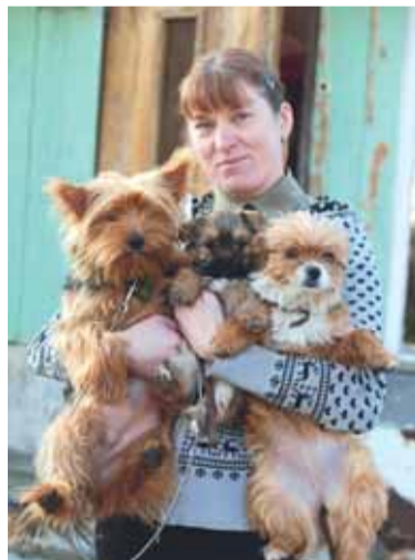
Džiugina Astos širdį trys gražuliai šuniukai.

„Dabar mano namas - medinis paprastas namelis. Kai į jį persikrausčiau, jis buvo labai apleistas, net aplinka nesutvarkyta. Virtuvėje brolis sudėjo naujas grindis. Pati