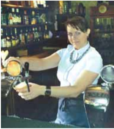
Barmene Dovile didžioji UAB „Senasis Rambynas“.

Tauragės apskrityje sausio 1 dieną iš viso buvo 7 475 bedarbiai, tai yra 11,8 proc. visų darbingo amžiaus gyventojų arba 0,7 proc. punkto mažiau negu praėjusių metų pradžioje. Mažiausiai darbingo amžiaus gyventojų bedarbiais registruota Šilalės rajone (8,2 proc.), daugiausia - Jurbarko rajone (14,5 proc.), Pagėgių savivaldybėje - 11,2 proc., Tauragės rajone - 12,4 proc. Didžiausią įtaką nedarbo mažėjimui apskrityje turėjo išaugusios užimtumo galimybės. Nuo 2015 metų pradžios padėta įsadarbinti