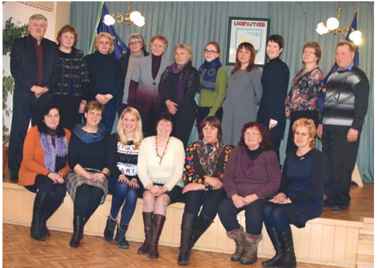
Aptarti įvairius seniūnijai rūpimus klausimus susirinko būrys seniūnijos seniūnaičių, bendruomenių pirmininkų, aktyvistų.