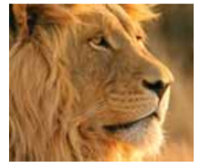
6.05 „Genijai iš prigimties“.

6.39 TV parduotuvė. 6.55 Reporteris. 7.45 Lietuva tiesiogiai. 8.15 „Nepriylgstamieji gyvūnai“. N-7. 9.20 „Miškinis“. N-7. 10.25 „Slaptieji agentai“. N-7. 11.30 „Moterų daktaras“. N-7. 12.30 Ginčas. N-7. 13.30 „Nepriylgstamieji gyvūnai“. N-7. 14.40 TV parduotuvė. 14.55 „Miškinis“. N-7. 16.00 Žinios. 16.25 „Magda M.“. N-7. 17.30 Lietuva tiesiogiai. 18.00 Reporteris. 18.50 Kuriam ateičiai. 18.55 „Miškinis“. N-7. 20.00 Žinios. 20.25 „Kulinaras“. N-7. 21.30 Vaivos pranašystės. N-7. 22.30 Reporteris. 23.20 Ginčas. N-7. 0.20 „Miškinis“. N-7. 1.20 Reporteris. 2.05 „Nepriylgstamieji gyvūnai“. N-7. 2.55 „Genijai iš prigimties“. N-7. 3.25 „Jaunikliai“. N-7. 3.55 „Nepriylgstamieji gyvūnai“. N-7. 4.45 „Genijai iš prigimties“. N-7. 5.15 „Laukinis pasaulis“. N-7. 5.35 „Jaunikliai“. N-7.