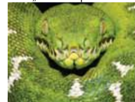
6.15 „Nepriylgstamieji gyvūnai“. N-7.

7.00 TV Pagalba. N-7. 8.40 Oliverio tvistas. Kulinarinė laida. 9.40 „Linksmieji traukinukai“. 10.10 Senoji animacija. 11.10 Nuotakos dvejonės. N-7. 13.00 „Laukinukė“. N-7. 14.00 „Pasmerkti 2“. N-7. 15.00 Ekstremalus namų pokyčiai. 17.00 Oliverio tvistas. Kulinarinė laida. 17.00 „Laukinukė“. N-7. 18.00 „Tai - mano gyvenimas“. N-7. 20.00 Labanakt, vaikučiai. 21.00 „Tai nutiko Jemene“. Komedija. N-7. 23.05 „Tai - mano gyvenimas“. N-7. 1.00 Ekstremalus namų pokyčiai.