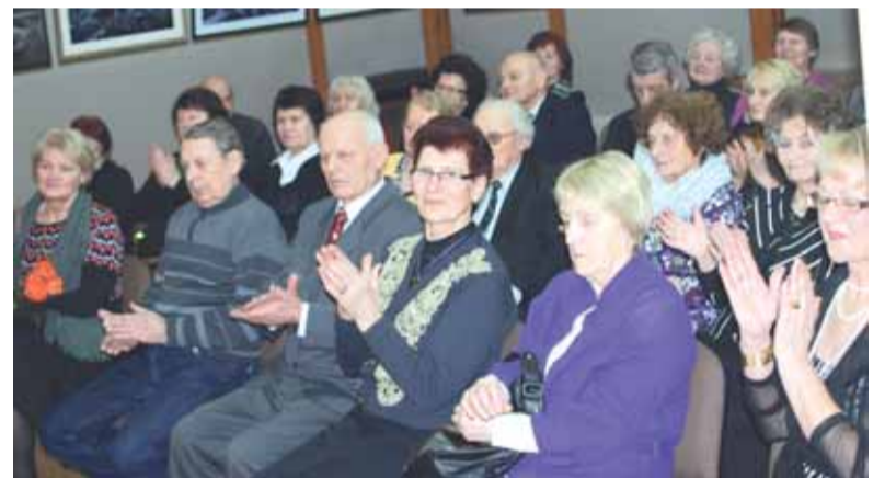
! parodos atidarymą atėjo būrys žmonių.