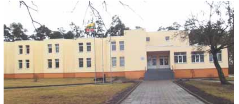
Dabar Šilgalių daugiafunkcis centras ir iš išorės atrodo gražiai.