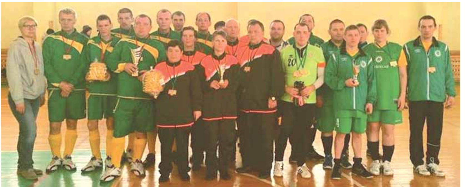
Respublikinio-jungtinio salės futbolo čempionato nugalėtojai Macikų socialinės globos namų sportininkai su kitais prizinių vietų laimėtojais.

Visų lygių nugalėtojams atiteko medaliai, taurės ir saldieji prizai. Tarp grupės varžybų Šiaulių sporto gimnazijos regbininkai, kartu su „Baltrex-Šiauliai“ komanda, jauniausiems Šiaulių specialiojo ugdymosi centro sportininkams suorganizavo estafetes ir pasakojimo regbio žaidimo subtilybes.