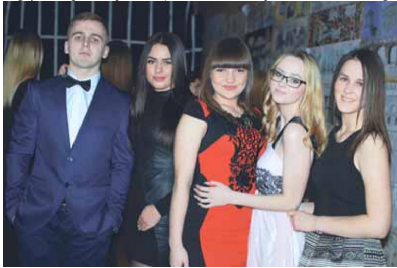
Šilutės pirmosios gimnazijos šimtadienio šventėje.

Po oficialios dalies ir šių dvyliktokų laukė autobusai, kurie juos nuvežė į tą pačią Tarvydų sodybą, kur buvo paruošti stalai, surengta